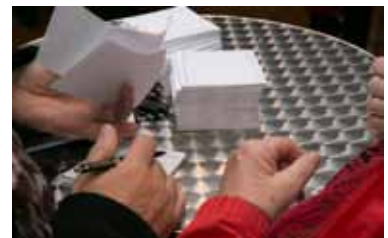
1. Informationsveranstaltung am 21. Oktober 2015