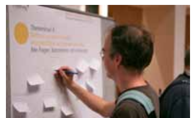
2. Informationsveranstaltung am 10. November 2015