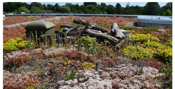
Ein Biodiversitätsgründach in Berlin: Totholz, Hügel und Steinhäufen schaffen Lebensräume für Tiere und Pflanzen.

Förderung: 25€/m 2 Grünfläche, max. 5.000€ pro Liegenschaft