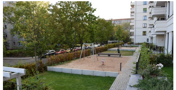
Ein Retentionsgründach mit Rasenflächen und Hecken auf der Tiefgarage einer Wohnanlage in Berlin.

Förderung: 45€/m 2 Grünfläche, max. 5.000€ pro Liegenschaft