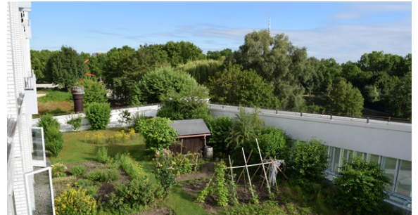
Eine Intensivbegrünung in Mannheim: Das Dach bietet Platz für Bäume, Sträucher und Gemüsebeete.

Förderung: 45€/m 2 Grünfläche, max. 5.000€ pro Liegenschaft