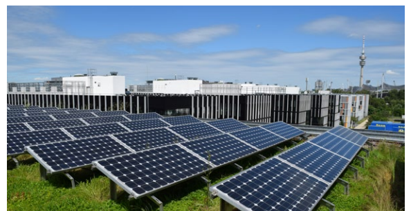
Ein Solargründach in München: Dank ausgesuchter kleinwüchsiger Pflanzen werden die Module nicht verschattet.

Förderung: 20€/m 2 Bruttokollektorfläche, max. 2.000€/Liegenschaft