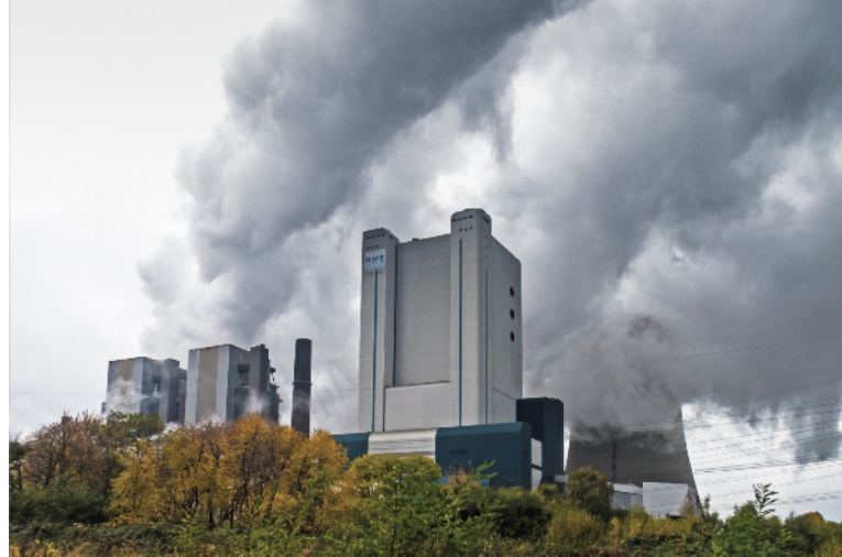
Wählen Sie selbst zwischen Ökostrom aus PV oder dem Strom aus z.B. Kohle

Weitere Nachteile fossiler Brennstoffe, die Gesundheit und Lebensraum des Menschen gefährden, verringert der Einsatz von PV ebenfalls. Denken Sie etwa an den enormen Flächenverbrauch durch den Abbau von Braunkohle! Hinzu kommt, dass die