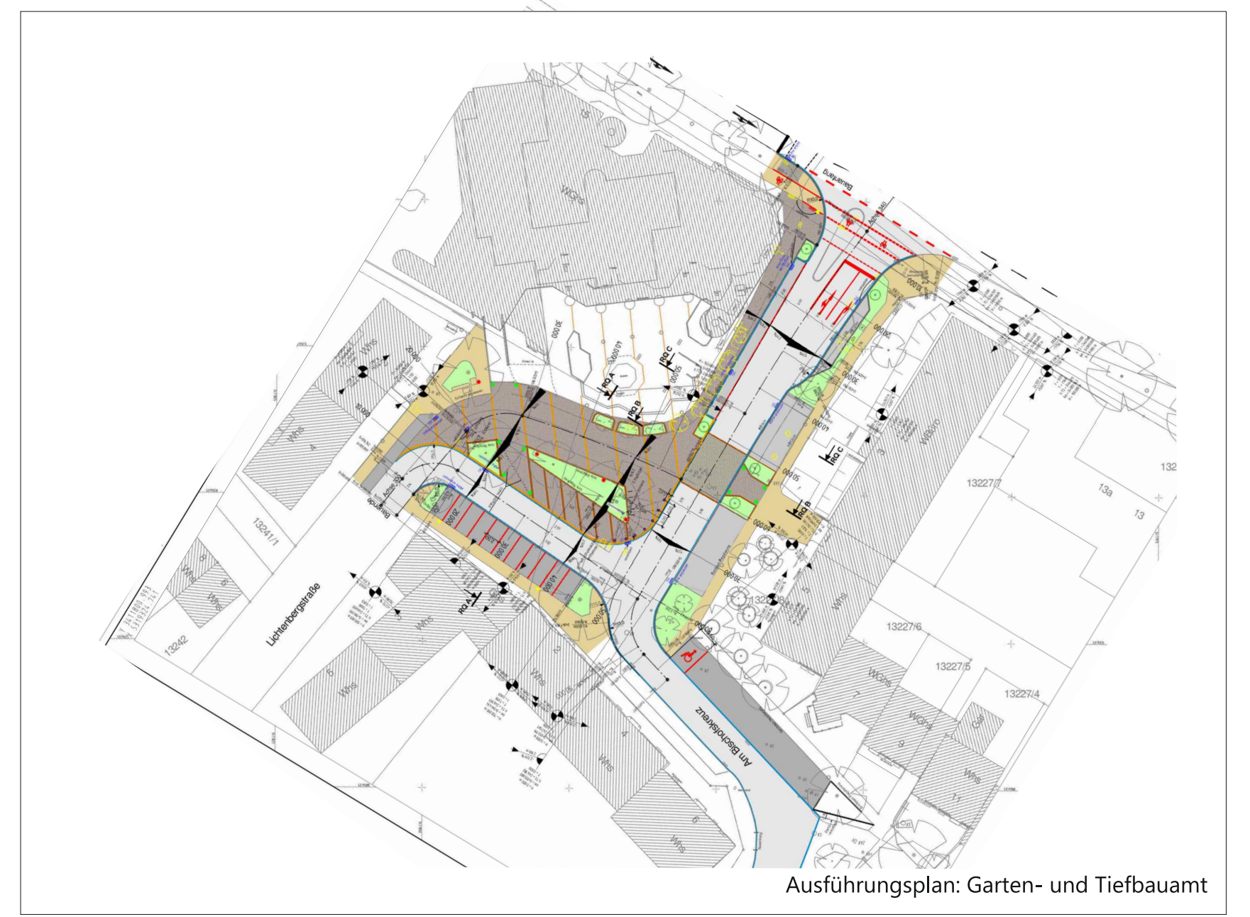
Ausführungsplan: Garten- und Tiefbauamt