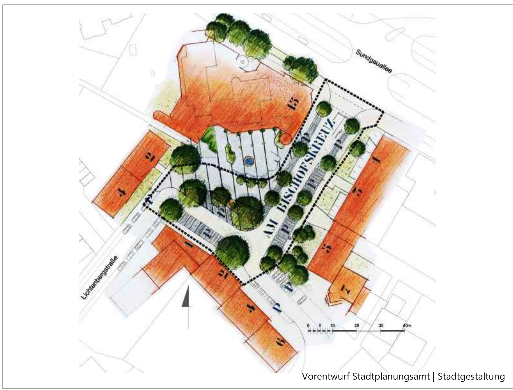
Vorentwurf Stadtplanungsamt | Stadtgestaltung