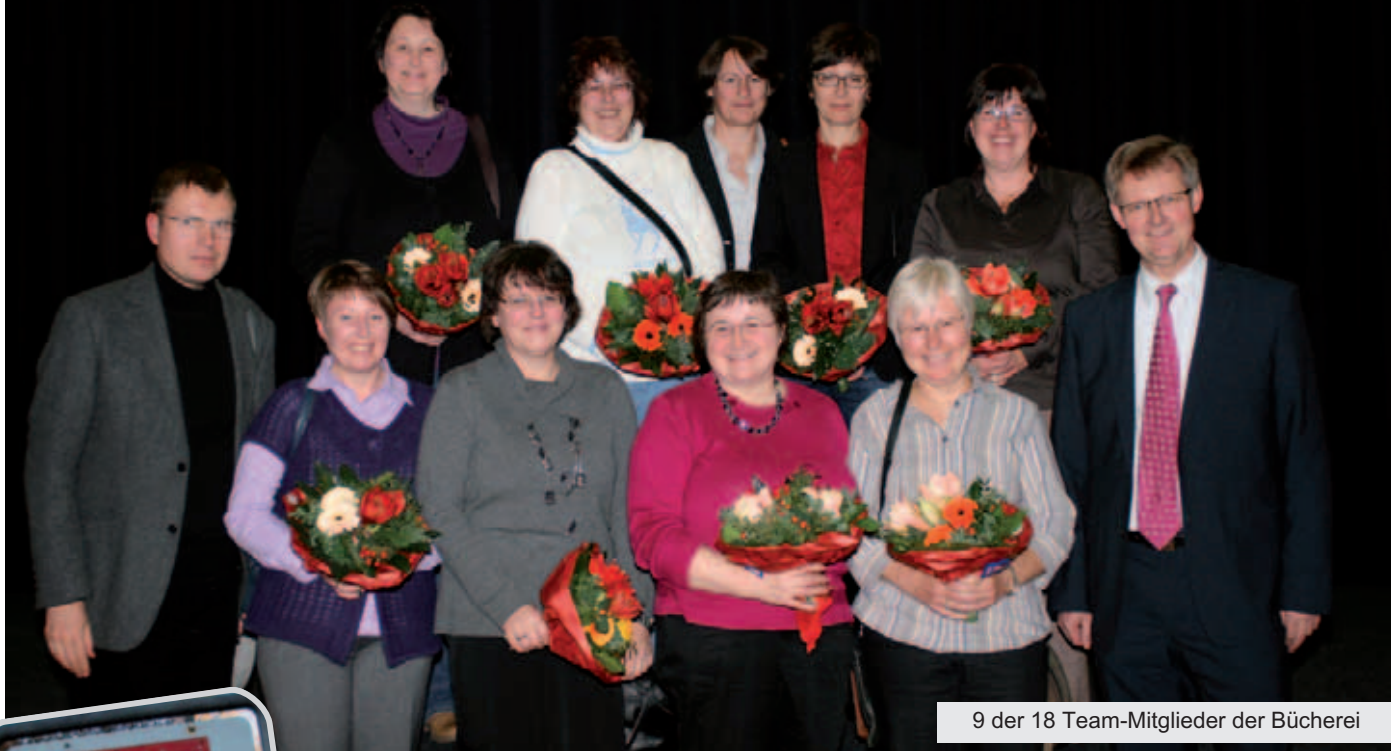
9 der 18 Team-Mitglieder der Bücherei