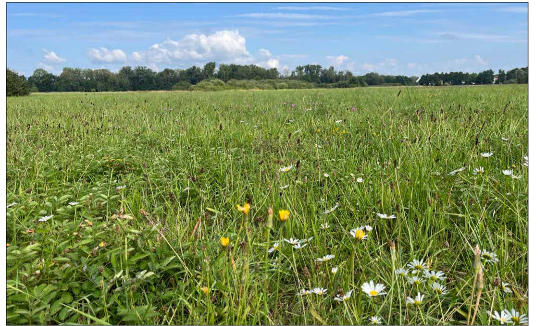
Fehlendes Puzzleteil: Der Biotopverbund Freiburg-Mitte soll die Biotopverbundpläne im Osten und Westen der Stadt verbinden.

Der Biotopverbund schafft ein vernetztes System aus Lebensräumen. Er ermöglicht Tieren und Pflanzen, zu wandern und genetischen Austausch zwischen Populationen herzustellen. Ein funktionsfähiger Verbund fördert die Wiederbesiedlung von Lebensräumen nach lokalem Aussterben und stärkt die Anpassungsfähigkeit an den Klimawandel. Zwei neu Biotopverbundpläne gibt es bereits, im Osten der Stadt (Schwarzwald) sowie im Westen (Tuniberg). Jetzt soll durch die Planung des letzten Teilgebiets Freiburg-Mitte der Biotopverbund flächenhaft für Freiburg hergestellt werden.