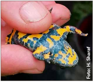
Die Gelbbauchunke ist die Titelheldin der neuen Folge unserer Serie „Tierisch was los“. Was man über sie wissen sollte, steht auf Seite 8.

Aufschlussreich: Alle OB-Kandidierenden im Kurzporträt Faktenreich: Bericht zur wirtschaftlichen Entwicklung Tierreich: Nacht der Umwelt mit spannenden Exkursionen Lehrreich: Kolumbiens Wälder zu Gast im Waldhaus