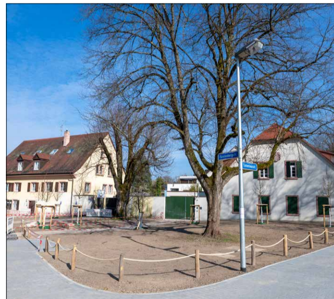
Natur in den Startlöchern: Schon bald soll es an der Ecke Fürstenberg-/Türkenlouisstraße grünen und blühen.

Gemeinsam mit den beiden bestehenden Linden wird der Platz dadurch zum schattigen Treffpunkt für die Nachbarschaft. Damit der Rasen ungestört wachsen kann, ist das Areal mit einem Seil geschützt. Zum Verweilen laden zusätzliche Sitzgelegenheiten ein. Außerdem hat die Verwaltung die Wege neu angelegt