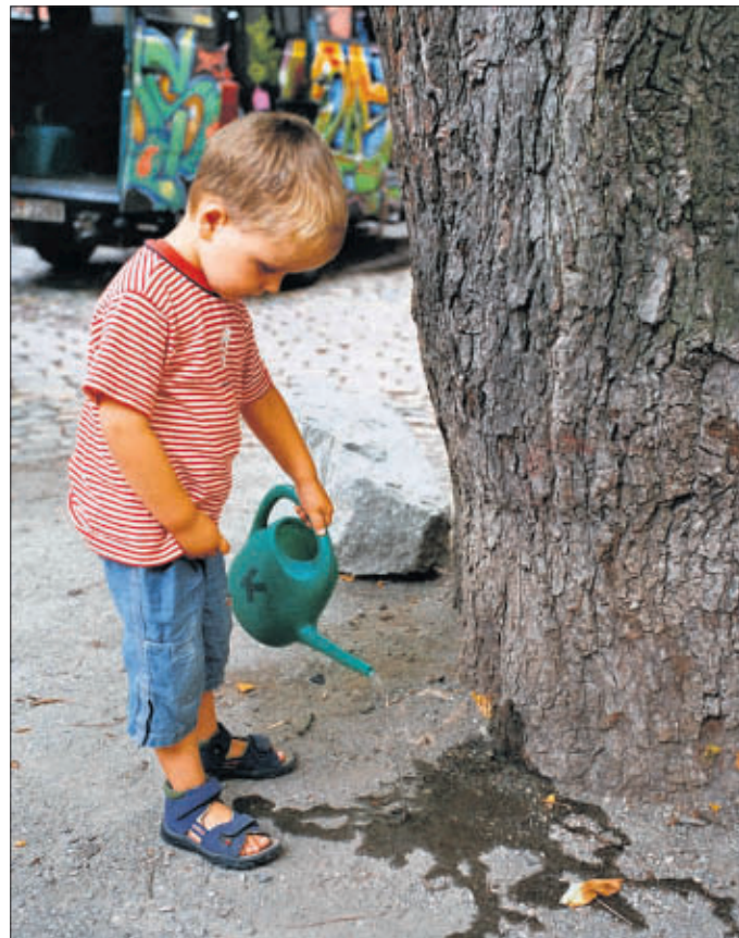
Erst kam die Trockenheit, und die Stadt rief dazu auf, Bäume zu gießen, doch der große Regen beendete im August die Dürreperiode