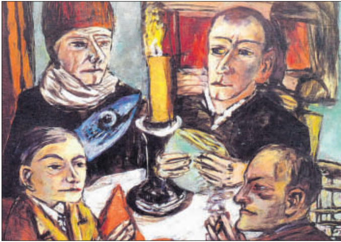
Max Beckmann mit „Les Artistes mit Gemüse“ in der Ausstellung Exil und Moderne