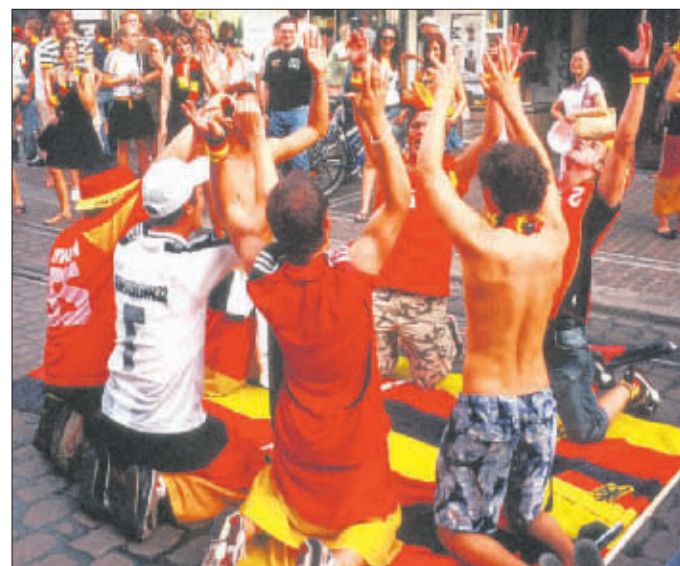
Stadtbahnanschluss für 5000 Einwohner im Vauban (links) Freude über den 3. Platz: Fußballfans in der KaJo (oben) So viel Schnee wie selten zuvor brachte der März (rechts)

Das AMTSBLATT dokumentiert auf diesen beiden Seiten die wichtigsten stadtpolitischen Daten des endenden Jahres. Auch wenn sich das Thema Finanzen wie ein roter Faden durch die letzten zwölf Monate zog: Vieles ging voran, wurde auf den Weg oder erfolgreich zu Ende gebracht.