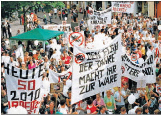
Initiativen protestieren gegen den Stadtbauverkauf