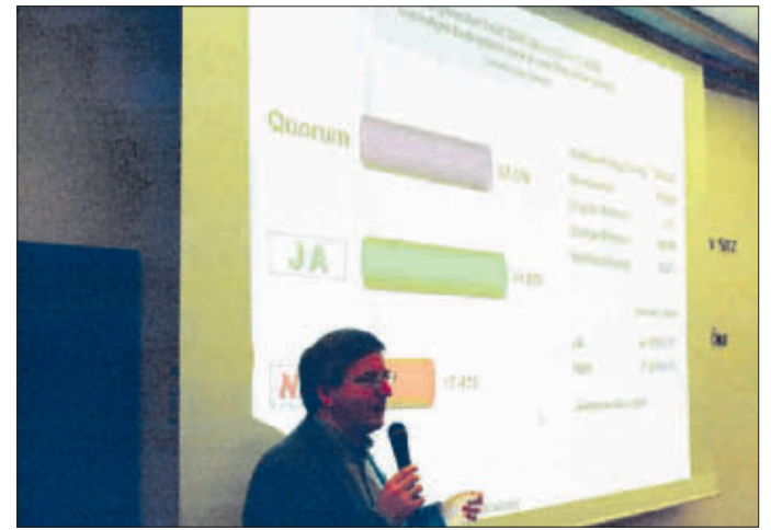
Eindeutiger Bürgerentscheid: Kein Verkauf der Stadtbau