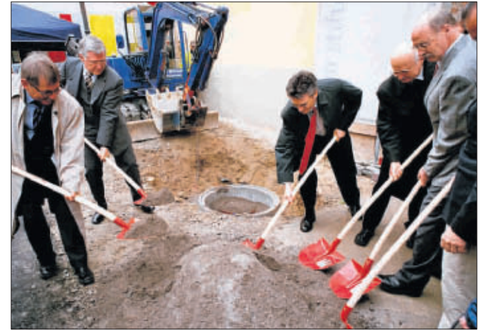
Gemeinsame Anstrengung: Sanierungsbeginn beim Augustinermuseum