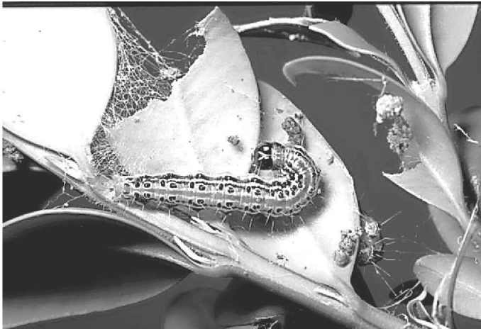
Raupe des Buchsbaumzünslers