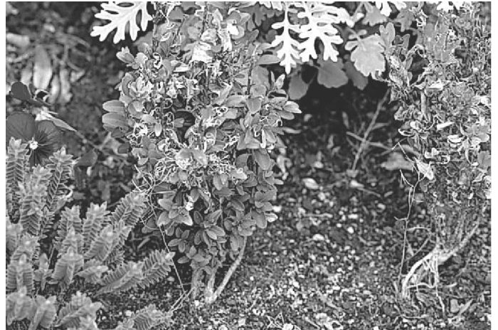
Schaden an der Pflanze

Quelle: Pressemitteilung des Landwirtschaftlichen Technologiezentrums Augustenberg; Fotos: LTZ/Albert / Schrameyer