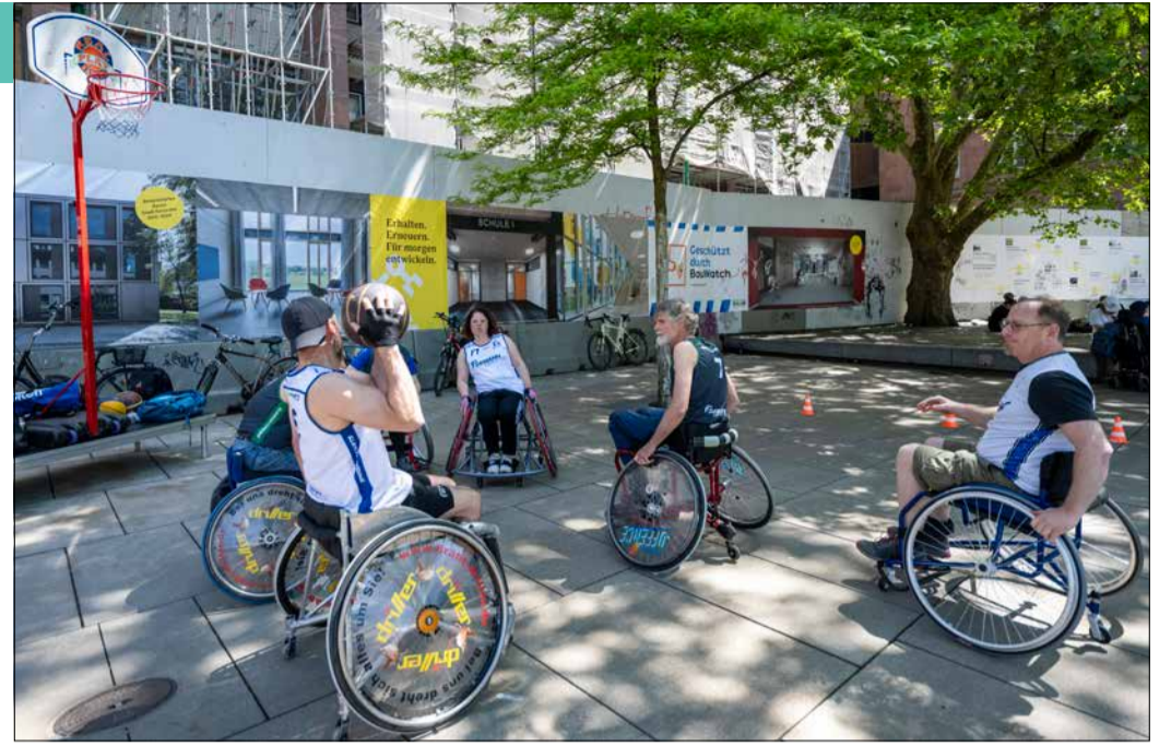
Alle können mitmachen – ob beim Rollstuhlbasketball, beim Gärtnern oder beim Tanz in den Mai.