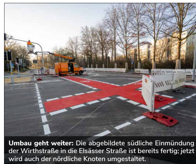
Umbau geht weiter: Die abgebildete südliche Einmündung der Wirthstraße in die Elsässer Straße ist bereits fertig; jetzt wird auch der nördliche Knoten umgestaltet.

Die Arbeiten sind in vier Bauabschnitten gegliedert und bringen folgende Einschränkungen mit sich: In Bauabschnitt 1 und 2 ist von Montag, 27. April, bis voraussichtlich Anfang Juli eine Einfahrt in die Wirthstraße im Kreuzungsbereich Nord nicht möglich. Der Verkehr wird über die El-