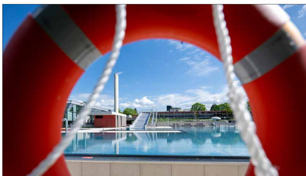
Rettung naht: Die Freibadesaison steht in den Startlöchern – hier im neuen Freibad West.

Am 14. Mai folgen dann das Lorettoabad und das Freibad St. Georgen. In allen Bädern wird es wieder viele Kurse geben. Die Termine und Anmeldemöglichkeiten werden auf der Homepage bekannt gegeben. Sämtliche Eintrittspreise in die Bäder bleiben in diesem Jahr unverändert.