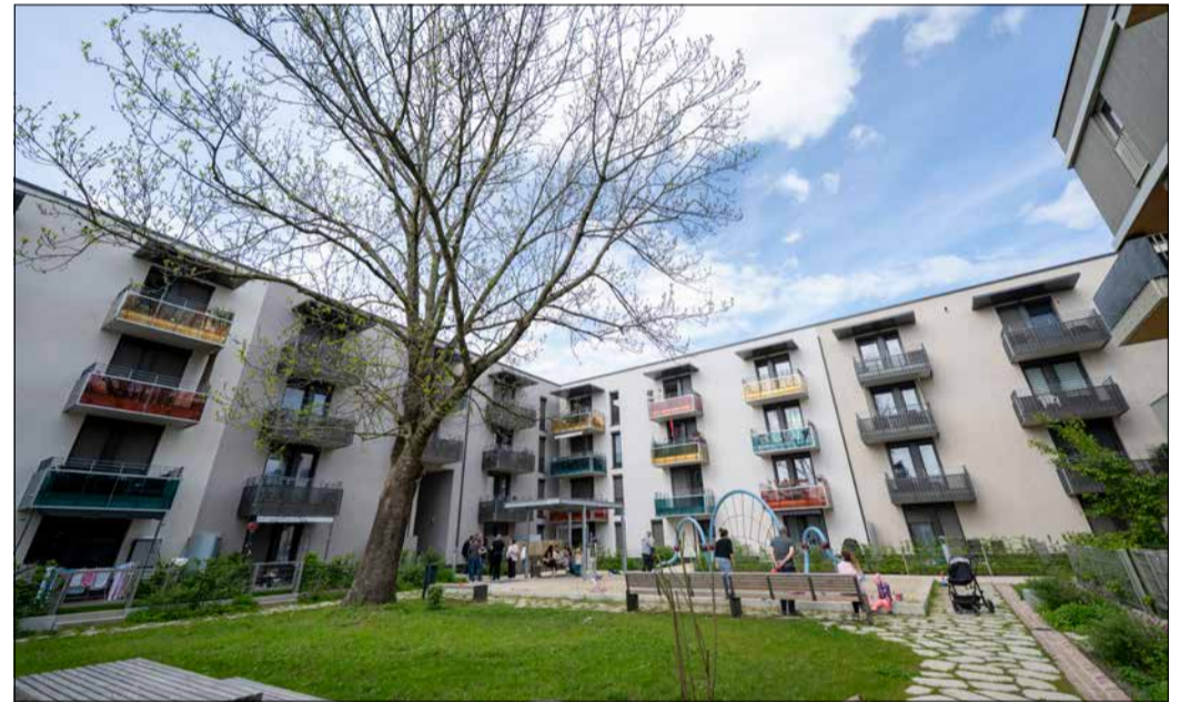
Begegnung leicht gemacht: Freiflächen zwischen den Häusern – wie hier im ersten Bauabschnitt – sollen ein gutes nachbarschaftliches Miteinander ermöglichen.