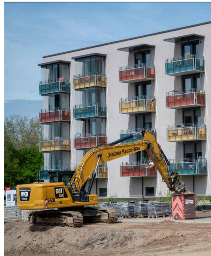
Die Bagger rücken an: Nach dem Spatenstich beginnen jetzt die Arbeiten am zweiten Bauabschnitt.

die Freiräume und Begegnungsflächen zwischen den Häusern. „Das schafft hohe Aufenthaltsqualitäten und unterstützt das nachbarschaftliche Miteinander.“