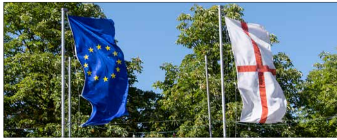
Die europäische Einigung steht auch in Freiburg im Fokus.

Rund um Europa geht es am Samstag, 9. Mai, von 10 bis 15 Uhr auf dem Kartoffelmarkt in der Innenstadt. Beim Europatag stellen sich zahlreiche Organisationen und Initiativen mit Europabezug an Infoständen vor, geben Einblicke in ihre Arbeit und tauschen sich mit Besucher*innen über interaktive Formate aus.