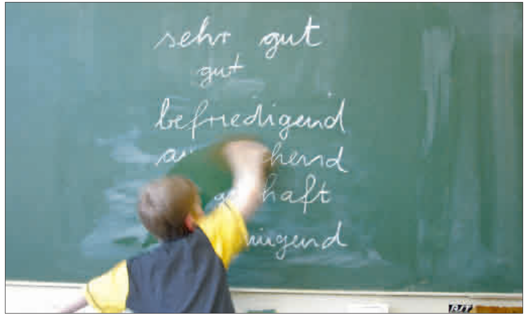
Die Bildung in Freiburg bekommt von Schülern und Eltern gute Noten, das ist eines der vielen Ergebnisse des zweiten Freiburger Bildungsberichts. Ein weiteres: Fast nirgendwo gibt es so viele Abiturienten wie hier.

Der Bildungsbericht kann unter www.freiburg.de/bildungsbericht heruntergeladen werden.