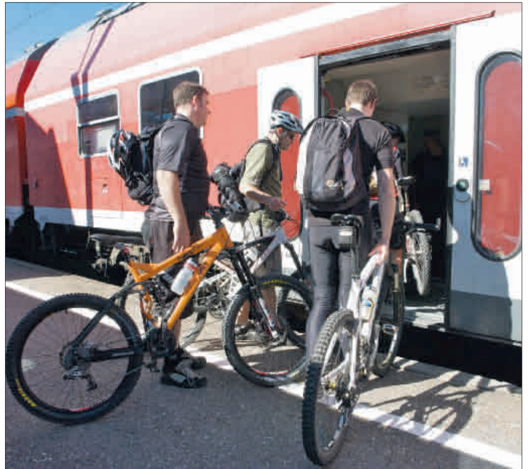
Fahrradmitnahme: Was auf der Höllentalbahn längst Standard ist, wünschen sich viele Radler auch in den öffentlichen Verkehrsmitteln der Stadt.

Die meisten Ergebnisse für die Stadt Freiburg überraschen nicht: Der Radverkehrsanteil liegt hier mit 27 Prozent an der Spitze der beteiligten Kommunen. Freiburg hat aber landesweit auch die höchste Quote an Verkehrsverletzten. Dies ist auch auf den hohen Radverkehrsanteil zurückzuführen, da Radfahrer zwar nicht überdurchschnittlich oft an Unfällen beteiligt sind, dabei aber eher verletzt werden. Der Bericht erkennt an, dass die Stadt seit geraumer Zeit bemüht ist, die Verkehrssicherheit durch Verbesserung der Infrastruktur und durch verstärkte Öffentlichkeitsarbeit zu erhöhen. Positiv erwähnt wird zum Beispiel die Installation der Trixi-Spiegel. Für das Radverkehrs-