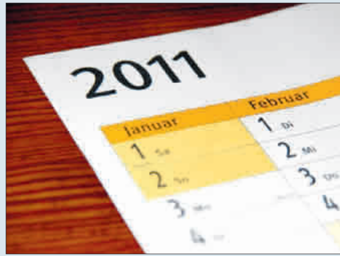
Schon jetzt vormerken: Was läuft 2011 in Freiburg?