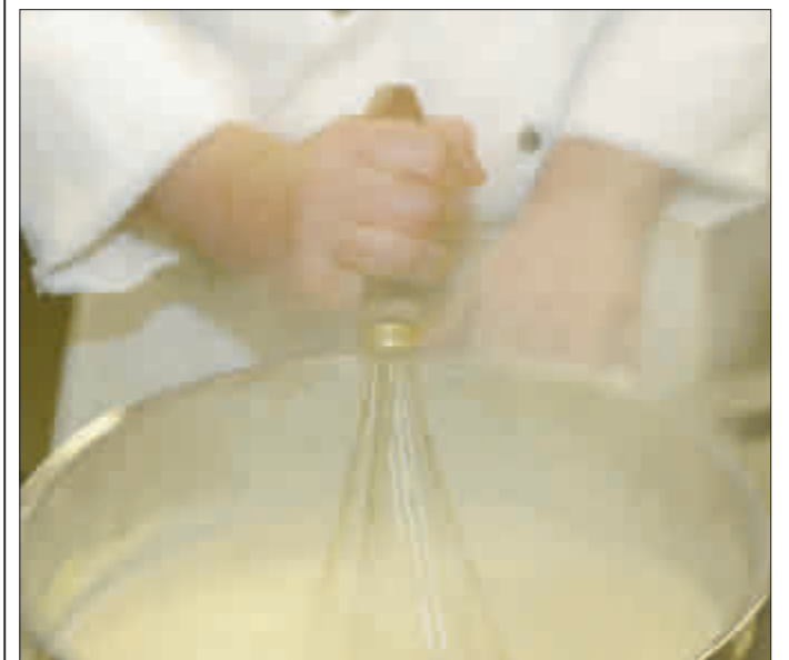
Bestens ausgestattet ist jetzt auch die fünfte von sechs Küchen in der Edith-Stein-Schule.

In der Edith-Stein-Schule werden 1522 Schülerinnen und Schüler in 69 Klassen unterrichtet. 1018 von ihnen kommen aus den umliegenden Landkreisen. Neben der Berufsschule mit 742 Schülern in 30 Klassen befinden sich unter dem Dach der Schule 17 weitere Schularten.