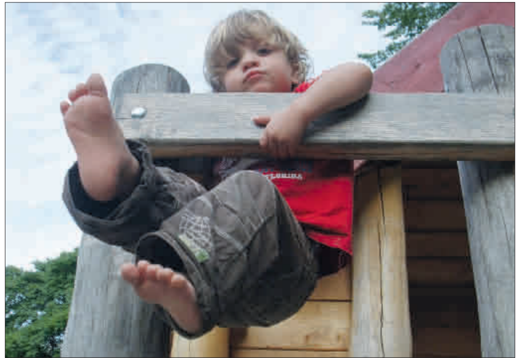
Glück gehabt – der Balken hält. Kein Wunder, die Stadtverwaltung überprüft die Spielgeräte der städtischen Kitas laufend.

120 000 Euro für neue Spielgeräte und verbesserte Spielflächen in Kitas und Horten