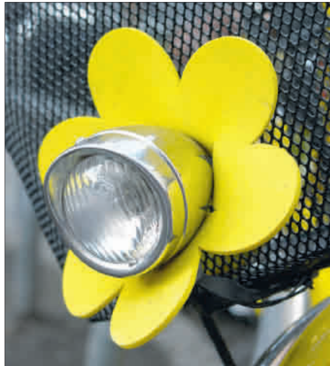
Moderne LED-Lampen bringen Licht in dunkle Wintertage. Dieses Exemplar bringt dagegen eher finstere Wintergesichter zum Strahlen. Auch nicht schlecht...

Mit der richtigen Ausstattung lässt sich's auch im Winter sicher radeln