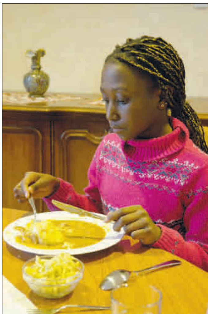
Ein leerer Bauch studiert nicht gern – und was auf Studenten zutrifft, gilt erst recht für Kinder. Dank der Initiative des Katharinenstifts und der Unterstützung der Dussmann Service GmbH erhalten Schüler der Karlsschule zweimal pro Woche ein kostenloses warmes Mittagessen.