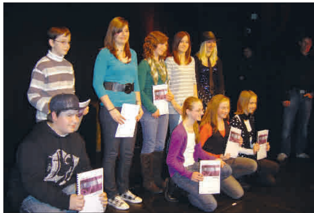
Erst schreiben, dann strahlen: Die Preisträger der Jugendliteraturtage 2009

Genau in diesem Sinne bildet dann auch die Preisverleihung des Schreibwettbewerbs für Mädchen und Jungen den Auftakt der Jugendliteraturtage. Sie findet am Sonntag, den 28. November, im Vorderhaus statt. 12- bis 16-Jährige waren aufgerufen, Reisege-schichten einzuschicken: „... ob mit Reisefieber, Reisepass oder Reisegruppe, ob als Einreise oder Ausreise, ob legal oder illegal, ob mit oder ohne Ziel, ob in dieser oder in einer anderen Welt – ein Reiseverbot gibt es bei unserem Schreibwettbewerb ebenso wenig wie eine festgelegte Reiseroute“, heißt es vielversprechend in der Ausschreibung.