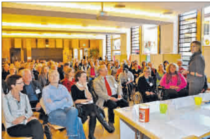
Großes Interesse am pädagogischen Konzept der Modellschule.

Nähere Informationen unter www.fr-eineschule.de . Nächstes Treffen: am Mittwoch, 8. Dezember, 19 Uhr, Café Velo, Hauptbahnhof