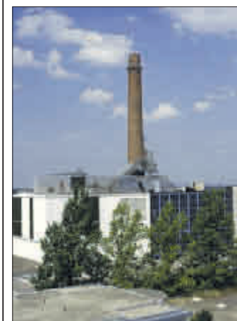
Soll sauberer werden: das Heizkraftwerk der Uni.

Trotz jahrelanger Verhandlungen über dieses Thema sind Stadt und Universität zuversichtlich, dass es zu einer Kooperation kommt. Eine solche Lösung ist umso wichtiger, als sich die Stadt verpflichtet hat, ihre CO 2 -Emissionen bis zum Jahr 2030 um 40 Prozent zu reduzieren. Der Ausstieg aus der Kohleverfeuerung im Uniheizkraftwerk, so Umweltbürgermeisterin Gerda Stuchlik, wäre ein entscheidender Schritt in diese Richtung. ☛