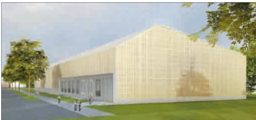
Die Visualisierung zeigt, wie das Kunstdepot einmal aussehen soll. (Visualisierung: Pfeifer Kuhn Architekten, GD90-Markus Dold)

In der Hochdorfer Weißerlenstraße entsteht die neue „Schatzkammer“ der Freiburger Museen