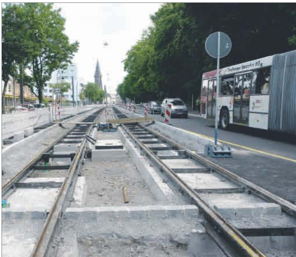
Der gute Service beschert der VAG einen stetig wachsenden Zuspruch bei den Fahrgästen. Damit der öffentliche Nahverkehr weiter reibunglos läuft, saniert die VAG zur Zeit die Gleise in der Habsburgerstraße. Ab Mitte November rollen hier wieder die Stadtbahnen

Betrachtet man die Investitionen der VAG, sticht besonders die Gleiserneuerung in der Habsburgerstraße hervor: Für 3,5 Millionen Euro verlegt die VAG zur Zeit auf einer Strecke von 1,5 Kilometern neue, gummiummantelte Gleise und errichtet drei behindertengerechte Haltestellen („Tennenbacher Straße“, „Hauptstraße“ und „Okenstraße“). Mitte November soll die sanierte Strecke sowie die komplett umgestaltete Habsburgerstraße mit einem großen Straßenfest dem Verkehr übergeben werden. ▣