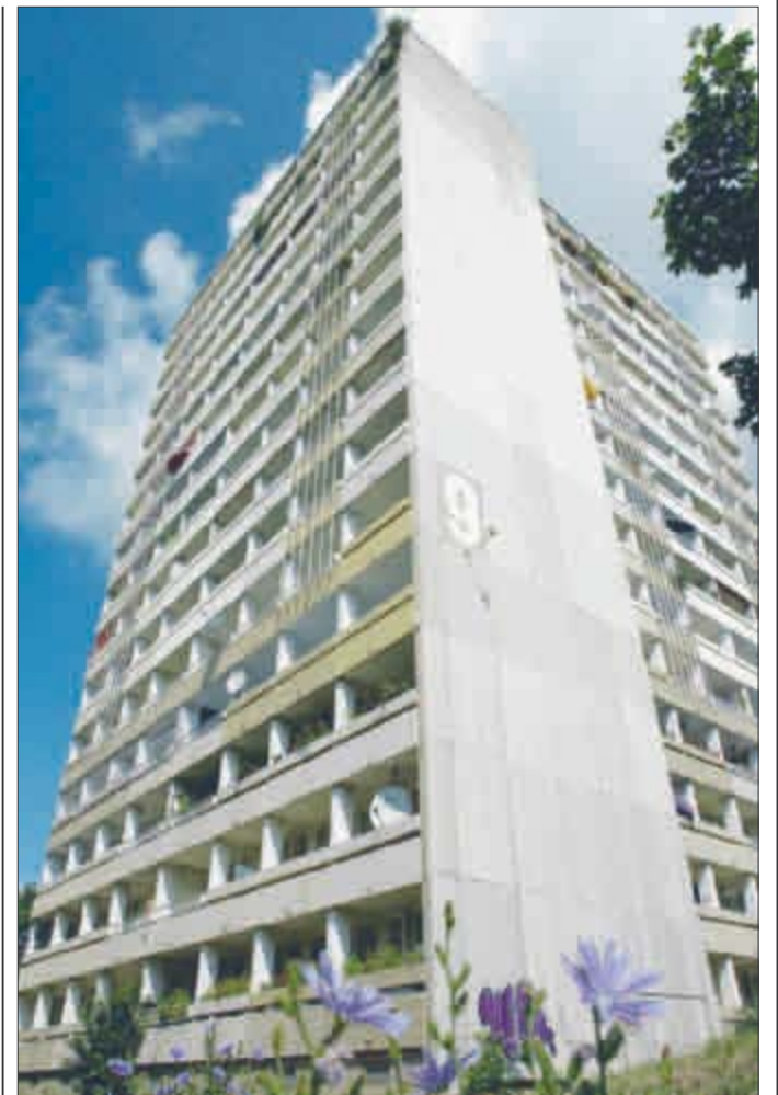
Sanierung in Gefahr: Ohne die Förderung des Bundes ist die Sanierung im Binzengrün 9 nicht wie geplant finanzierbar.