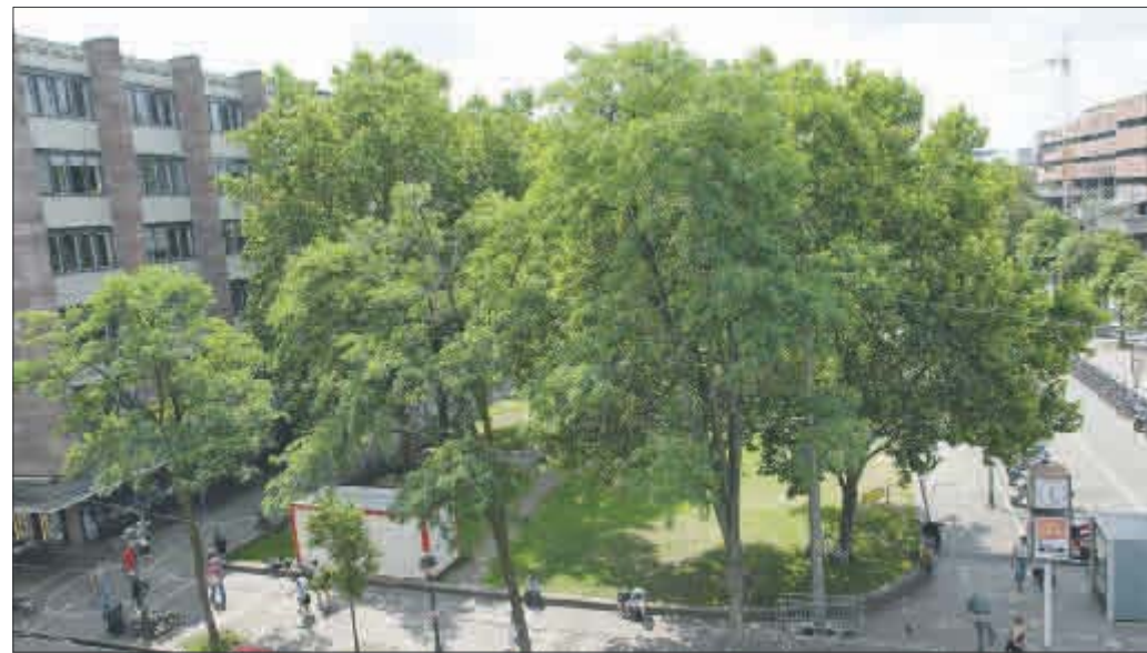
Die Bäume an der Bertoldstraße werden voraussichtlich nicht einem „Platzhaus“ weichen müssen. Die Schattenspende erschien dem Gemeinderat zu wichtig.

OB Salomon umriss eingangs der Debatte noch einmal die Bedeutung des Vorhabens, das große Teil des Innenstadtrands komplett verändern wird. Neben dem Bau der Stadtbahnlinie und dem Rückbau der Fahrbahnen sollen insgesamt fünf neue Plätze entstehen oder umgestaltet werden. Daraus erwächst ein fast zwei Kilometer langer verkehrsreduzierter und teilweise verkehrsfreier Bereich mit einem großem Potenzial für die Stadtentwicklung. Neben den Kosten für die Stadtbahn, die weitgehend öffentlich gefördert wird, kommen auf die Stadt Belastungen in Höhe von 11,4 Millionen Euro im Zeitraum 2014 bis 2017 zu, davon 4,4 Millionen für den Platz der Alten Synagoge. Welche Beiträge in welchem Haushaltsjahr genau bereitgestellt werden müssen, wird die Verwaltung