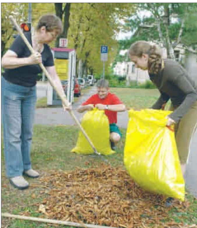
Mittäter und Mittäterinnen gesucht: Auch in diesem Herbst soll wieder mit bürgerschaftlicher Hilfe Kastanienlaub eingesammelt werden.

Laubsammelaktion erfolgreich: Schädling ist auf dem Rückzug