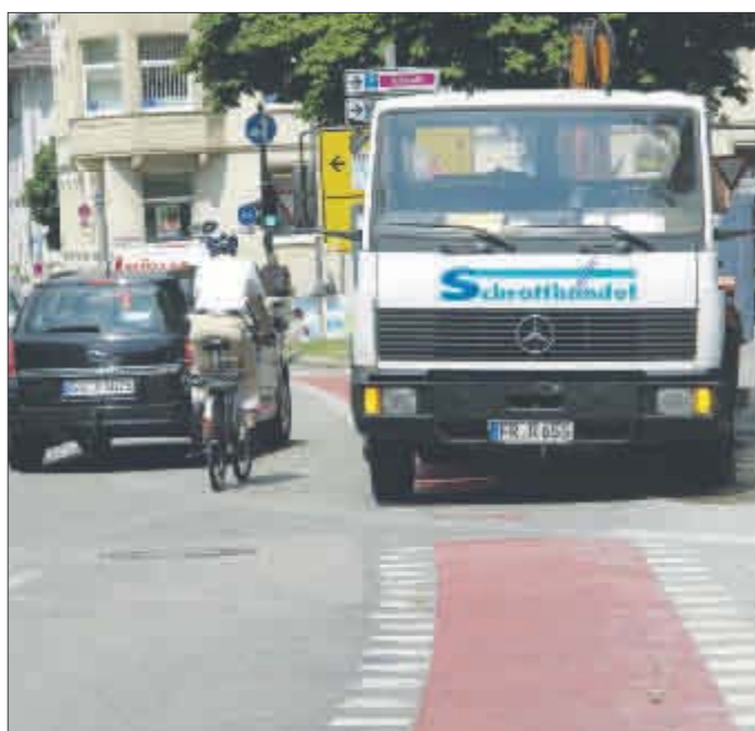
Leider Alltag in Freiburg: Rücksichtslos werden Radstreifen zugesperrt – in diesem Fall sogar entgegen der Fahrtrichtung.

Zu hohe Geschwindigkeit ist einer der größten Risikofaktoren. Unabhängig von der zulässigen Geschwindigkeit gilt daher immer die Grundregel: Geschwindigkeit anpassen und auf Sicht fahren – da man eigentlich immer mit Radlern rechnen muss. In Einbahn-