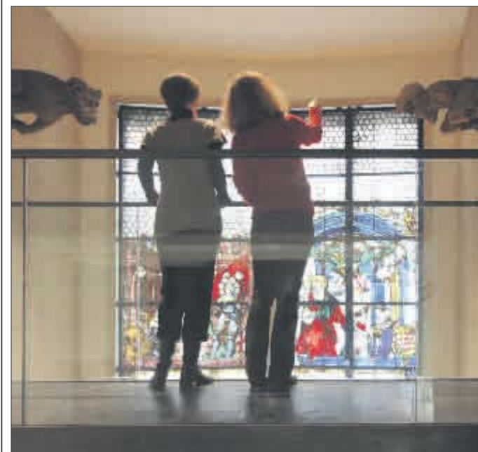
Seit der Eröffnung im März kamen knapp 40.000 Besucher ins Neue Augustinermuseum.

Verläuft alles planmäßig, kann das Museum im Frühjahr 2014 die Einrichtung des Neubaus abschließen – doch ein Ende des Riesenprojekts ist auch dann nicht in Sicht. Als dritter und damit letzter Bauabschnitt steht 2014 die vollständige Sanierung des Klostergebäudes an. Die Großbaustelle endet erst 2017, dafür ist die lange erwartete Eröffnung des Museumscafés im Kreuzgang bereits in den nächsten Wochen geplant – pünktlich zu den Freiburger Museumsnächten. ☛