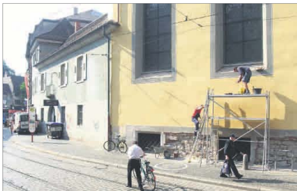
Augustinermuseum in der Salzstraße: Das Museum ist offen, doch der Umbau geht weiter. Bald beginnen die Arbeiten am zweiten Bauabschnitt.

Die Mehrkosten von 1,3 Millionen Euro haben mehrere Gründe: Die Bausubstanz der ehemaligen Augustinerkirche