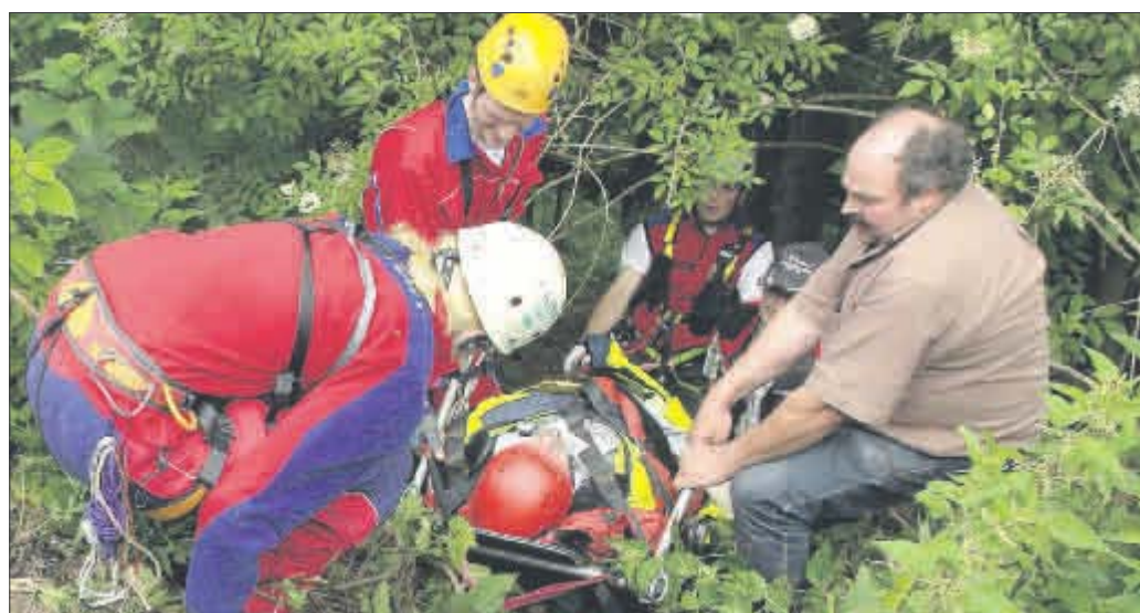
Punktgenaue Rettung im Stadtwald: Am 22. Juni probten Rettungskräfte die Bergung Verletzter. Dank der neuen Rettungspunkte waren die Helfer schneller vor Ort.

Rettungspunkte im Stadtwald erleichtern Suche nach Verunglückten