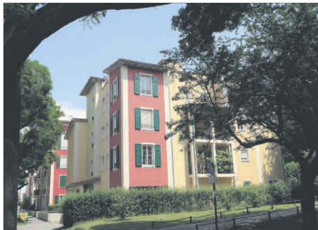
Gelungenes Beispiel für Innenentwicklung: Auf dem ehemaligen Bahngelände östlich des Wiehrebahnwegs ist ein Wohngebiet mit 185 Wohnungen entstanden.

„Unsere Philosophie der Innen- vor Außenentwicklung trägt jetzt Früchte“, bilanzierte Oberbürgermeister Dieter Salomon am Montag voriger Woche. Auch sämtliche Fraktionen des Gemeinderats lobten das Konzept in der letzten Ratssitzung als einen guten ersten Schritt. Immerhin: Allein auf der bereits aktivierten Fläche werden voraussichtlich bis Ende 2014 rund 1900 neue Wohnungen entstanden sein. Ganz so glatt dürfte es künftig allerdings nicht laufen, schließlich fallen in die erste Bilanz auch große Flächen wie das Wohngebiet östlich Wiehrebahn mit 185 Wohneinheiten, der ehemalige VAG-Betriebshof Nord (180 Wohneinheiten) oder das ehemalige Autohaus Breisgau an der Zähringerstraße (200 Wohneinheiten).