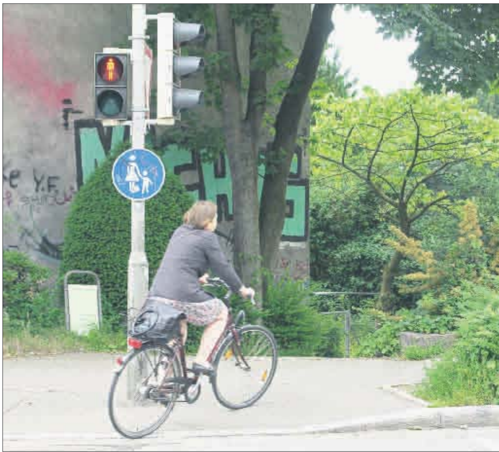
Gehört nicht zur Hauptrisikogruppe (unter 35, männlich, Student), lebt aber trotzdem gefährlich: Geisterradlerin fährt in falscher Richtung bei Rot auf den Fußweg.

wie eine andere Studie herausfand – ein bis zu zehnfach höheres Unfallrisiko. Mehr als drei Viertel der Radler fahren auf dem Gehweg, über zwei Drittel missachten rote Ampeln. Eine nicht unerhebliche Minderheit der befragten Radler hat Spaß an riskantem Fahren (17 Prozent) und befolgt