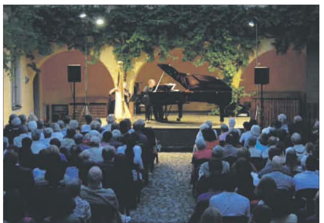
Der Freiburger Münstersommer 2010 ist da!

Die Stadtfinanzen werden den Gemeinderat noch einmal vor der Sommerpause beschäftigen: In der nächsten Sitzung wird der Nachtragset für 2010 verabschiedet.