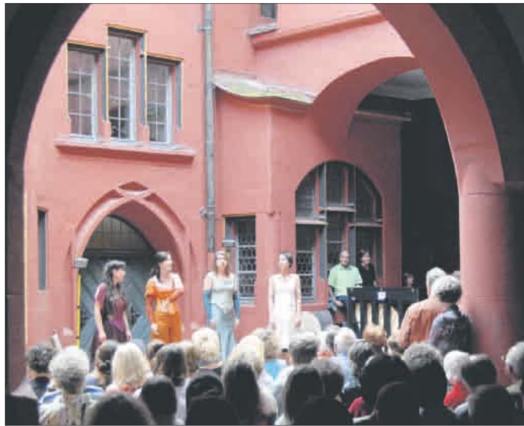
Konzerte, Lesungen oder Filme unter freiem Himmel und in lauschigen Innenhöfen: All das bietet der Münstersommer noch bis Ende September.

Regionale und überregionale Musiker und Ensembles nehmen insgesamt sieben Freiburger Innenhöfe ein. Das Motto: Klassik, Weltmusik und Jazz in kleiner Besetzung, entspannter Atmosphäre und ohne große Technik. Neben Vertretern der Freiburger Musikszene sorgen auch viele internationale Musiker für eine spannende musika-