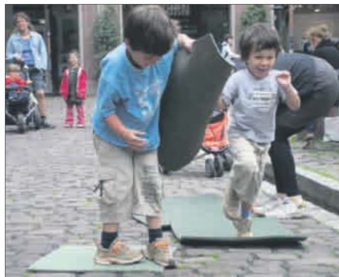
Bei Kindern darf's ruhig mal laut zugehen.

A m 28. Mai findet in ganz Deutschland der 3. Weltspieltag statt. In Freiburg sind diesmal Aktionen in vier Stadtteilen geplant, mit denen in der Öffentlichkeit mehr Toleranz für die Bedürfnisse spielender Kinder erreicht werden soll. In Weingarten, Brühl-Beurbarung, Haslach und der Unterwiehre wird es zahlreiche kreative Spielangebote für Kinder geben.