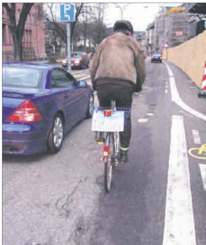
Radfahren in Freiburg: beliebt, gefördert, aber nicht immer sicher. Die Stadt will das ändern.

In einer zweiten Untersuchung, den „Handlungsempfehlungen“, hat das Gutachterbüro für eine Reihe von Streckenabschnitten und Knotenpunkten mit Unfallauffälligkeiten konkrete Verbesserungsvorschläge gemacht. Am Friedrich-Ebert-Platz und in der Hindenburgstraße hat das Garten- und Tiefbauamt bereits erste Taten folgen lassen und den Verkehrsraum sicherer gestaltet. Und es geht noch weiter: Das städtische „Maßnahmenprogramm Radverkehr 2010“ mit einem Etat von knapp 470.000 Euro soll noch in diesem Sommer fortgeführt werden.