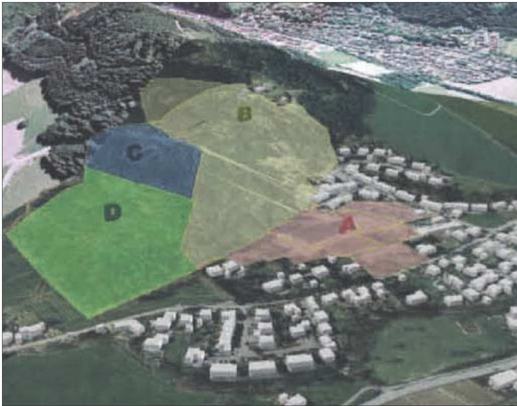
Statt auf der Kirchzartener Fläche D sollen die Altlasten (Fläche A) künftig auf der Fläche B deponiert werden. (Grafik: Umweltschutzamt)