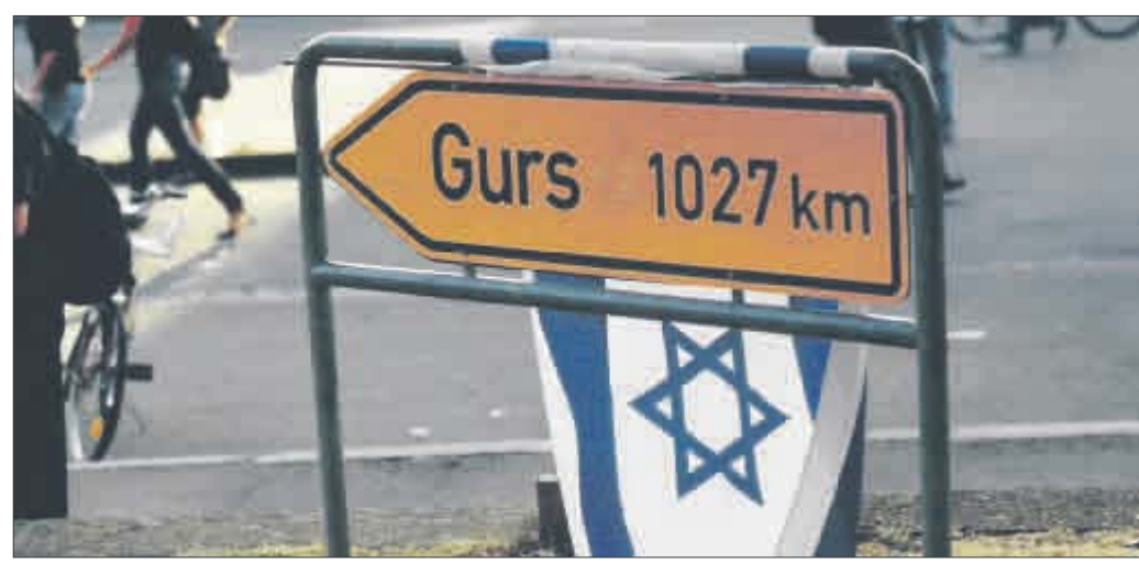
Bildungsreise nach Gurs