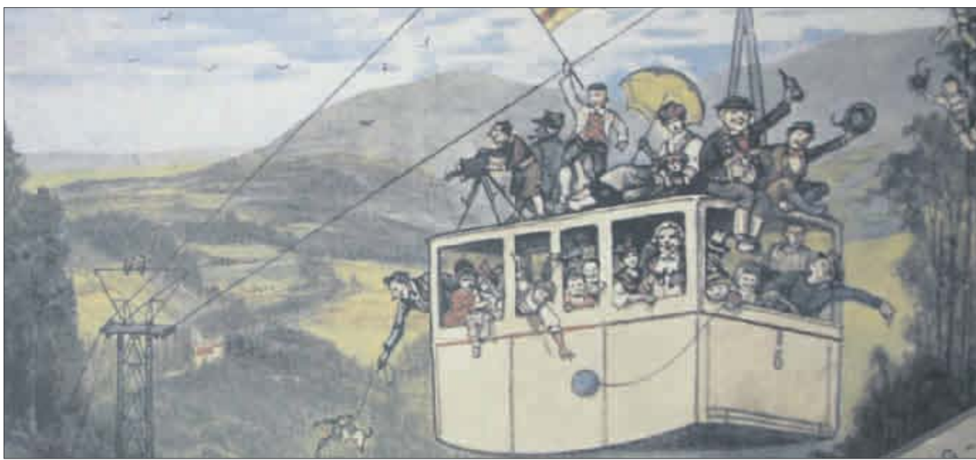
Die Schauinslandbahn wurde am 17. Juli 1930 als erste Großkabinen-Umlaufseilbahn der Welt eröffnet und 1987/88 zu Deutschlands erster schaffnerlosen automatischen Seilbahn mit Platz für mehr als vier Personen pro Kabine umgebaut.