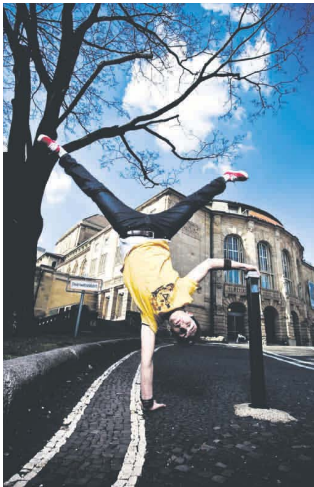
„Neue Suchbewegungen starten“: Auch in der Spielzeit zum 100-jährigen Jubiläum will das Theater Freiburg Zukunftsfragen stellen, wenn es ein muss, auch über Kopf.

Nach dem Spielzeitstart mit Uli Jäckles „Große Pause“ in den ehemaligen Staiger-Werken in St. Georgen geht Christoph Frick der Frage auf den Grund: Wie weit geht der Mensch für Geld? Dürrenmatts „Besuch der alten Dame“ sucht am Jubiläumswochenende An-