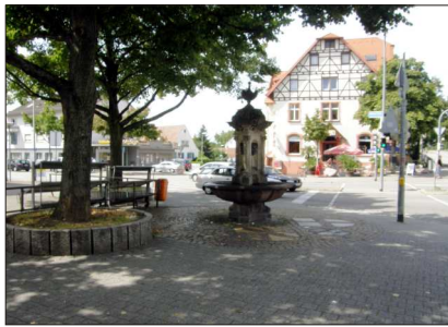
Haslach, Dorfbrunnen, 2009