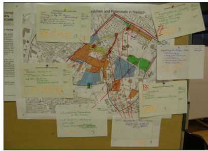
Einblick in die Arbeit der Bürgern