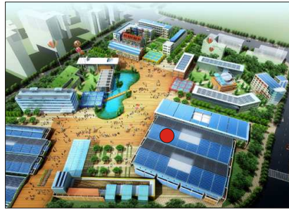
● Ausstellungsstandort für Freiburg