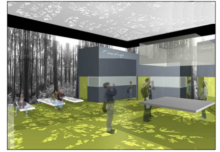
Entwurf des Freiburg Pavillons von Fuchs und Maucher