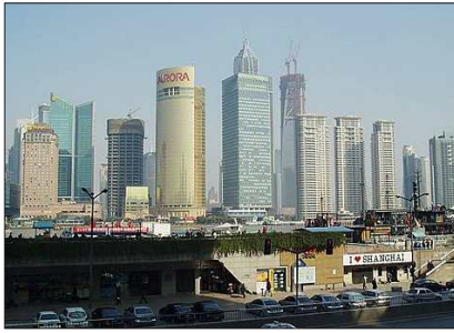
Shanghai - Austragungsort der EXPO 2010