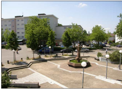
Der private Platz am Bischofskreuz, 2009