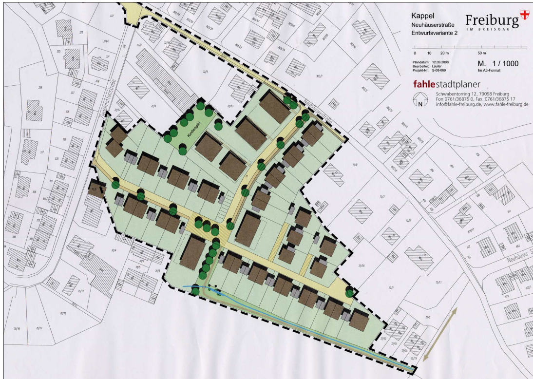
Neuhäuserstraße, Kappel, Variante 2, Fahle, Stadtplaner