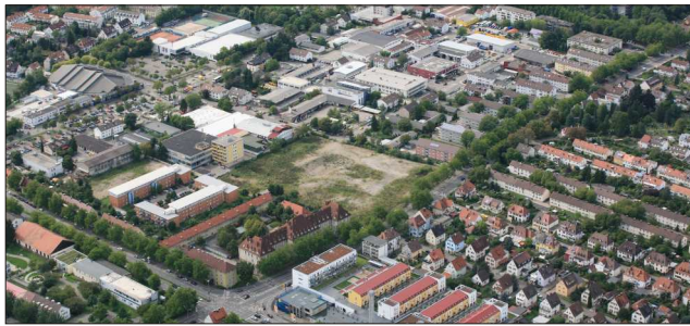
Luftbild des Hüttinger Geländes, 2009