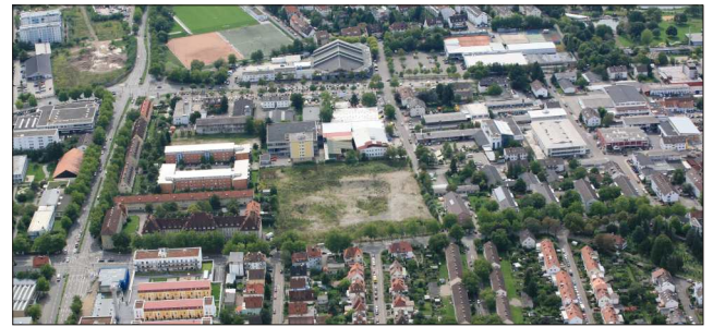
Luftbild des Hüttinger Geländes, 2009