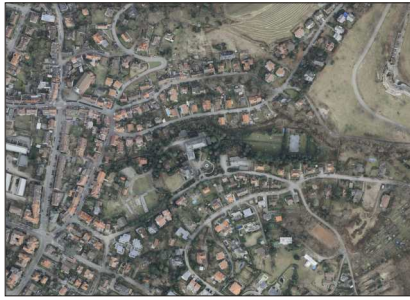
Luftbild, Vermessungsamt Freiburg, 2009