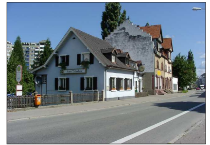
Alter Bebauungsbestand, 2009