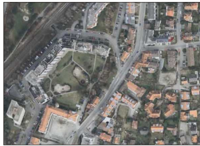
Luftbild ,Vermessungsamt Freiburg, 2009