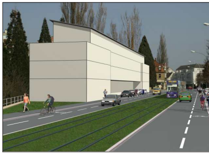
Simulation mit Neubau, 2008, Garten- und Tiefbauamt