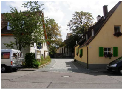
Saniertes Gebiet an der Melancthonkirche, 2008