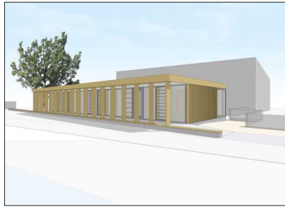
Nachbarschaftswerk, Technau, Hin Architekten