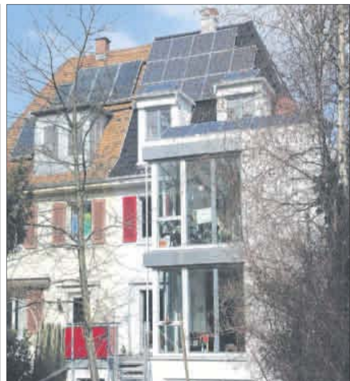
Auch Altbauten können energetisch auf dem neuesten Stand sein.

Das städtische Förderprogramm „Energiebewusst sanie-