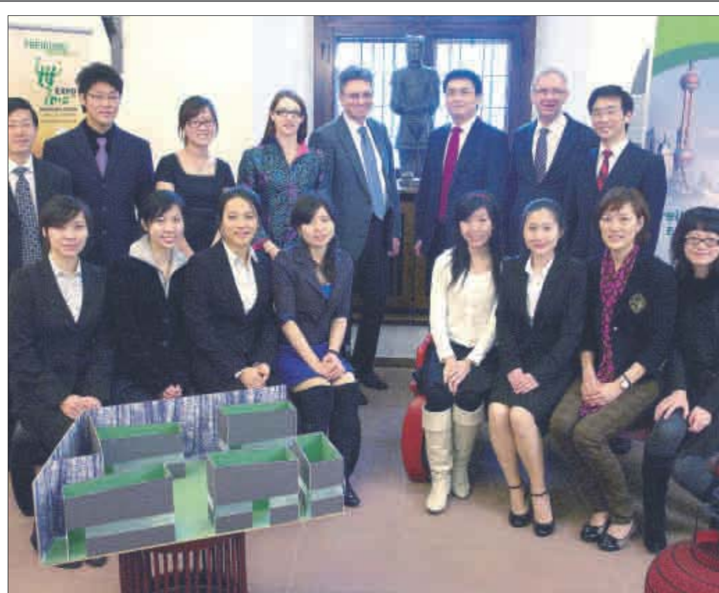
Chinesische EXPO-Mitarbeiter auf Green-City-Crash-Kurs

Soziale Netzwerke und Medien: Die Stadt Freiburg ist seit einiger Zeit in den sozialen Medien und Netzwerken aktiv. Bilder und Videos werden beispielsweise auf YouTube und Flickr eingestellt und von dort wieder dynamisch auf www.freiburg.de eingebunden. Aktuelle Meldungen werden über RSS und Twitter verbreitet. Einen Überblick über die Web-2.0-Dienste der Stadt gibt es unter: www.freiburg.de/socialmedia