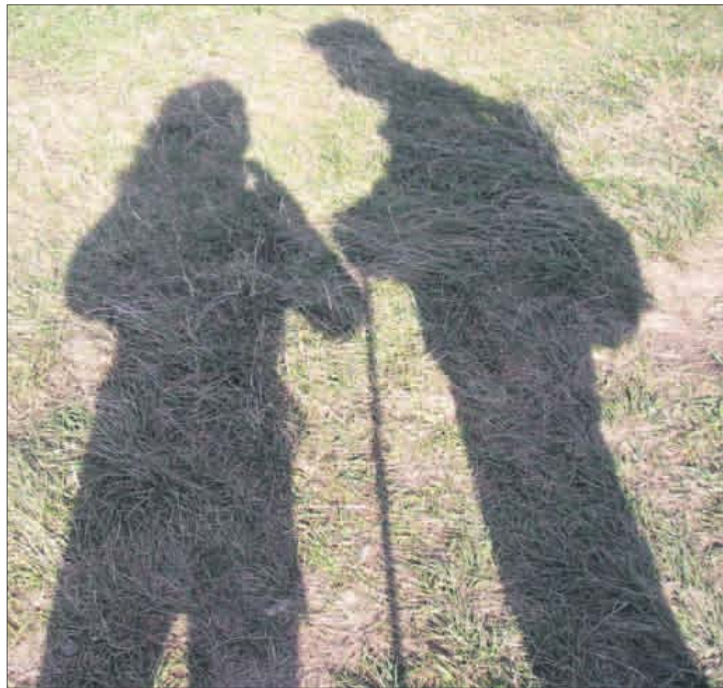
Der Deutsche Wandertag wirft seine Schatten voraus.

Die Stadt Freiburg und die Nachbargemeinden befürchten nun, dass die Bahnvertreter auch bei den Freiburger Planabschnitten am sturen Nein festhalten werden. „Bahn und Bund verspielen Vertrauen, Glaubwürdigkeit und Akzeptanz in der Bürgerschaft“, kritisiert OB Salomon die Blockadepolitik. Die Stadt sieht darin