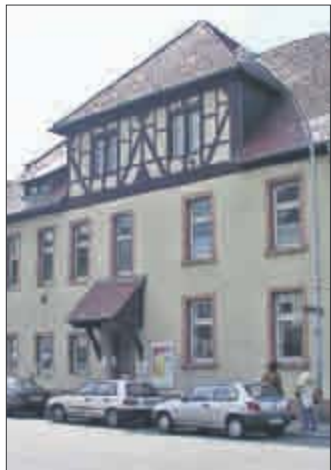
bleibt erhalten: Alte Schule in der Markgrafenstraße.

In dem 250 Jahre alten ehemaligen Schulgebäude in der Haslacher Markgrafenstraße soll ein sozialgebundenes Wohnprojekt entstehen. Nachdem der ursprüngliche Plan, das Haus zu sanieren und den Stadtteil- und Bürgertreff dort unterzubringen, an den Kosten gescheitert war, sollen dort nun Wohnungen für Senioren, Alleinerziehende und Behinderte sowie gewerbliche Räume entstehen. Die Stadt wird das denkmalgeschützte Gebäude und das Grundstück zum Verkauf ausschreiben. Wegen der sozialgebundenen Ausrichtung wird sich die Stadt bei der Vergabe nicht allein am Verkaufserlös, sondern auch an sozialen und energetischen Aspekten orientieren.