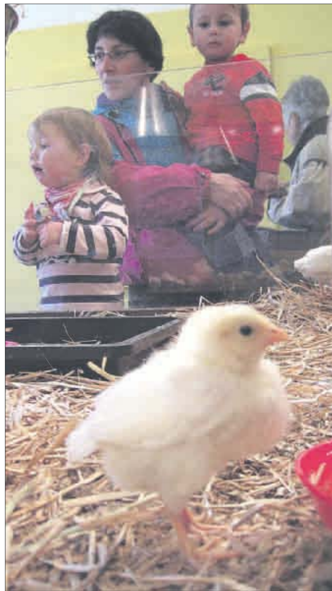
Echte Küken schlüpfen aus echten Eiern: Für Großstadtkinder eine riesen Attraktion.

Die Kükenausstellung ist neben der Evolutionsausstellung die erste Sonderschau seit Wiedereröffnung des Museums am