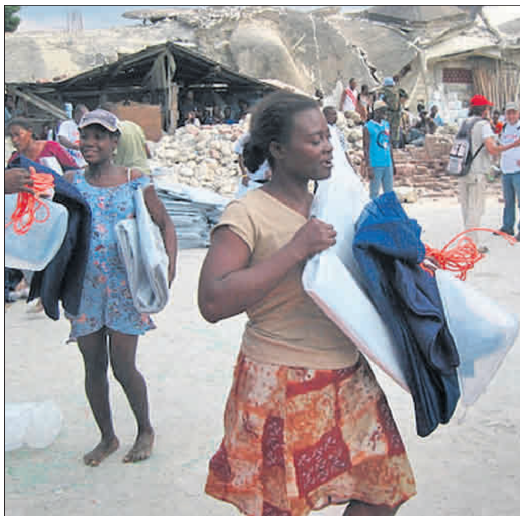
Decken, Wasserkänter und Plastikplanen für Notunterkunft verteilte Caritas international in diesen Tagen in der weitgehend zerstörten Stadt Léogâne. Das Aktionsbündnis „Südbaden hilft“ will weiter Soforthilfe leisten und den Wiederaufbau des Landes nach Kräften unterstützen.

Alle Spenden der Aktion „Südbaden hilft“ dienen nach der Soforthilfe dem Wiederaufbau einer Region außerhalb der