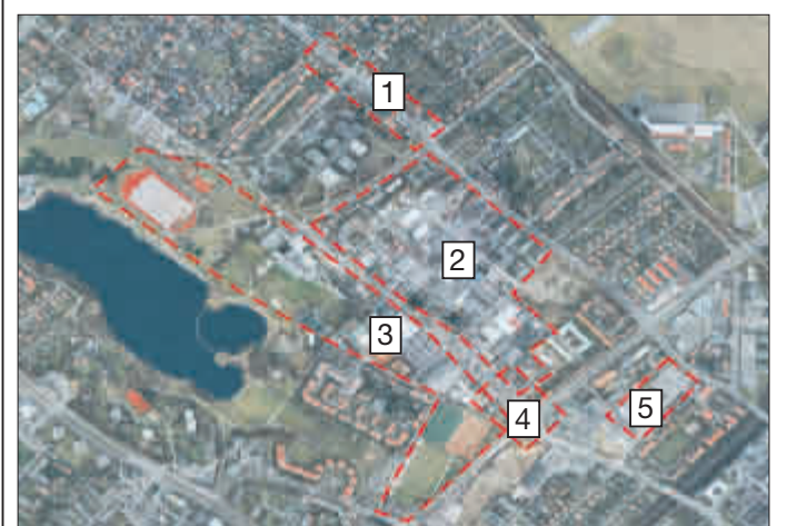
Wie geht es weiter rund um die Berliner Allee? Antworten soll eine Planungswerkstatt finden.

Planungswerkstatt zum Rahmenkonzept Berliner Allee am 5. März