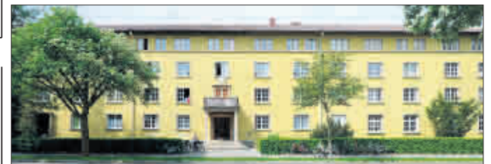
Wohnheim St. Luitgard in der Quäkerstraße.

Fraktion vor Ort in St. Luitgard, Montag, 1.2., um 19.30 Uhr