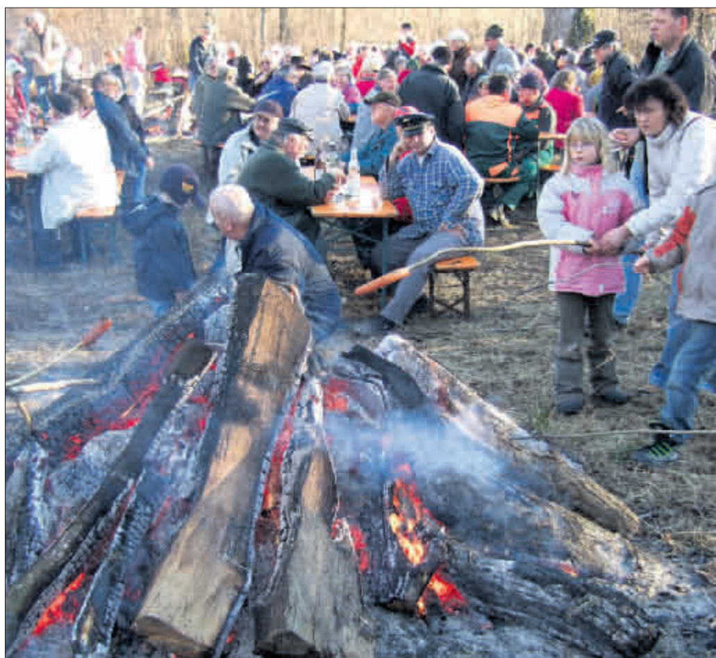
Holzversteigerung und Waldfest in Waltershofen

Termin: Di 5.2., 19.30 Uhr, ESG, Turnseestr. 16, Eintritt frei.