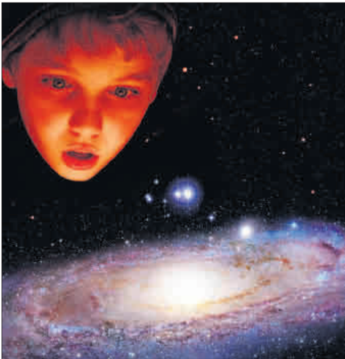
Staunen über die himmlische Seite der Erde: Das Planetarium Freiburg freut sich über die guten Besucherzahlen im Jahr 2009.

Weitere Infos gibt es im Internet unter: www.planetarium-freiburg.de