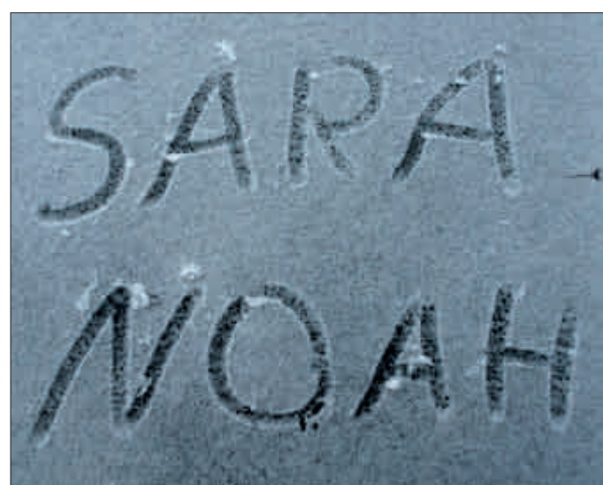
„Sara“ und „Noah“ haben in der letztjährigen Namensstatistik die deutlichsten Spuren hinterlassen.

Die Maximalwerte aus den Rubriken Länge und Gewicht stehen 2009 bei 61 Zentimetern und 5190 Gramm. Bemerkenswert ist ferner auch die Zahl 39: So viele Jahre beträgt der Altersabstand zwischen der jüngsten Mutter (Jahrgang 1994) und der ältesten (Jahrgang 1955). Der jüngste Vater war ebenfalls gerade einmal 15 Jahre alt, der älteste hingegen zählte schon 66 Lenze. Dass es zum Kinderkriegern fast nie zu spät ist, beweist noch eine letzte Zahl: 47 Jahre betrug der größte Altersunterschied zwischen Mutter und Vater. ☛