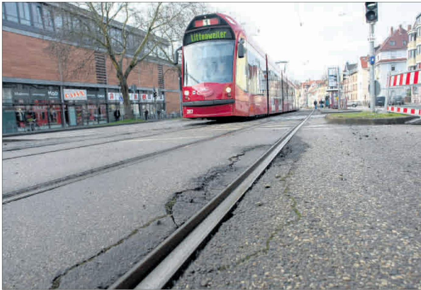
Die Schwarzwaldstraße – hier beim Zentrum Oberwiehre – wird in den kommenden zwei Jahren unter- und oberirdisch komplett erneuert.