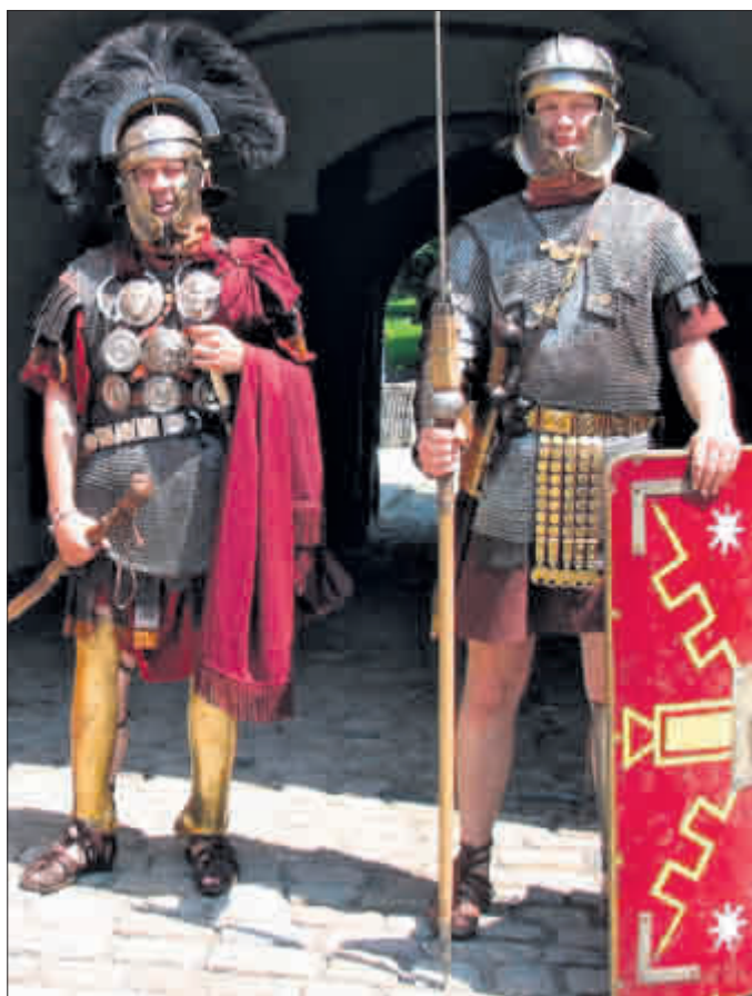
Auch nach 2000 Jahren noch eindrucksvoll: Römische Legionäre präsentieren sich am Sonntag in voller Kampfmontur