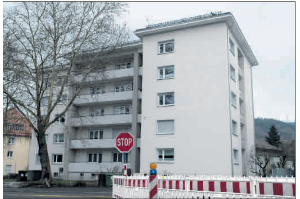
Äußerlich unscheinbar, repräsentiert das jüngste sanierte Wohnhaus in der Habsburgerstraße den aktuellen energetischen Standard.

Die Stadt Freiburg hat sich ein ehrgeiziges Ziel bei der Einsparung von Kohlendioxid gesetzt und fordert unter anderem bei Neubauten strenge energetische Grenzen ein. Wichtig ist aber auch die energetische Sanierung im Bestand. Und da geht die Stadtverwaltung Freiburg mit gutem Beispiel voran. Das Amt für Liegenschaften und Wohnungswesen (ALW) verwaltet den städtischen Immobilienbestand, zu