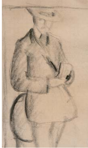
Selbstbildnis, 1909 Walter mit Spitzenkragen, 1912 Milchkrug, 1909 Kirche in Kandern, 1911

August Macke zählt zu den bedeutendsten Pionieren der Moderne. Gemeinsam mit Franz Marc und Wassily Kandinsky beteiligte er sich an der Redaktion des Almanach »Der blaue Reiter«. Weltberühmt wurde er mit seinen lichtdurchfluteten Aquarellen der Tunisreise. Die Ausstellung im Museum für Neue Kunst Freiburg wirft nun einen neuen Blick auf den temperamentvollen und gleichzeitig nachdenklichen Charakter Mackes: Mit über 140 Werken – Gemälden, Zeichnungen, Skulpturen, Entwürfen und kunstgewerblichen Arbeiten ausschließlich aus dem Besitz der Familie und viele davon erstmals öffentlich ausgestellt – widmet sie sich »August Macke – ganz privat«, einem bislang wenig bekannten Kapitel seines Schaffens.