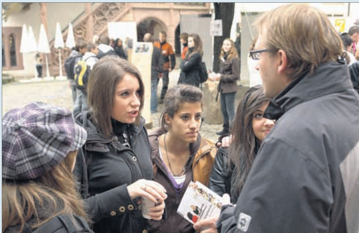
... setzen die jungen Frauen meist auf ihre kommunikativen Fähigkeiten. Ausnahmen vom traditionellen Rollenverhalten gab es natürlich auch.