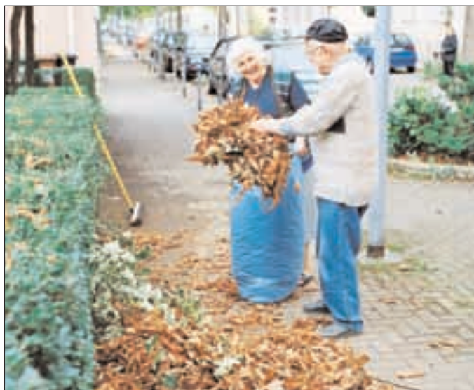
Fast perfekt: Mit dem Laubsack der ASF ließe sich das Herbstproblem noch eleganter lösen.