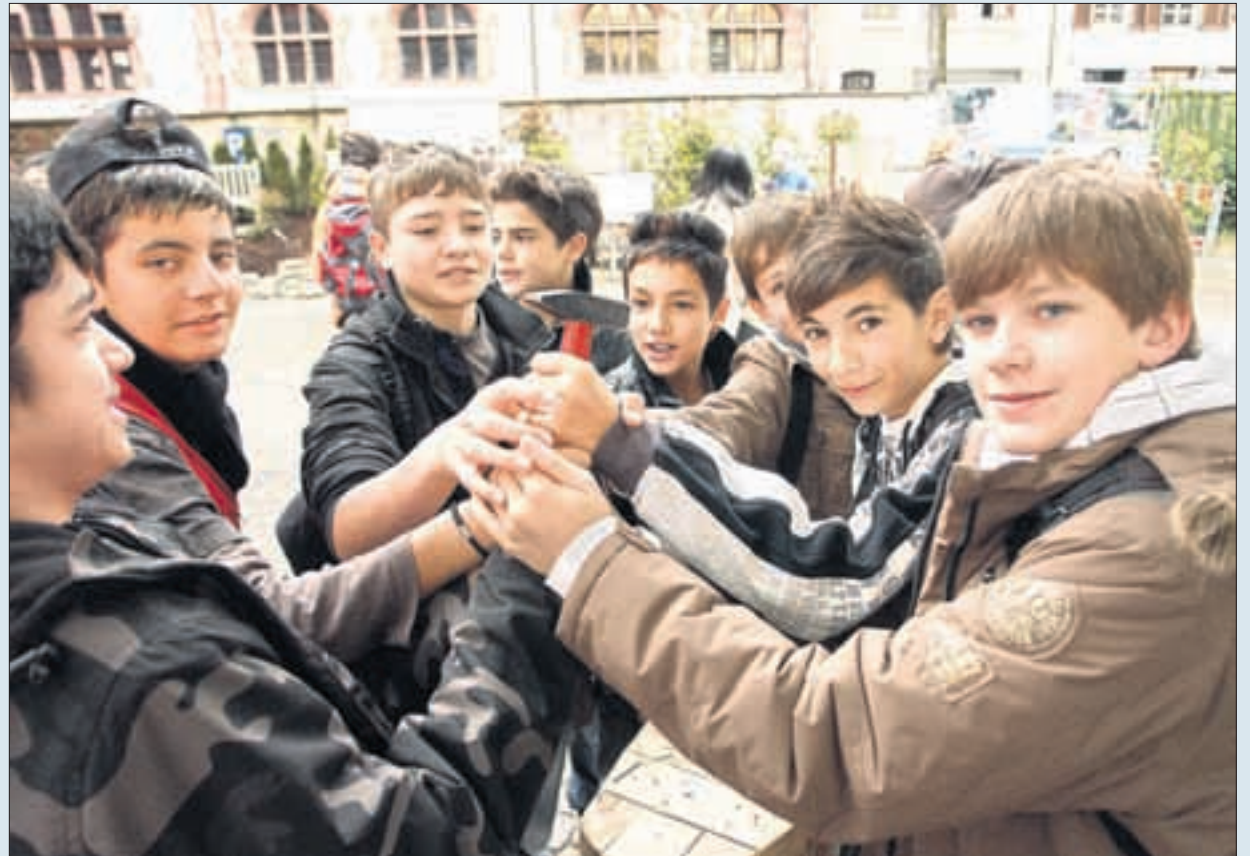
Während sich die Jungs beim Tag der Ausbildung vor allem für Handfestes interessierten ...