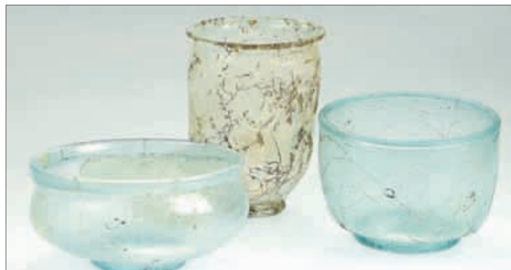
Filigran und 2000 Jahre alt: römischer Glasfund aus Lahr.

gen, den rund 300 gezeigten Römerfunden aus der Region Leben einzuhauchen. Gegenüberstellungen von Haushaltsgegenständen zeigen beispielsweise im Raum „Alltag“ den Unterschied zwischen einem einfachen und einem reichen Römerhaushalt und erzählen so etwas von den sozialen Unterschieden in der Antike. Im Ausstellungsraum „Technik“ zeigen weitere Gegenüberstellungen Erstaunliches: Viele Werkzeuge wie Zangen oder Hämmer waren schon vor zweitausend Jahren so ausgereift, dass sie sich von den heutigen Werkzeugen kaum unterscheiden. Ganz anders die Kommunikationsmittel: Zwischen dem römischen Tontäfelchen mit Schriftzeichen und der Computerfestplatte liegen natürlich Welten. Die Ausstellung setzt erläu-