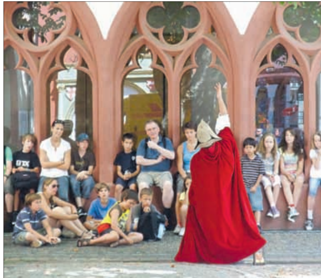
Höhepunkt eines Freiburg-Aufenthalts ist für viele Gäste eine der historischen Stadtführungen, die in der Tourist-Information gebucht werden können.