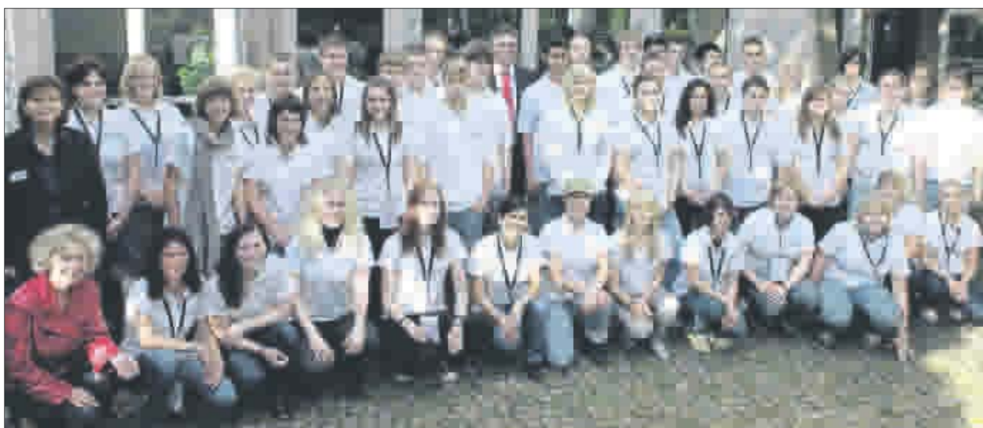
Ausbildungsbeginn bei der Stadt Freiburg. Unser Bild zeigt die neuen Auszubildenden, Praktikanten und Teilnehmer des Freiwilligen Sozialen sowie Gemeinnützigen Bildungsjahres. Für die angehenden Straßenbauer, Gärtner, Bauzeichner, Forstwirte und Verwaltungswirte beiderlei Geschlechts begann die zwei- oder dreijährige Ausbildung mit vier spannenden Einführungsstagen und ersten Einblicken in das künftige Arbeitsfeld. Das Haupt- und Personalamt organisierte aber nicht nur Baustellenbesichtigungen, Waldführungen und Vorträge, sondern auch einen aufregenden Besuch im Waldseilgarten und ein Abschlusssessen mit Eltern, Ausbildern und dem Oberbürgermeister.