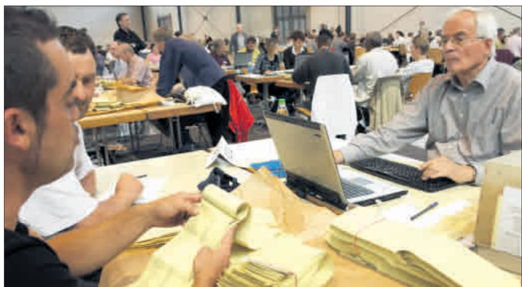
Alle vergebenen Stimmen mussten zunächst in einen Laptop übertragen werden, bevor die eigentliche Auswertung beginnen konnte.

Um die insgesamt 96 Sitze in den Stadtteilgremien – zwischen zehn und vierzehn je Ortschaft – bewarben sich 293 Kandidatinnen und Kandidaten. Alle gewählten Ortschaftsräte sind in untenstehender Liste aufgeführt.