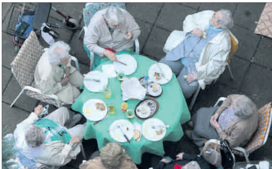
Mehr als Kaffeekränzchen: Welche Möglichkeiten es für ein aktives und selbstbestimmtes Leben im Alter gibt, wissen die Fachleute vom Seniorenbüro.

Im Schnitt führen wir pro Monat über 200 Gespräche. In