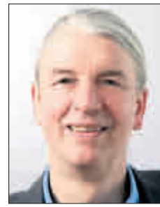
Frey, Gerhard Die Grünen Buchhändler 26 155 Stimmen