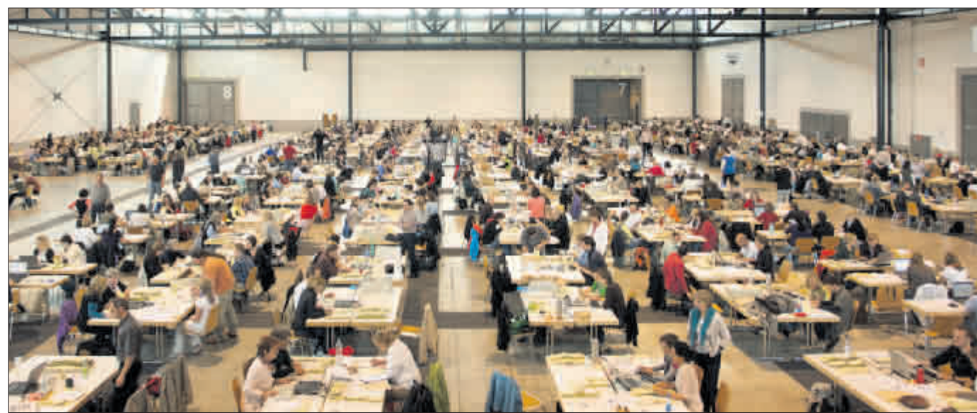
Das große Auszählen der Kommunalwahl endete nach fast genau acht Stunden am Montag vergangener Woche gegen 16 Uhr. Etwa 900 städtische Mitarbeiterinnen und Mitarbeiter hatten hierfür eine ganze Messehalle in Beschlag genommen.

Mit zehn verschiedenen Parteien und Gruppierungen wird der Gemeinderat so bunt sein wie nie zuvor. Damit setzt sich der Trend der letzten Jahrzehnte zu immer mehr Parteien fort. Waren 1975 nur vier Parteien im Rat vertreten, stieg ihre Zahl 1984 auf sechs, 1994 auf neun und jetzt auf zehn. Das hat zur Folge, dass die großen Volksparteien der 60er- und 70er-Jahre, CDU und SPD, die damals über drei Viertel der Ratssitze inne hatten, heute nicht einmal mehr die Hälfte der Räte stellen.