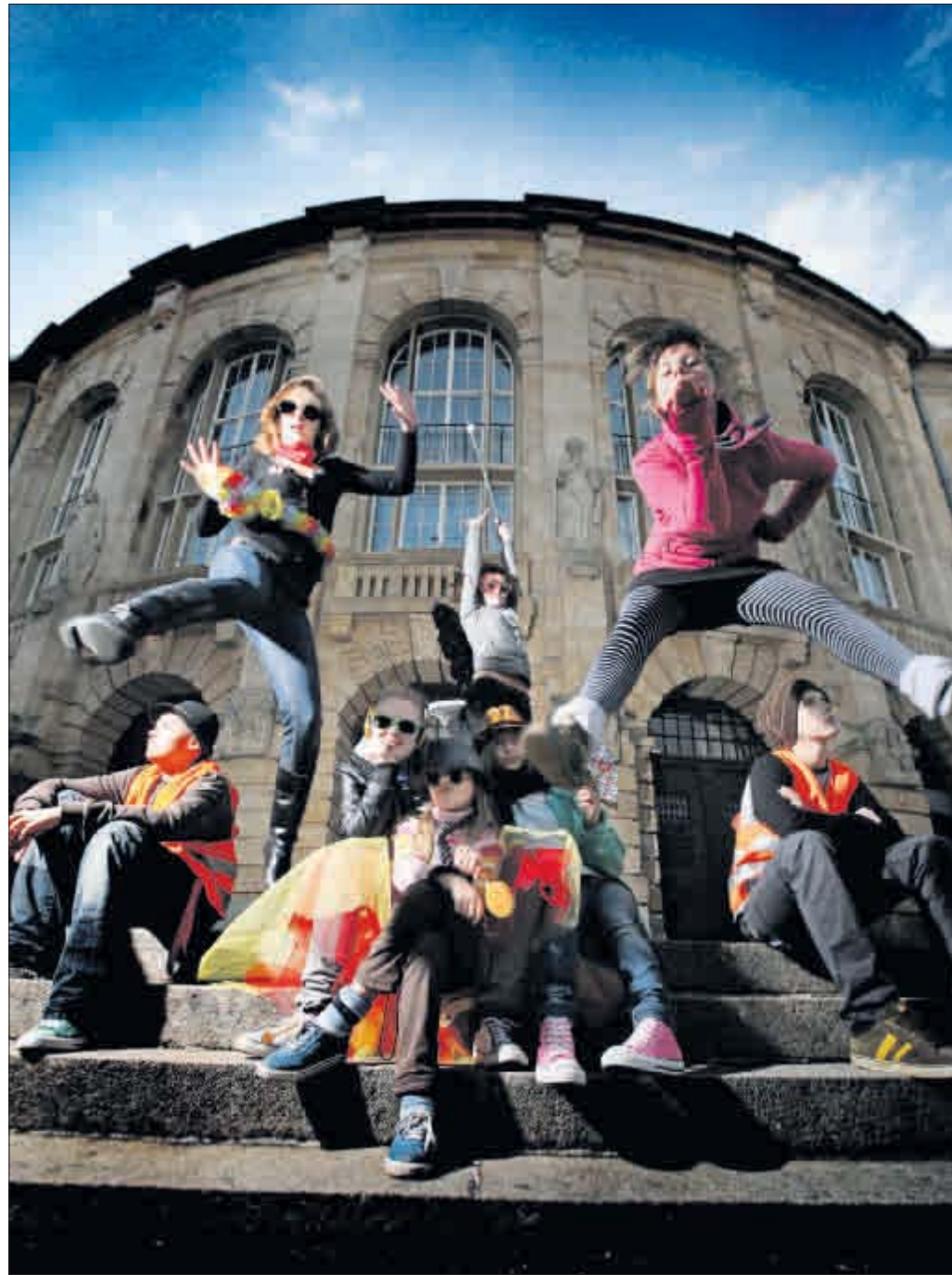
Das junge Theater bildet jetzt die „vierte Sparte“.

Generalmusikdirektor Fabrice Bollon berichtet ebenfalls von künstlerischen Brückenschlägen, wenn er ankündigt, ein Orchester aus Theaterabonnenten aufbauen zu wollen, das auch ins Musikleben des Theaters integriert werden soll. „Es