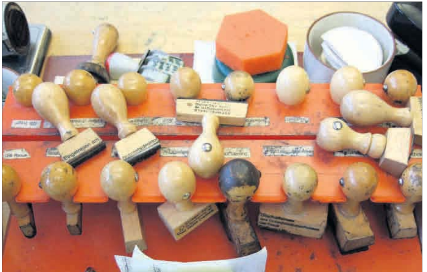
Stempelwahn: Das Anfertigen von amtlichen Statistiken und Berichten im Auftrag von Bund und Land kostet Städte und Gemeinden viel Geld. Allein Freiburg gibt rund eine Million Euro pro Jahr dafür aus.

EU, Bund und Länder wälzen Berichts- und Statistikaufgaben auf Kreise und Kommunen ab