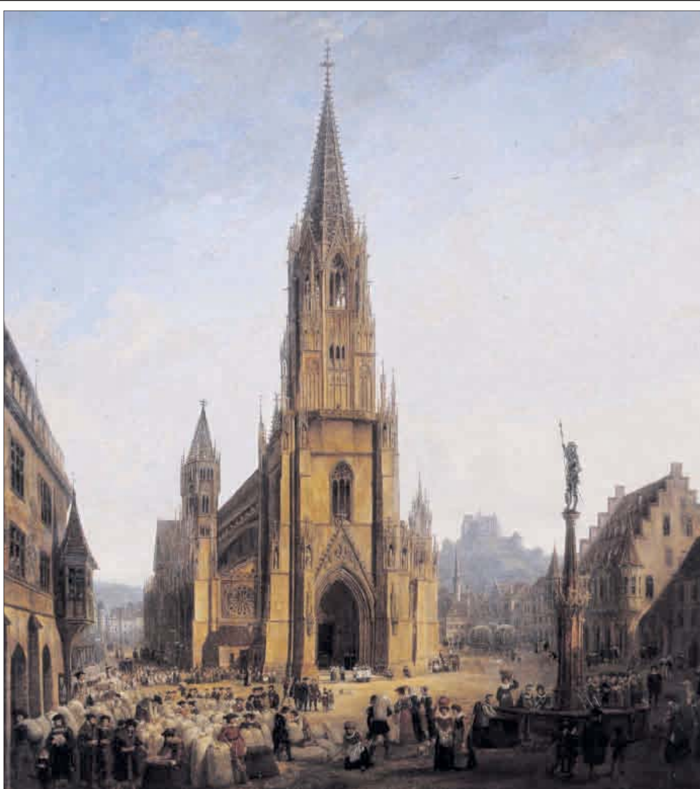
„Vom Friedhof zum Markt – Der Münsterplatz im Wandel“ heißt eine Ausstellung, die noch bis zum 26. Juli im Museum für Stadtgeschichte am Münsterplatz zu sehen ist.

Führungen: „Das Heiliggeistspital“ Fr, 22.5. 12.30 Uhr „Das Dorf hat Dächer...“ So, 24.5. 11 Uhr „Familienführung: Jahreszeiten“ So, 24.5. 12 Uhr „Die Stadtmodelle“ Fr, 29.5. 15 Uhr