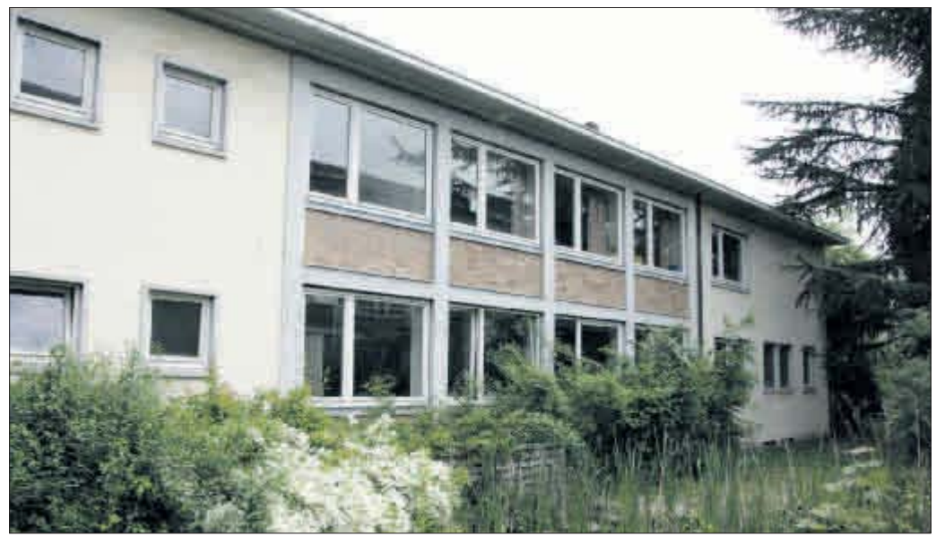
Einem Neubau weichen muss das ehemalige Wohnheim der Merianschule, die aus allen Nähten platzt und dringend mehr Raum braucht.