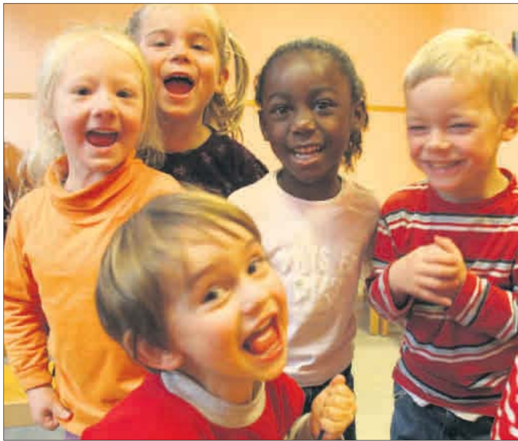
Das freut die Kleinen – und ihre Eltern: Neue Richtlinien zur Kindergartenfinanzierung sollen das Angebot verbessern und die Preise durchschaubarer machen.

Stadt baut Kindergartenförderung um und nimmt mehr Geld für Betreuung in die Hand