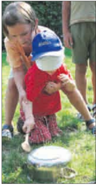
Ein Topf, ein Löffel – fertig ist das perfekte Kinderspiel.

Im vergangenen Jahr rief das Deutsche Kinderhilfswerk den ersten Weltspieltag in Deutschland aus. Kindertagesstätten, Schulen, Initiativen und Projekte der Jugendarbeit und von Jugendverbänden waren aufgerufen, in ihrer Stadt oder Ge-