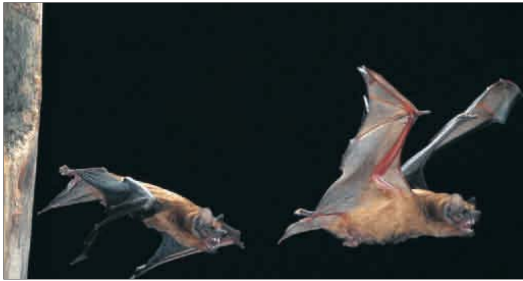
Solch spektakuläre Fotos wie von diesem Abendsegler im Ablug gelingen nur Profis mit einer speziellen Fotoausrüstung.

Am Waldsee kann man Fledermäuse beobachten und belauschen