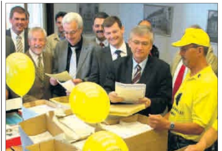
Regierungspräsident Julian Würtenberger (2. v. r.) mit den Einwendungen aus der Region.

Ganz überwiegend richten sich die Proteste gegen den unzureichenden Lärmschutz. Gemeinden, Bürgerinitiativen und Anlieger lehnen für die Neubaustrecke vor allem den „Schienenbonus“ ab, nach dem