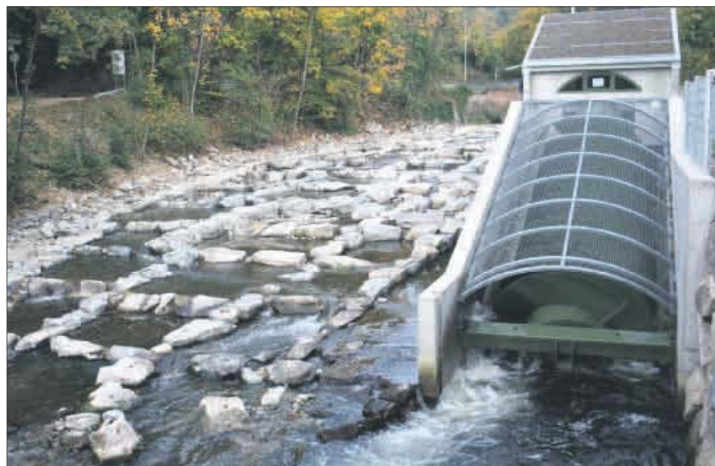
Diese Mühle klappert nicht mehr. Ihre archimedische Schraube liefert Energie und ist gegenüber Störungen weniger anfällig. Links im Bild die Fischtreppe.

Ihren ersten erfolgreichen Probetrieb absolvierte vergangene Woche die neue Wasserkraftanlage an der Dreisam unterhalb des Sandfangwehres. Die Anlage, mit deren Bau im vergangenen Sommer begonnen wurde, soll einen der letzten Standorte mit nennenswertem Wasserkraftpotenzial in Freiburg nutzen.