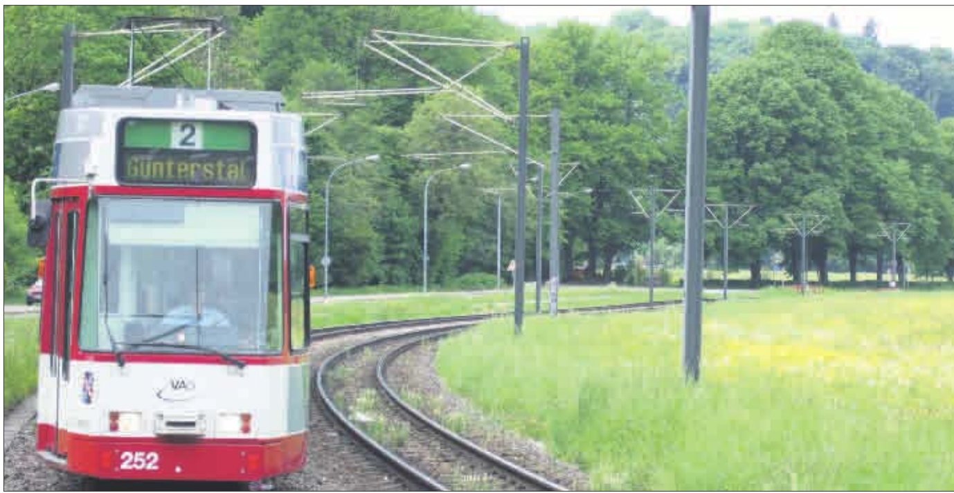
Abgesehen von der sattgrünen Wiese ist dieses Bild ab 1. November wieder täglich im 7,5-Minuten-Takt zu sehen: Nach fünfmonatiger Auszeit kehrt die Stadtbahn nach Günterstal zurück

Seit dem 14. Oktober 1901 konnten die Freiburger von der Innenstadt aus mit der Stadtbahn nach Günterstal fahren. Damit war am 2. Juni 2008 Schluss. Weil in der Günterstalstraße von den Kanälen im Untergrund über die Stadtbahngleise bis zum Fahrbelag alles marode war, tat eine Generalsanierung not. Binnen fünf Monaten wurde zwischen den Bordsteinkanten alles erneuert und auf den aktuellen Stand der Technik gebracht. In der südlichen Kaiser-Joseph-Straße wurde dasselbe Programm bereits 2003 erledigt, das Teilstück vom Wiesenweg bis zur Wonnhalde war sogar schon 1997 an der Reihe.