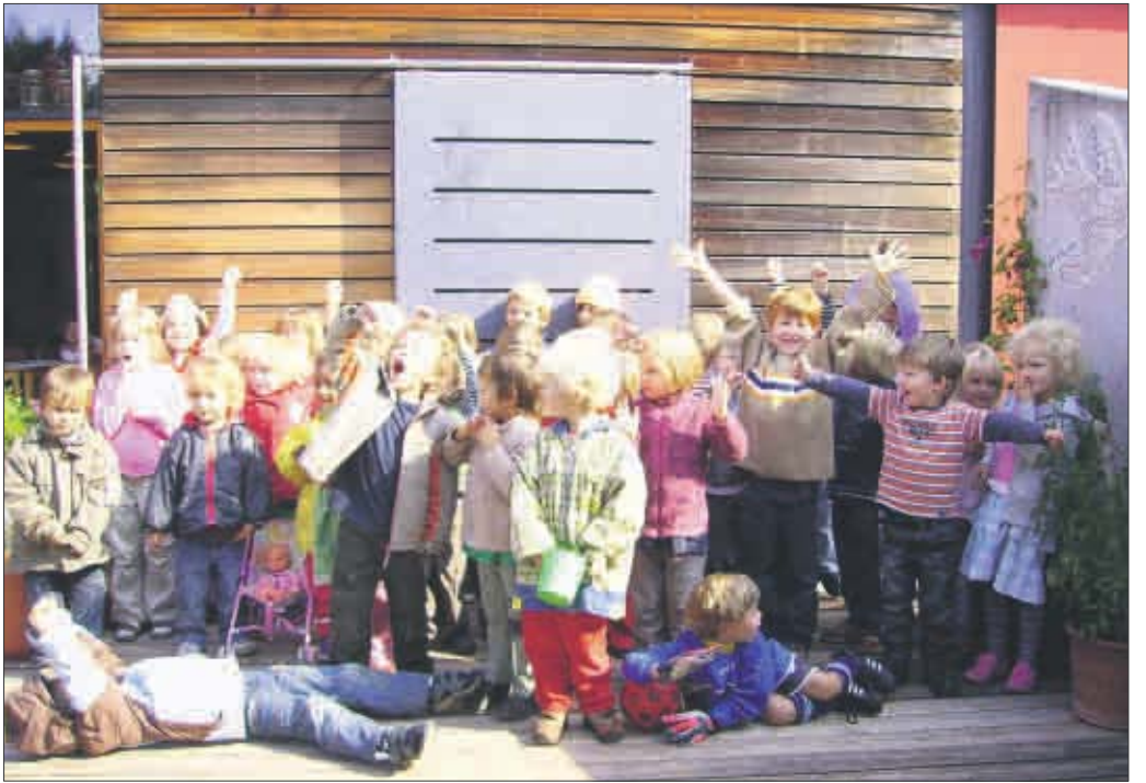
Gute Laune in der Kita Vauban

1. Preis beim Bundeswettbewerb für die Kindertagesstätte Vauban