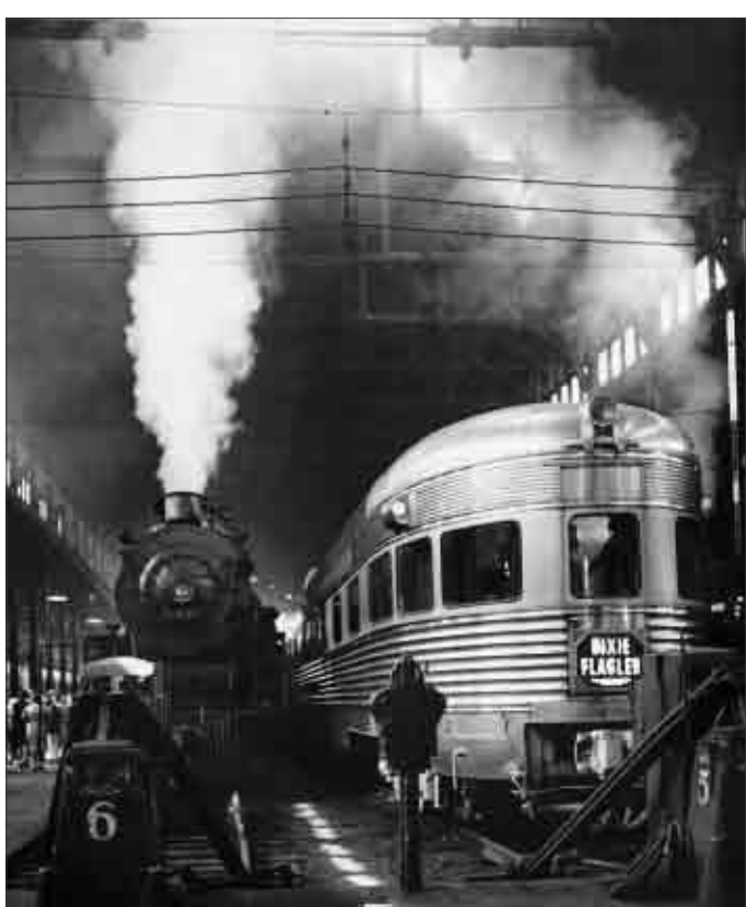
Andreas Feininger im Museum für Neue Kunst

Noch bis 18. Januar 2009 zeigt das Museum für Neue Kunst 95 ausgewählte Arbeiten des Fotografen Andreas Feininger, darunter auch das oben abgebildete „Dearborn Station, Chicago, 1941“. Ausführliche Infos dazu auf Seite 6 dieser Ausgabe.