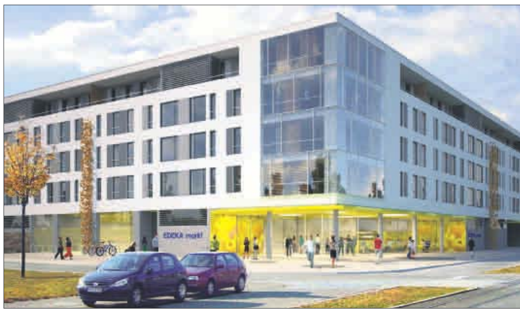
Voraussichtlich ab 2010 kann man an der Rieselfeldallee bei Edeka einkaufen. (Visualisierung: Stadtplanungsamt)

M ittlerweile leben 8700 Menschen im immer noch als „neu“ bezeichneten Stadtteil Rieselfeld. Die Infrastruktur hat sich seit 1996, als die ersten Rieselfelder ihre neue Heimat bezogen, erfreulich entwickelt – vom Stadtbahnanschluss über Schulen, Kinderhäuser und Kitas bis zur Stadtbibliothek ist alles vorhanden. Auch Einkaufsmöglichkeiten gibt es reichlich – nur ein Vollsortimenter, der alle Waren des täglichen Bedarfs anbietet, hat bislang gefehlt. Das ändert sich jetzt: Voraussichtlich Ende 2010/Anfang 2011 öffnet an der Ecke Rieselfeldallee/Maxim-Gorkij-Straße ein Edeka-Markt seine Pforten.