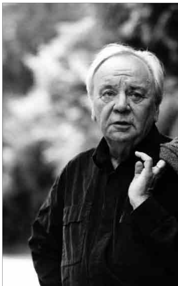
Jürgen Becker eröffnet die Literaturtage am 6. November mit einer Lesung im Neuen Ratssaal.

deutet das, im Dreiviertelstundentakt 13 unterschiedliche Zugänge zur Welt und zum Schreiben präsentiert zu bekommen. Mindestens 13, denn schließlich sind unter den geladenen Autoren auch solche, die sich und ihr Werk in Jahrzehnten immer wieder neu definiert haben, mutig Gattungsgrenzen übersprungen und unbekanntes Sprachgelände erschlossen haben. Von einem solchen Wandlungskünstler werden die diesjährigen Literaturtage auch eröffnet: Jürgen Becker, der in den 60er-Jahren als Shooting-Star der experimentellen Prosa galt, ab den Siebziger als Lyriker von sich reden machte und 1999 mit „Aus der Geschichte der Trennungen“ sein viel beachtetes Romandebüt gab, liest am Donnerstag, den 6. November.