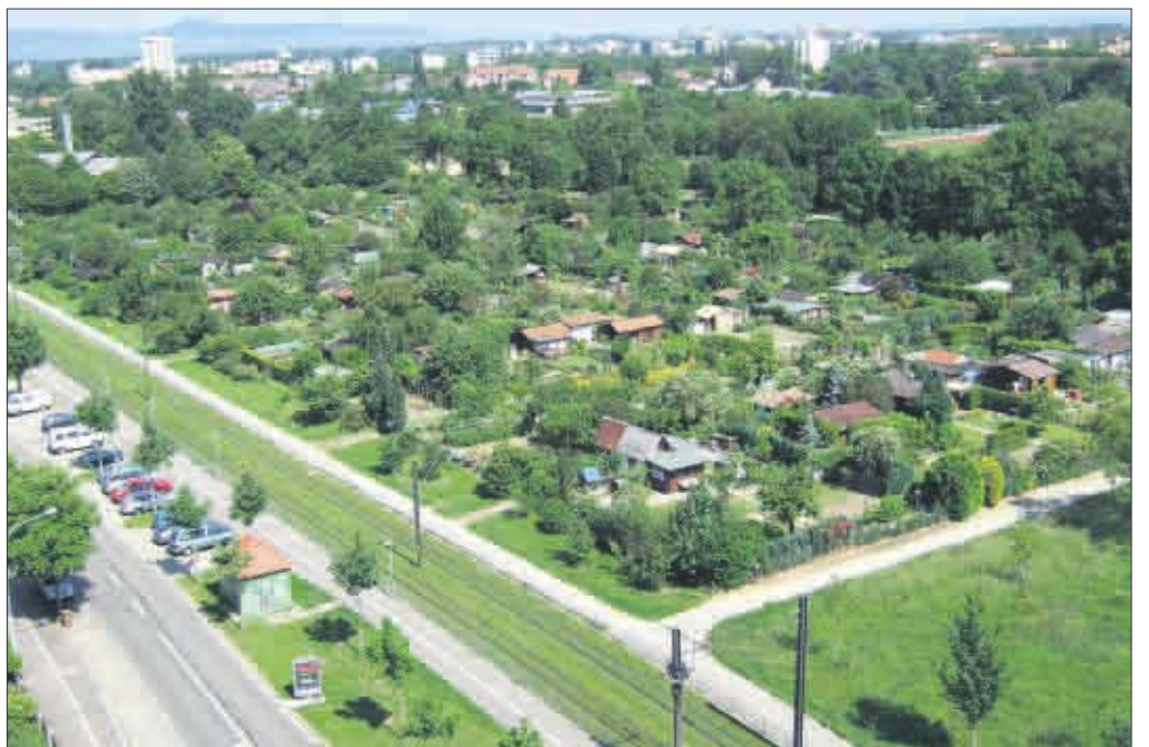
Parallel zur Carl-Kistner-Straße und zur Stadtbahnlinie (Vordergrund) soll in den kommenden Jahren Geschosswohnungsbau entstehen. Auf dem letzten großen innerstädtischen Areal befinden sich zur Zeit noch Kleingärten.

Auftaktveranstaltung zur Bürgerbeteiligung in der Stadtteilplanung