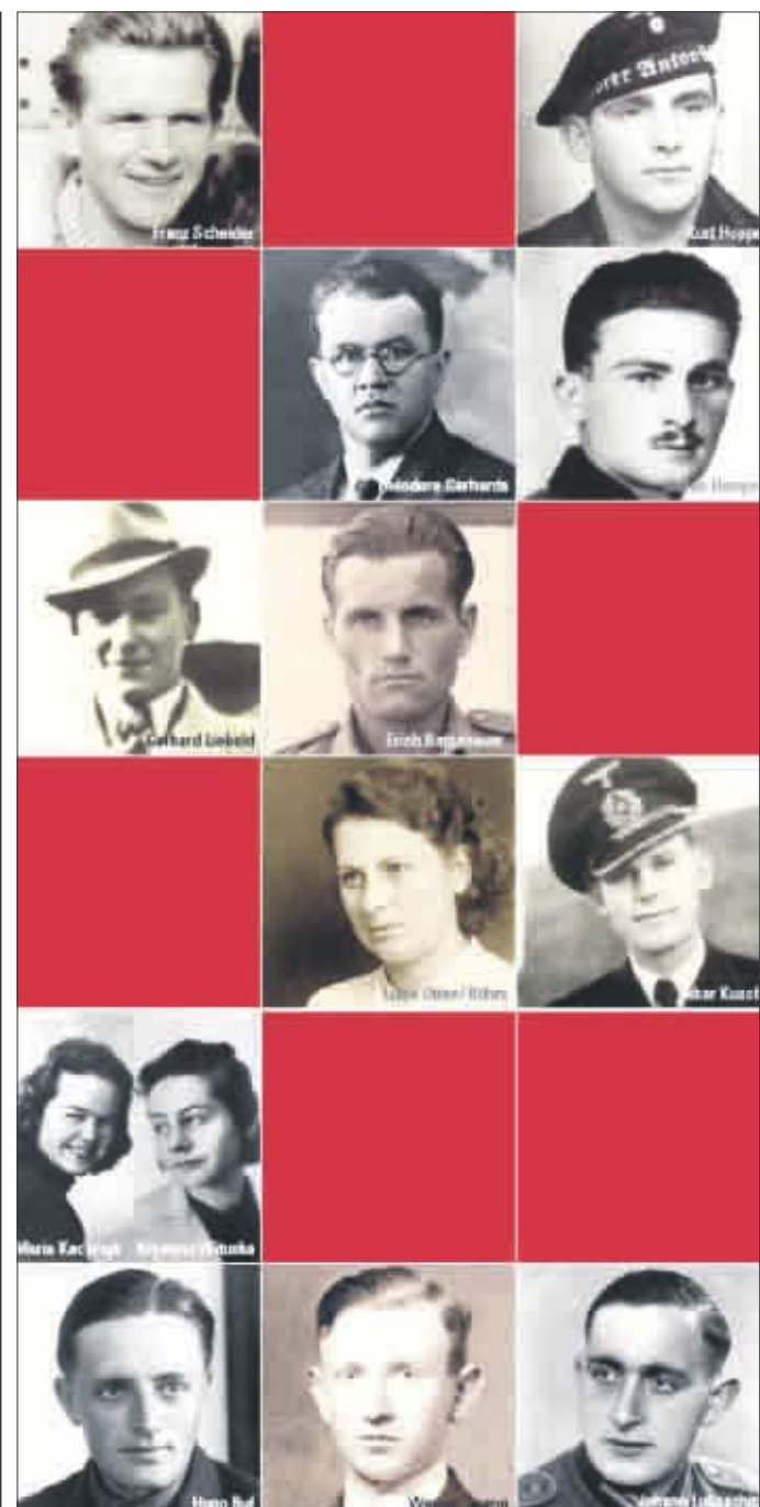
Im zentralen Teil der Ausstellung werden die Lebenswege von Menschen nachgezeichnet, die die Wehrmachtjustiz zu schweren Strafen oder zum Tode verurteilte. Die meisten erlebten das Ende des Krieges nicht mehr.