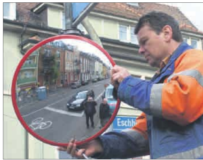
Alles im Blick: Trixi-Spiegel können die Sicherheit an Kreuzungen erhöhen.

Ob der theoretische Sicherheitsvorteil, den die Spiegel