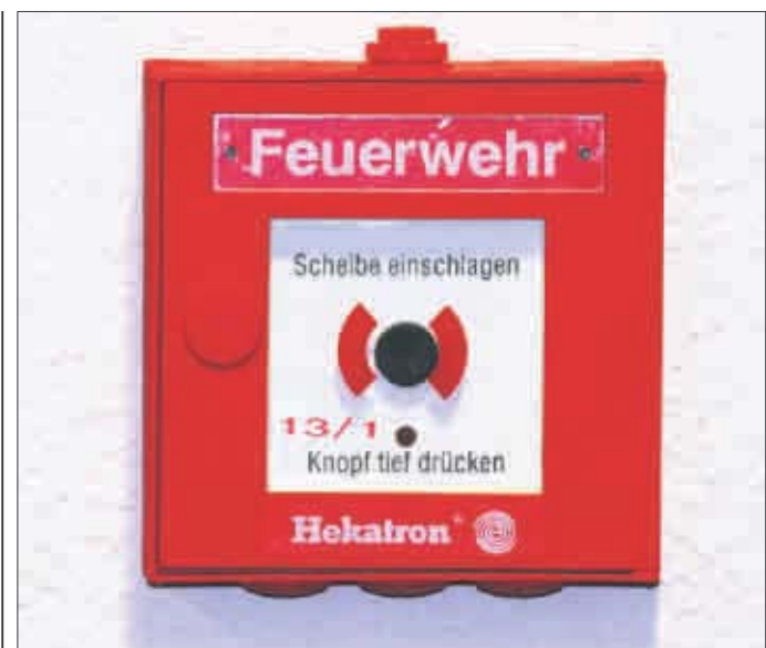
Noch effektiver als bislang sollen Rettungsdienste und Feuerwehr künftig zusammenarbeiten.

Mit zehn bis elf Mitarbeitern soll die Leitstelle tagsüber besetzt werden, nachts werden