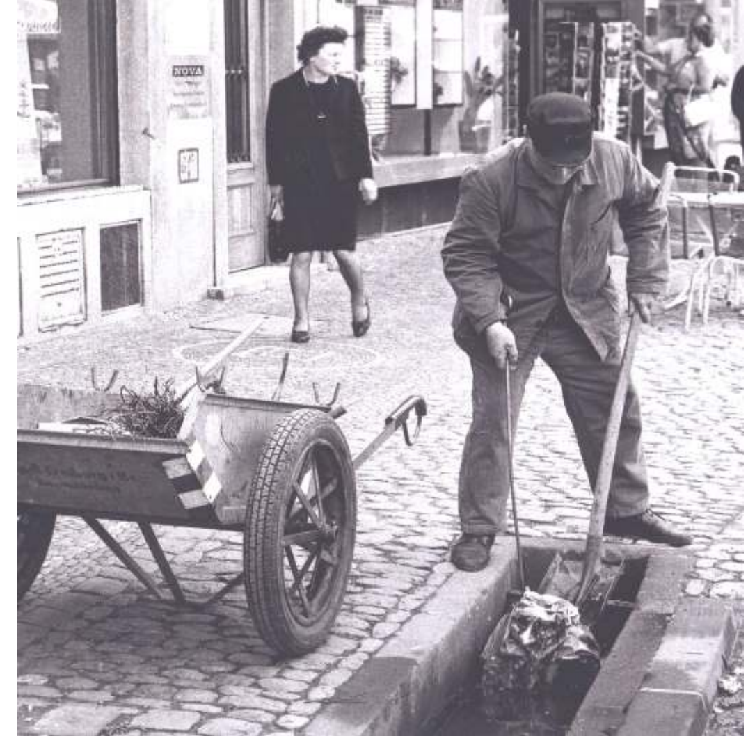
Bächleputzer - Channel Cleaner