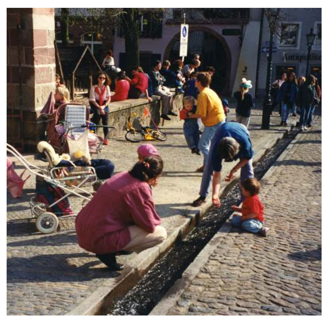
Bächlespiele - Playing in the Channel