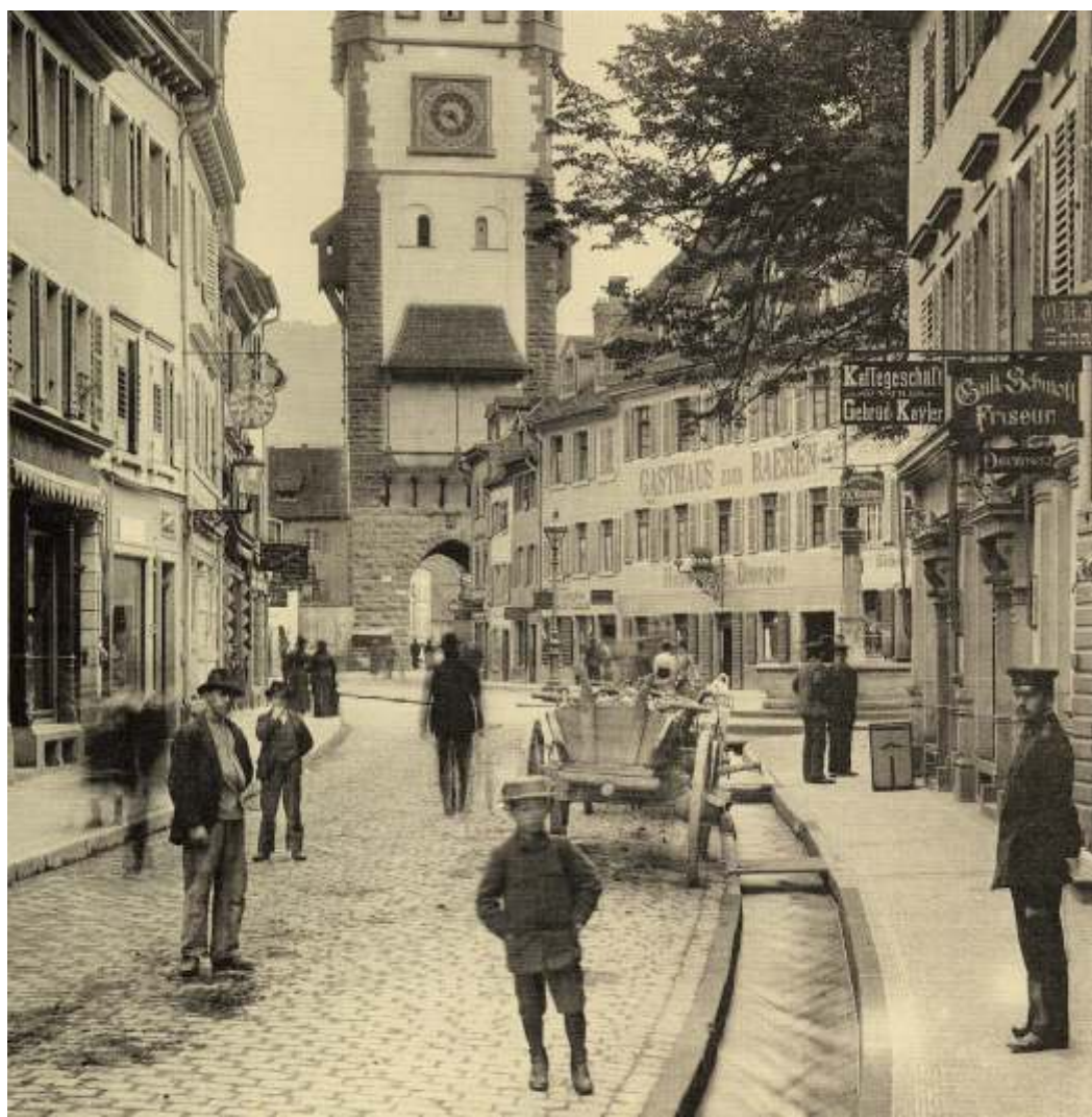
Herrenstraße, historisch - Herrenstreet, historic