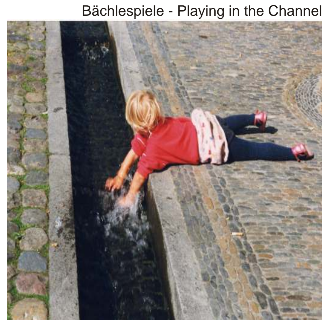
Kühle Hände - Cooling the Hand