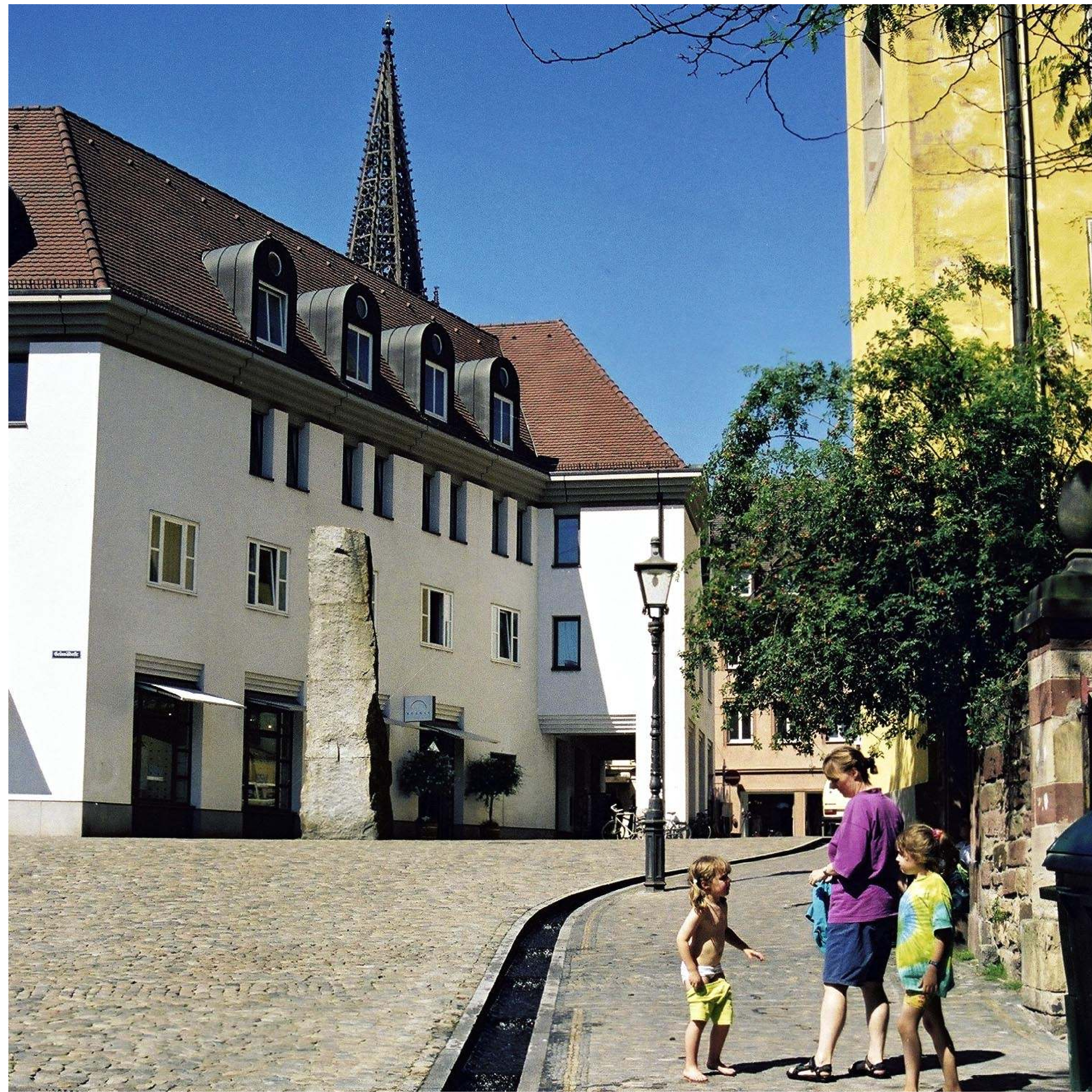
Augustinerplatz - Augustiner Square