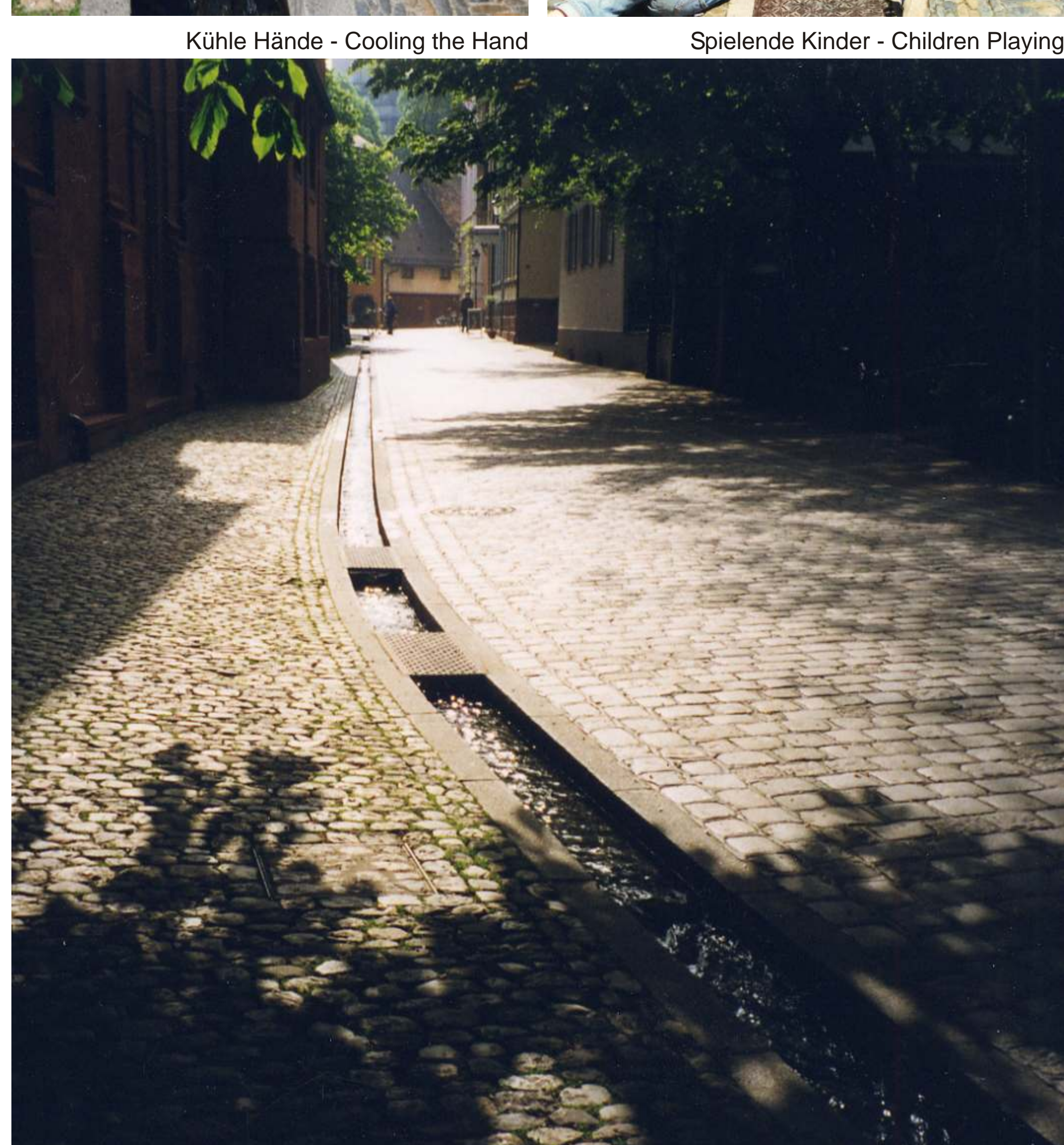
Adelhauserstraße, gleisendes Bächle - Adelhauser Street Channel with Flowing Water