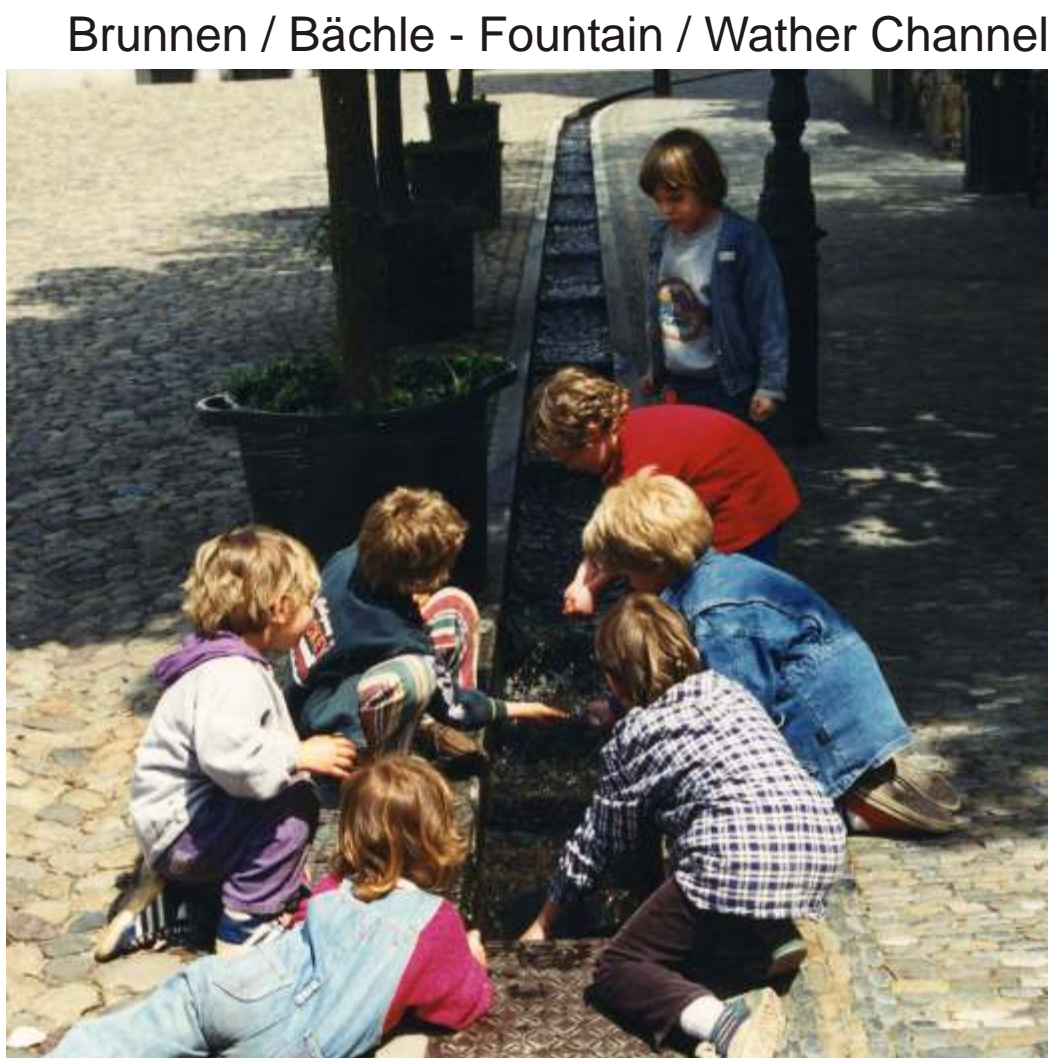
Spielende Kinder - Children Playing