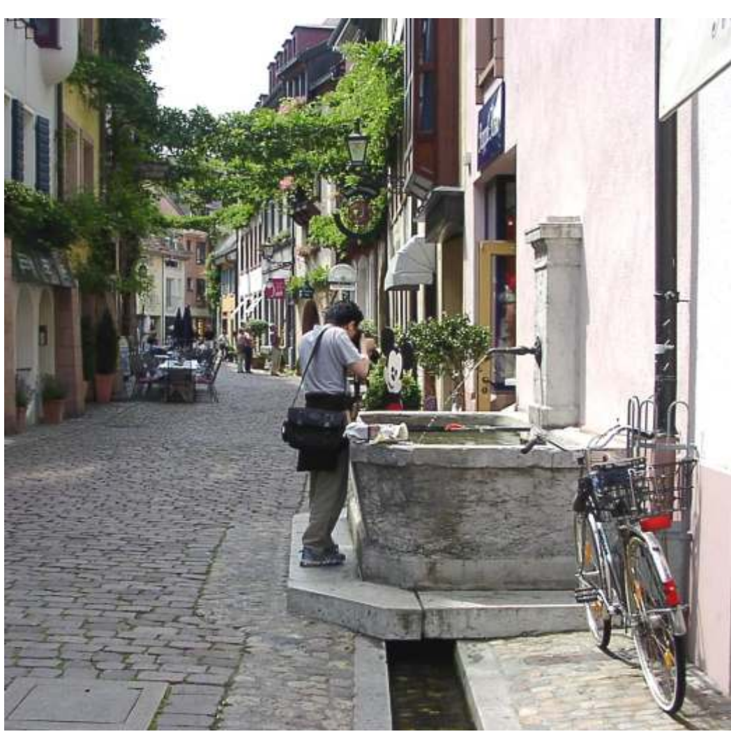
Brunnen / Bächle - Fountain / Water Channel