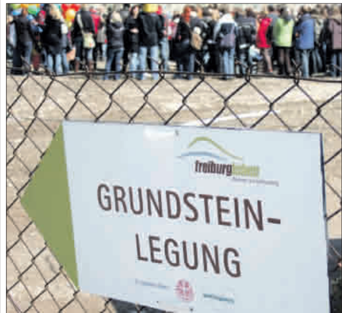
Unnötiger Hinweis: Fast überall in Freiburg finden dieser Tage Grundsteinlegungen statt

Als Bauherr für das gesamte Projekt, das unter dem Namen „Freiburg Leben“ vermarktet wird, zeichnet das Siedlungswerk Stuttgart verantwortlich, das überwiegend dem Bistum Rottenburg-Stuttgart gehört. In dem neuen Quartier will das Unternehmen soziale und ökologische Faktoren gleichermaßen berücksichtigen: Generationenübergreifendes und barrierefreies Wohnen sind am Fuße des Schlossbergs ebenso geplant wie eine innovative Energieversorgung über ein eigenes Nahwärmenetz. ☛