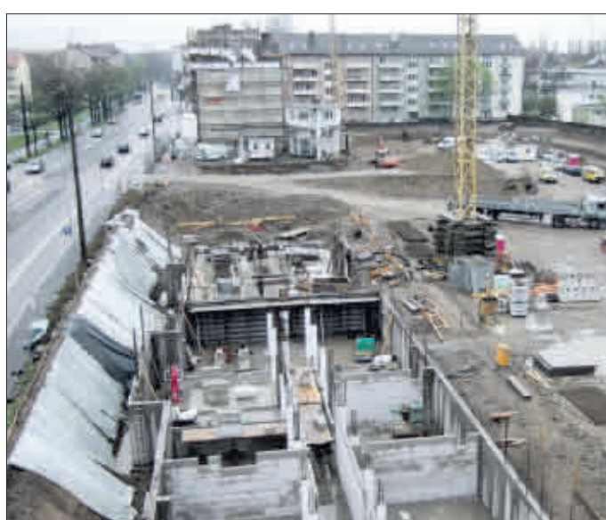
An der Zähringer Straße wird derzeit eines der größten Innenentwicklungspotenziale erschlossen

50 Hektar „realisierbares“, also tatsächlich nutzbares Innenentwicklungspotenzial sind im Flächennutzungsplan 2020 (FNP) berücksichtigt. Das wurde von manchen als unrealistisch hoch eingestuft – und erweist sich nach den jetzt vorliegenden Ergebnissen des Komreg-Projekts (siehe „Stichwort“) doch eher als sehr vorsichtige Schätzung. Eine systematische und flächendeckende Untersuchung im Stadtgebiet Freiburg, bei der alle für eine Bebauung in Frage kommenden Flächen auf 250 Quadratmetern aufgenommen wurden, hat ein theoretisches Innenentwicklungspotenzial von rund 230 Hektar ergeben. 74 Hektar, also etwas mehr als ein Drittel davon und rund 50