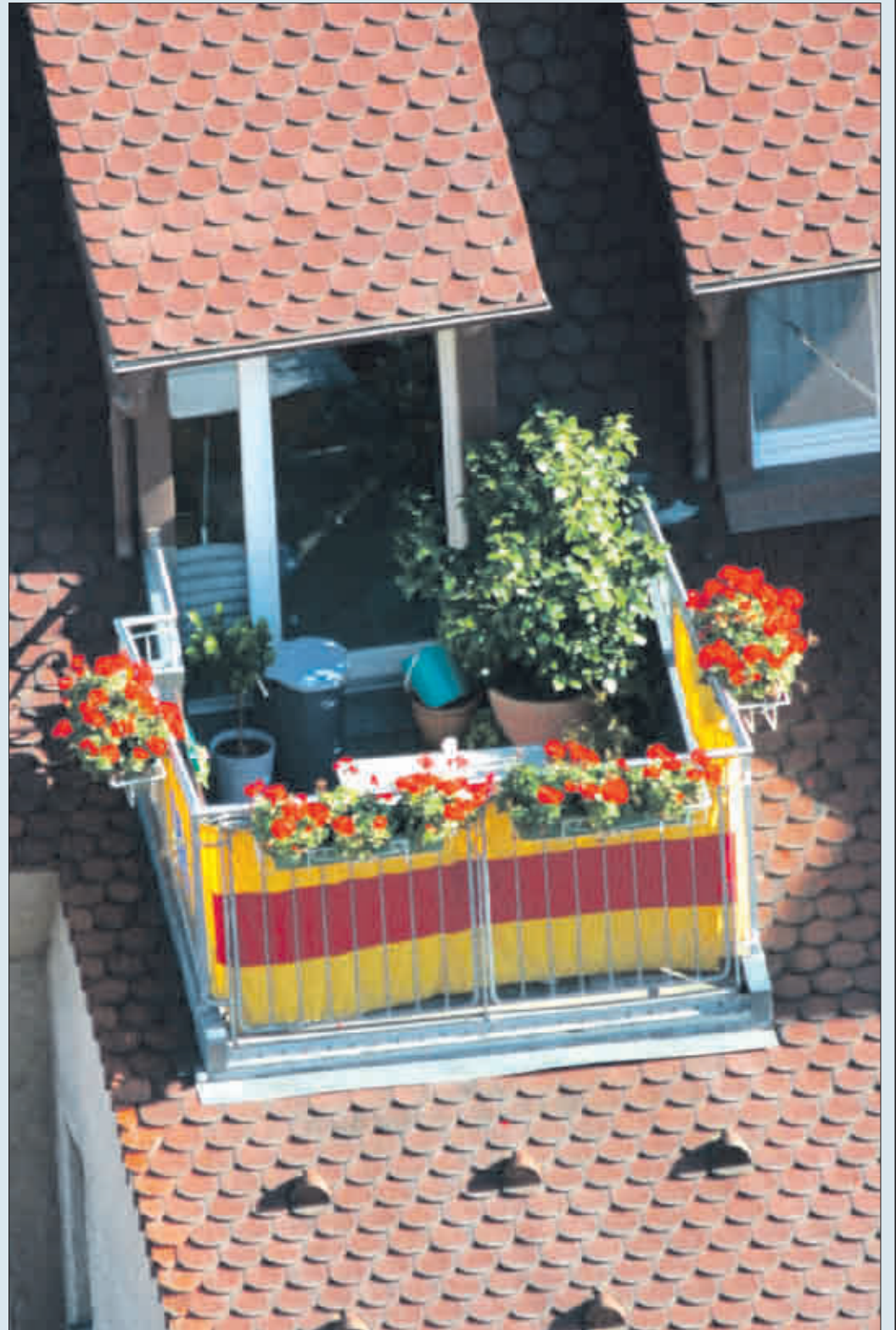
Vier Wände und ein Dach über dem Kopf können sich viele Bürgerinnen und Bürger aus eigener Kraft nicht leisten

Seitdem steigt die Kurve langsam, aber stetig wieder an. Grund genug, ein Konzept zu erarbeiten, wie in den kommenden Jahren der Bestand preisgünstiger Wohnungen gesichert und ausgebaut werden kann, um Haushalten mit niedrigem Einkommen Wohnungen zu tragbaren Mieten zu garantieren.