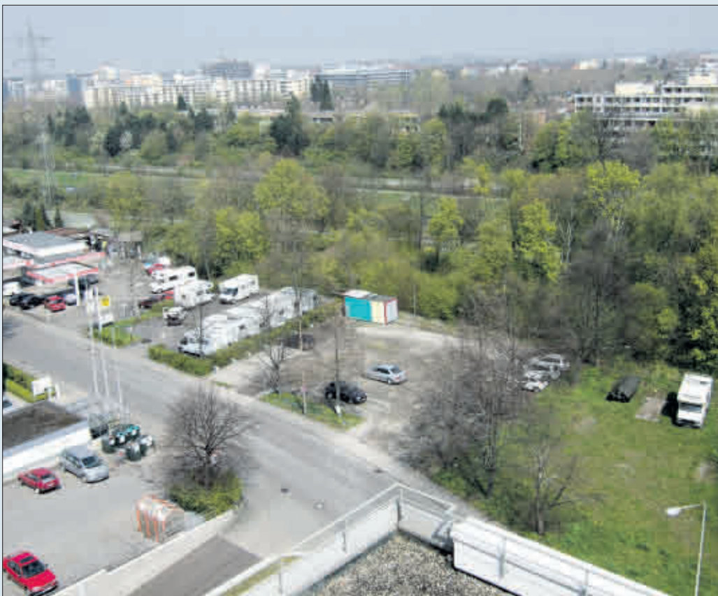
40 Wohnungen haben auf dem langgestreckten Grundstück in der Haslacher Straße Platz. Im Hintergrund verlaufen die Dreisam und der Zubringer Mitte

Stadtbauprojekt in der Haslacher Straße als eine Alternative zum Wohnheim