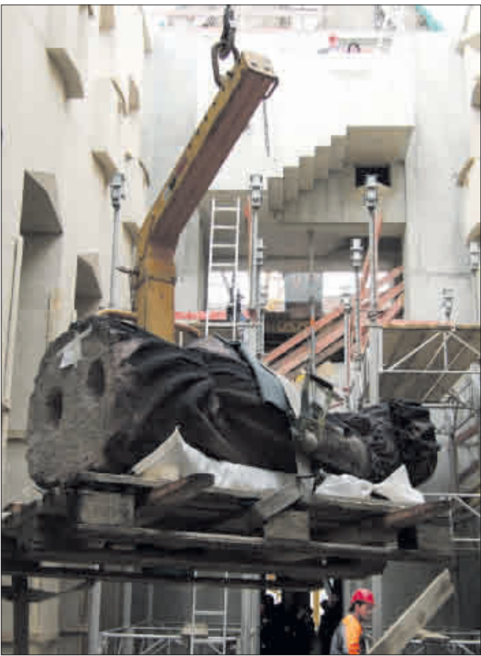
Vom Himmel hoch, da komm ich her

Herdern (Ludwig-Aschoff-Platz) Mo, 5.5. 13–15 Uhr