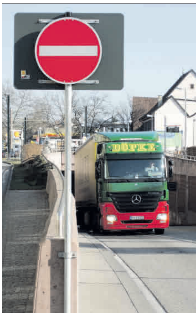
Einfahrt verboten: Bis Mitte Juni bleibt wegen Sanierungsarbeiten nachts jeweils eine Röhre der B31 Ost gesperrt

Die Leidtragenden der Sanierung sind die Anwohner entlang der Kappler, Hansjakob- und Schwarzwaldstraße. Sie müssen bis Mitte Juni damit leben, dass der Verkehr zwischen 19.30 und 6 Uhr morgens stadteinwärts (bzw. zwischen 21 und 7 Uhr stadtauswärts) mit Ausnahme einiger weniger Nächte und der Wochenenden durch ihr Wohnviertel rollt. In