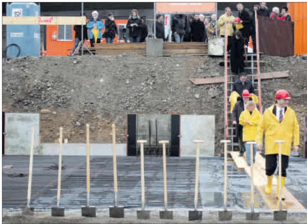
Auf die Plätze, fertig, los! Was die Spaten bewirken sollen, zeigt das Modell unten (Modell: FSB)

Architektonisch stellte die Bebauung neben der Bahnlinie eine große Herausforderung dar. Gilt es doch, die Bewohner nicht nur vor dem Lärm, son-