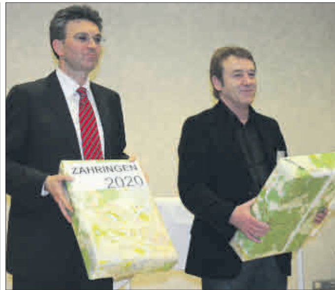
Gut angekommen: zwei Pakete mit zukunftssträchtigen Ideen und jeder Menge Aufgaben

Salomon zeigte sich begeistert von der Dynamik und Kreativität, mit der man sich in Zähringen an die Arbeit gemacht habe: Das Projekt im nördlichsten Freiburger Stadtteil sei eine „gelungene Premiere“ und in Hinblick auf die kommenden STEP-Etappen – ab Juni ist die Wiehre an der Reihe, später folgen St. Georgen, Haslach, Munzingen und Tiengen – „maßstabgebend“. Anerkennung gab es auch für die Verwaltung: Innerhalb weniger Wochen hat eine interne Arbeitsgruppe die zahlreichen Vorschläge gesichtet, geordnet und Bewertungen der Fachämter zu Machbarkeit und Zeithorizont eingeholt. Nicht nur die Quantität, auch die Qualität der so zusammengetragenen Ideen