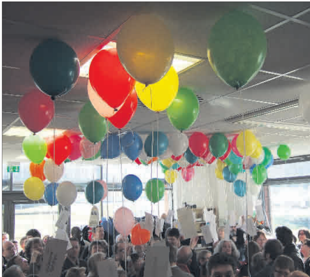
Buntes Treiben: Jeder Ballon steht für eine bürgerschaftlich engagierte Gruppe – und macht die Vielfalt derer deutlich, die jetzt im ZO „zu Hause“ sind

Der Umzug war notwendig geworden, weil der Gemeinderat beschlossen hatte, das Bürogebäude in der Wilhelmstraße 21 zu verkaufen. Die Suche nach neuen Räumlichkeiten für den im Jahr 2000 als Modellprojekt gegründeten Treffpunkt erwies sich jedoch als relativ schwierig. Erst auf Vermittlung von OB Salomon kamen die von der Stadt ohnehin langfri-