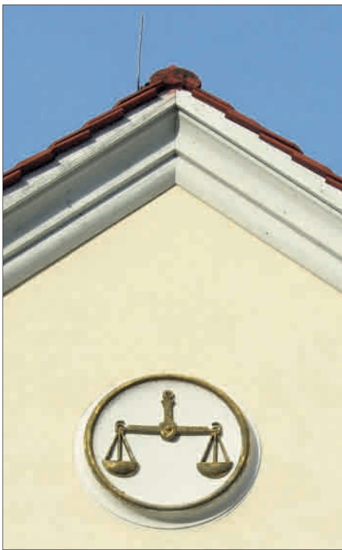
Gar nicht hoch genug kann man die Gerechtigkeit ansiedeln – so wie an diesem Hausgiebel

Die Schöffinnen und Schöffen wirken bei den Strafsachen gegen Erwachsene und Jugendliche bei den Amts- und Landgerichten mit. Für dieses Amt sollten sie an mindestens 12 Sitzungstagen im Jahr zur Verfügung stehen; bei den großen Strafkammern können sich die Sitzungen (mit Unterbrechungen) auch über mehrere Wochen erstrecken, sodass in Einzelfällen auch mehr als ein Dutzend Verhandlungstage im Jahr anfallen können. Für die Amtszeit von 2009 bis 2013 sucht die Stadt Freiburg ab sofort wieder engagierte Bürger, die sich für dieses Ehrenamt interessieren.