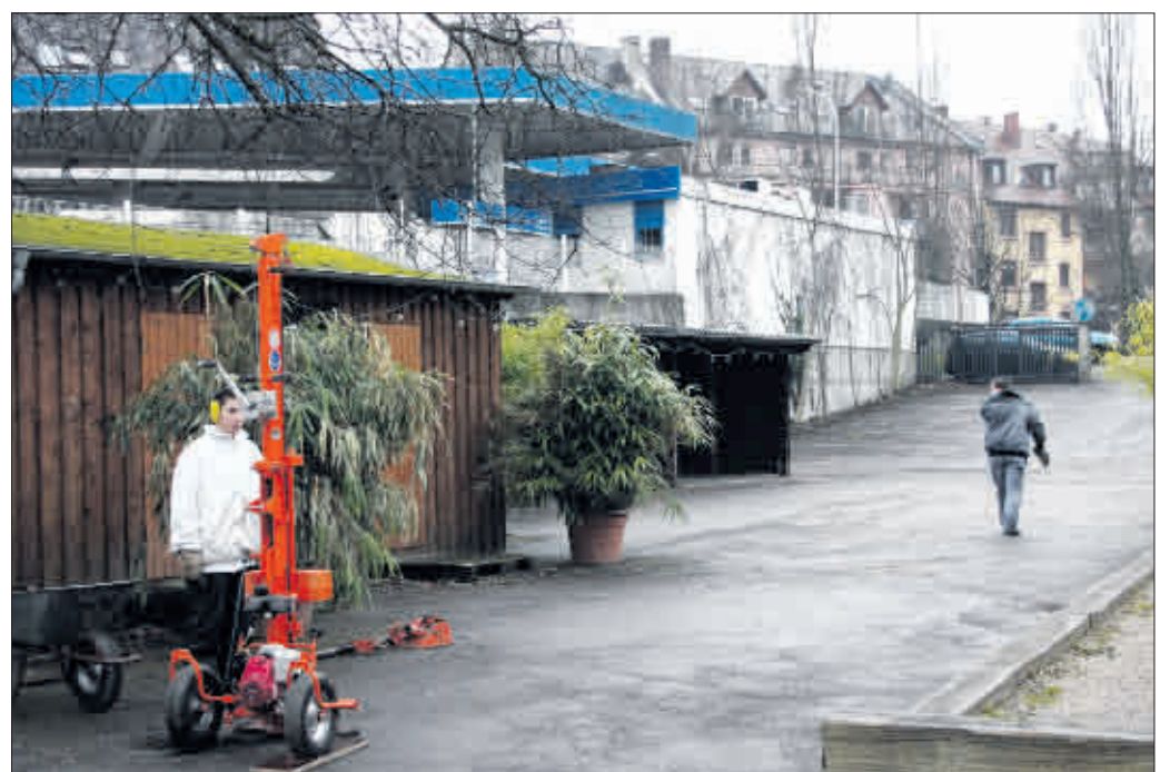
Am Tag nach der Gemeinderatsentscheidung begannen auf dem Areal des Ganter-Biergartens bereits vorbereitende Untersuchungen für den Kunsthallenbau

„Messmer Foundation“ und städtische Einrichtungen kooperieren