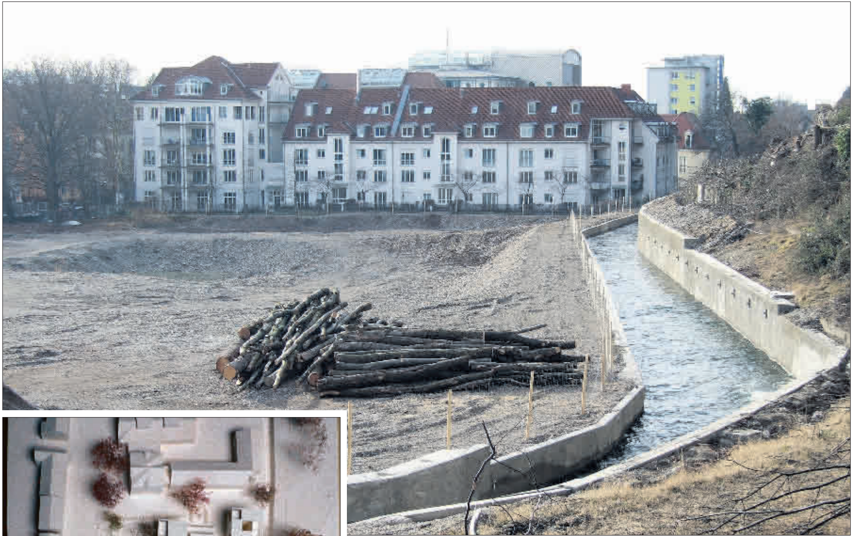
Blick vom Schlossberggrand (rechts) nach Westen über das Coats-Mez-Gelände und den Gewerbekanal. Das Modell zeigt die künftige Bebauung mit Stadtvillen. Auf der linken Seite befindet sich die Kartäuserstraße (Modell: Ackermann und Raff)

Für die städtebauliche Gestaltung hat der Investor in enger Zusammenarbeit mit dem Stadtplanungsamt einen Architektenwettbewerb ausgelobt, aus dem das Büro Ackermann und Raff aus Tübingen siegreich hervorgegangen ist. Stadtplanungsamtschef Wulf Daseking lobte vor allem die