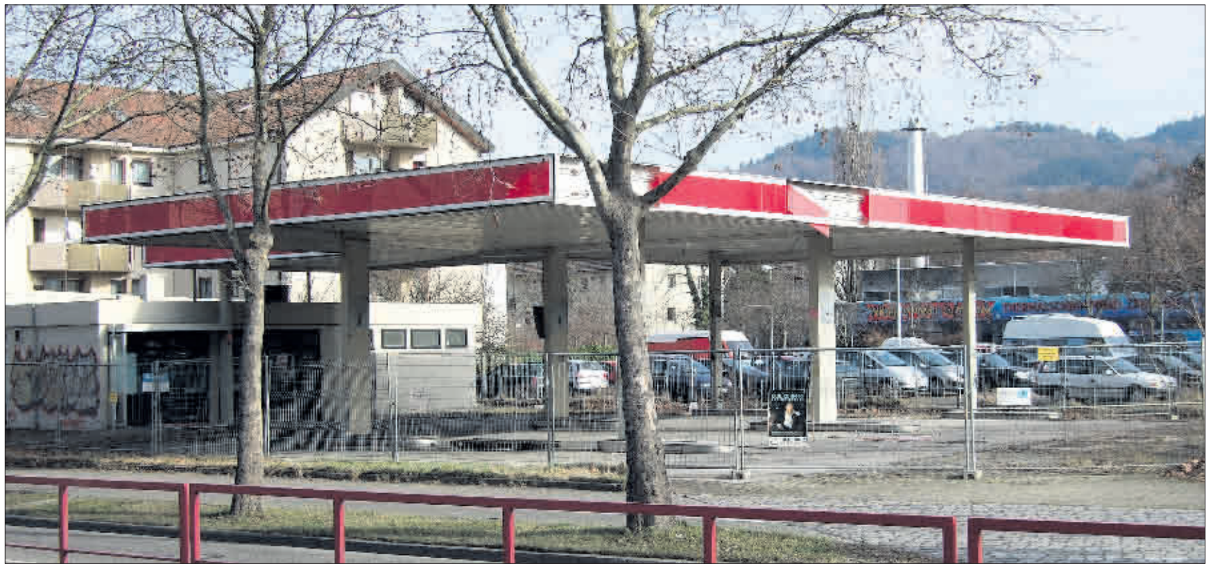
Treffpunkt statt Tankstelle: An der Zähringer Straße könnte ein neues soziales und kulturelles Zentrum entstehen

Auch im Faulerbad beginnen am Montag, den 18. Februar, neue Schwimmkurse für Erwachsene und Kinder. Letztere finden montags, mittwochs und freitags von 14 bis 18 Uhr statt und kosten 50 Euro (zuzüglich Badeeintritt). Für Erwachsene werden Anfänger-Schwimmkurse (mittwochs 17 Uhr) sowie Schwimmkurse zur Verbesserung der Schwimmtechniken (montags 17.45, 18.45 und 19.30 Uhr) angeboten. Diese Kurse umfassen 10 Übungseinheiten à 45 Minuten und kosten 75 Euro zuzüglich Badeeintritt. Für alle Schwimmkurse kann man sich am Mittwoch, den 13., und am Freitag, den 15. Februar, jeweils von 18.30 bis 20 Uhr im Eingangsbereich des Faulerbads anmelden.