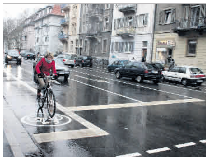
Mit Sicherheit besser ist die Eschholzstraße nach der Umgestaltung. Der Bereich südlich der Engelbergerstraße ist bereits fertig

Auch die Einführung einer Tempo-20-Zone hält das GuT für nicht zulässig, da diese nur in zentralen städtischen Bereichen mit einer hohen Dichte an Gewerbebetrieben sowie hohem Fußgängeraufkommen eingerichtet werden dürfen. Die Eschholzstraße erfüllt in keinem Teilbereich diese Voraussetzung.