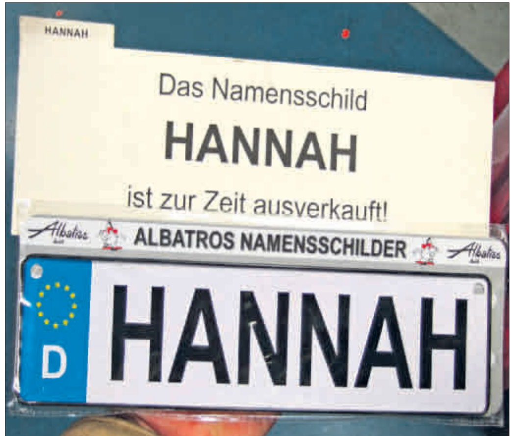
Der Vorname Hannah ist der Hit des Jahres und als Namensschild auch ein Verkaufsschlager. Erste Lieferengpässe sind schon aufgetreten

Waage und Maßband erbrachten folgende Rekordwerte: Das schwerste 2007er-Baby brachte stramme 5410 Gramm auf die Waage, das längste maß stolze 59 Zentimeter. Den größten Leibesumfang hat vermutlich jene Mutter gehabt, die einem Zwillingsspärgchen mit 3280 Gramm und 58 Zentimetern sowie 3090 Gramm und 53 Zentimetern das Leben schenkte.