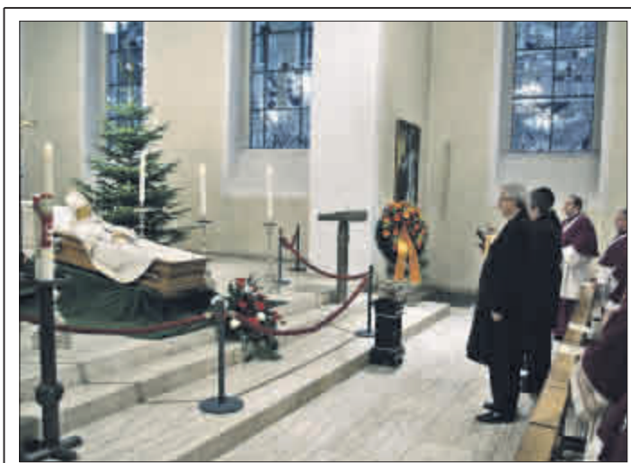
„Freund der Bürgerschaft und Förderer der Stadt“