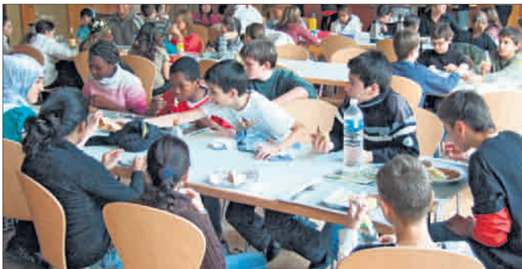
Ab Februar gibt es für Kinder aus einkommensschwachen Familien in Freiburger Schulen und Kindertageseinrichtungen das Mittagessen für einen Euro