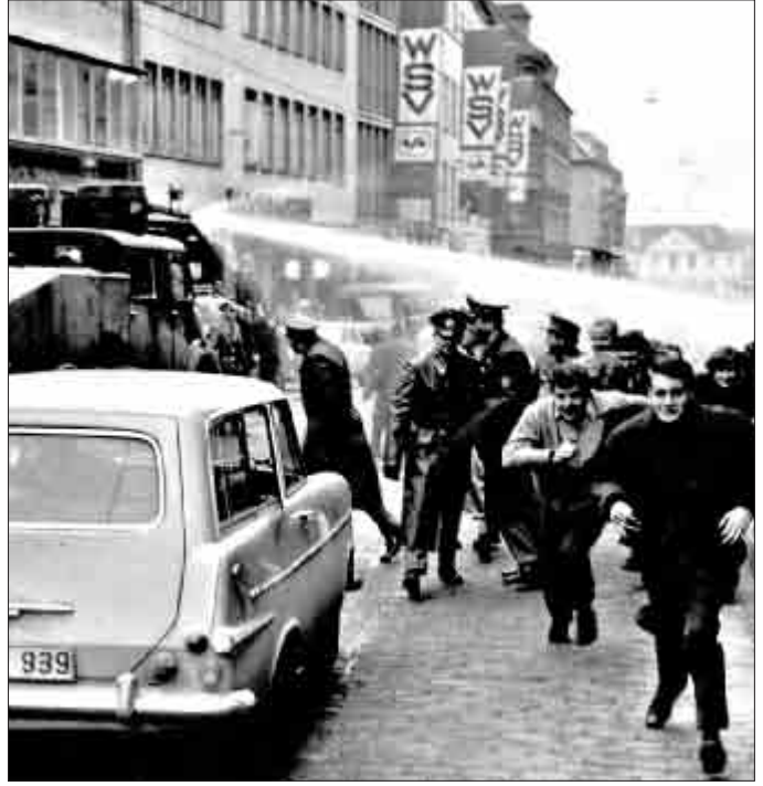
Wasserwerfer setzte die Polizei 1968 gegen Demonstranten in der Kaiser-Joseph-Straße ein. Damals gab es noch keine Fußgängerzone