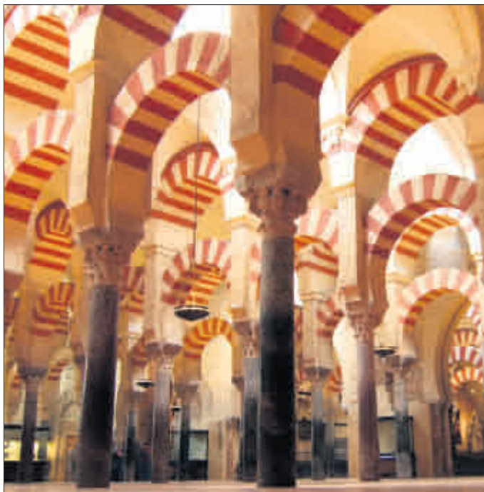
Allein die Besichtigung der Mezquita in Cordoba ist schon die Fahrt nach Andalusien wert. Die Bürgerreise bietet aber noch weit mehr