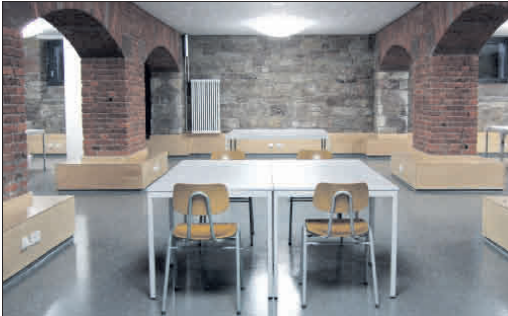
Dank Spenden und Engagement der Schule konnte der alte Gewölbekeller zu Schulräumen umgebaut werden