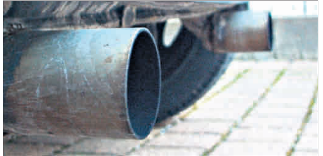
Quelle des Übels: Dieselmotoren belasten die Luft mit feinen Staubpartikeln, die ein erhebliches Gesundheitsrisiko darstellen. Ein Filter schafft Abhilfe

Am Montag beginnt eine landesweite Aktionswoche zur Umrüstung von Dieselfahrzeugen