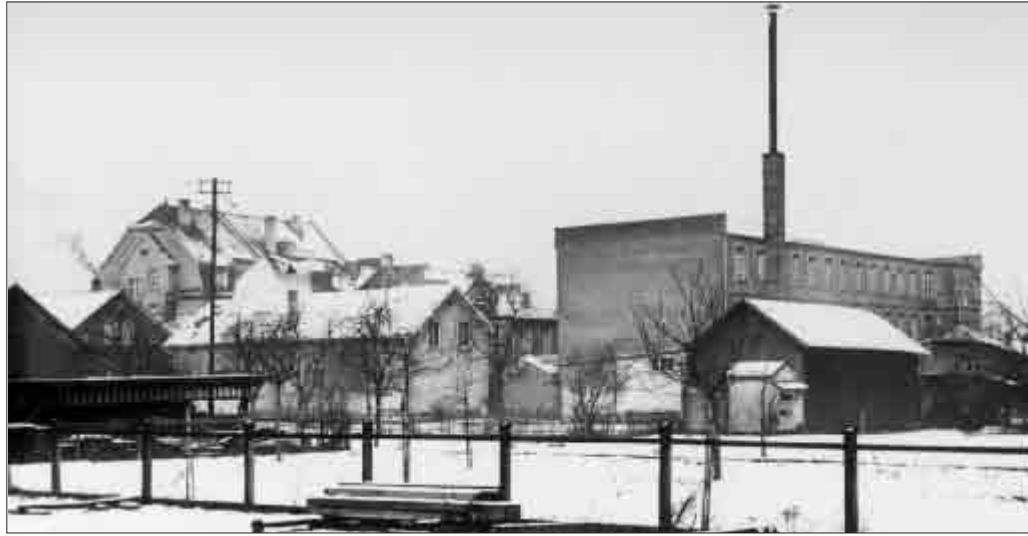
Zwischen der Habsburgerstraße (damals Adolf-Hitler-Straße), der Sautierstraße und dem Rennweg lag das berühmte Ostarbeiterlager, in dem rund 1000 Menschen, vor allem Sowjetbürger, untergebracht waren. Heute ist das Gelände mit Wohnhäusern bebaut – nur eine Stele erinnert an die dunkle Vergangenheit dieses Ortes

In Freiburg hat man sich in den vergangenen Jahren umfassend mit der Geschichte der Zwangsarbeit beschäftigt: Bereits im Vorfeld der städtischen Entschuldigungsverhandlungen hat das Stadtarchiv seine Forschungen intensiviert. Die Ergebnisse, die 2004 auch veröffentlicht wurden, machen die