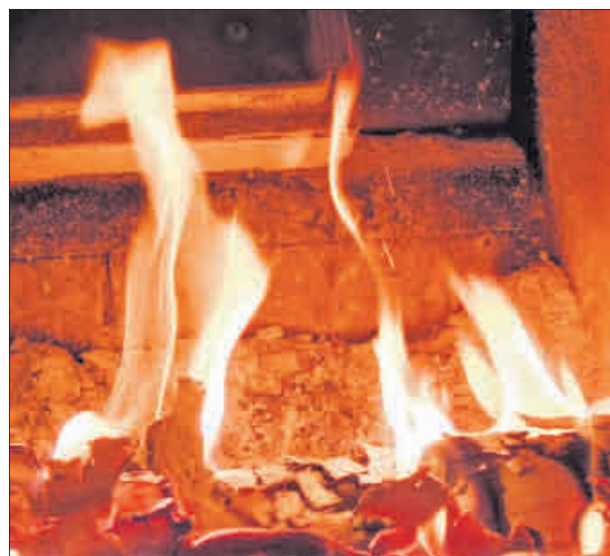
Holzöfen erfreuen sich nicht nur wegen des günstigen Brennstoffs wachsender Beliebtheit

Holz ist keinesfalls gleich Holz: Frisch geschlagen beträgt sein Wasseranteil je nach Holzart zwischen 45 und 60 Prozent. Nach ein bis zwei Jah-