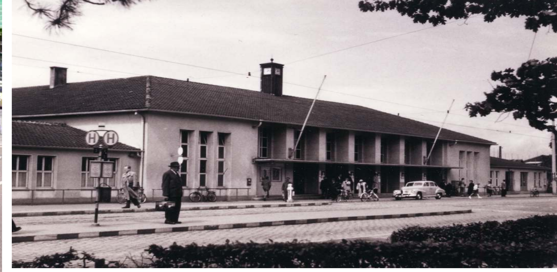
Bahnhof 1950 - The station in 1950