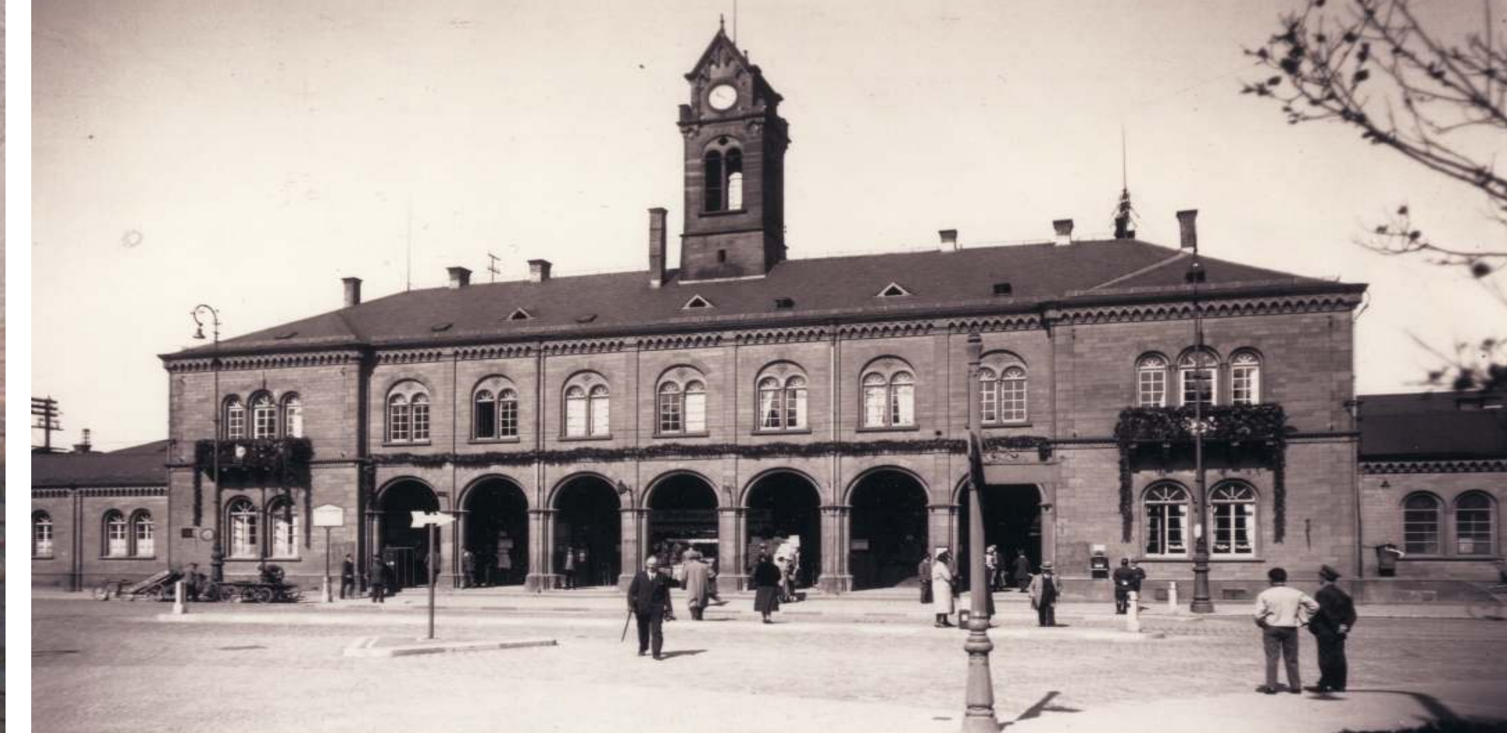
Bahnhof 1890 - The station in 1890