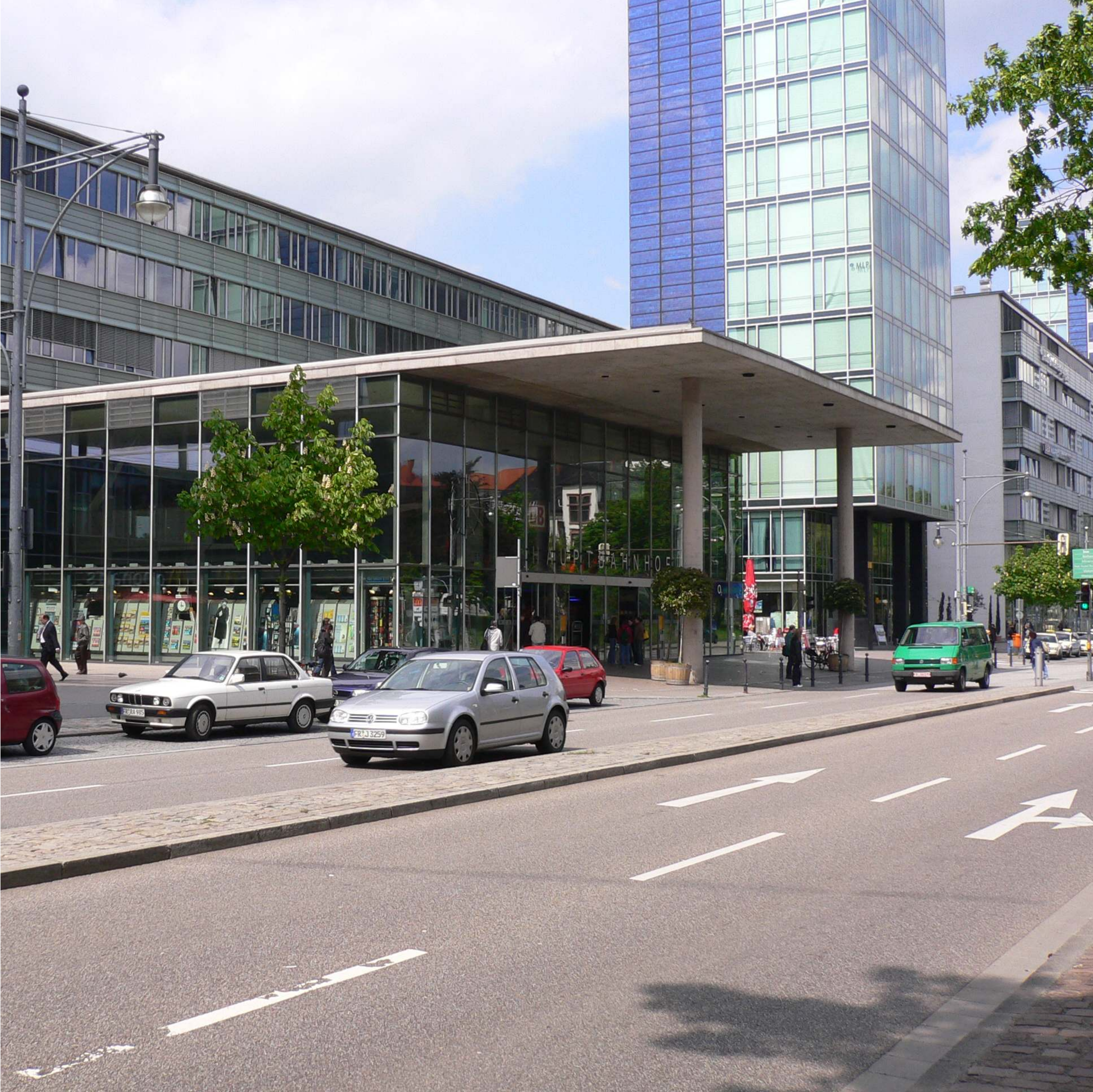
Eingangsbereich Bahnhof - Station's entrance