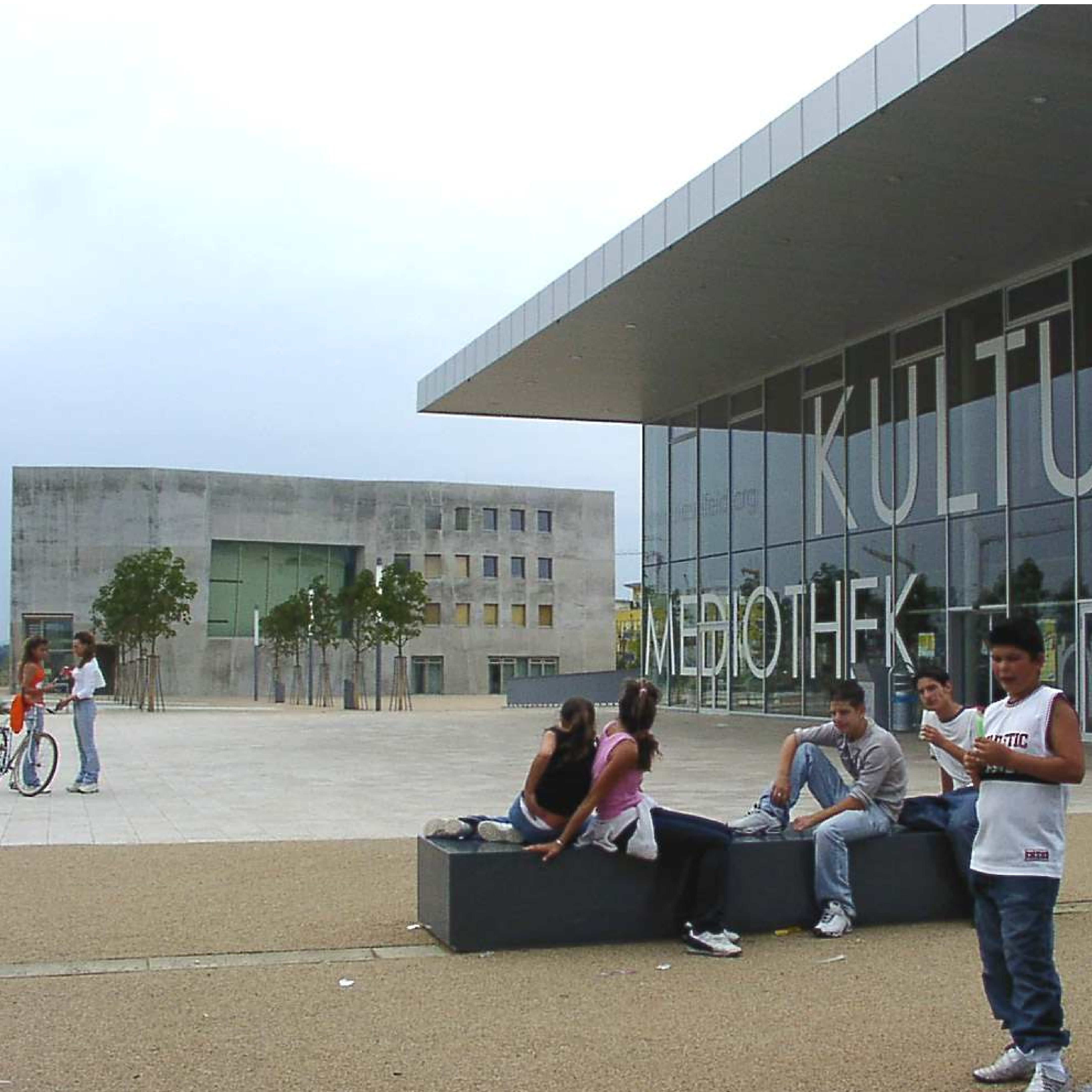
Maria von Rudloff Platz - Maria von Rudloff Square