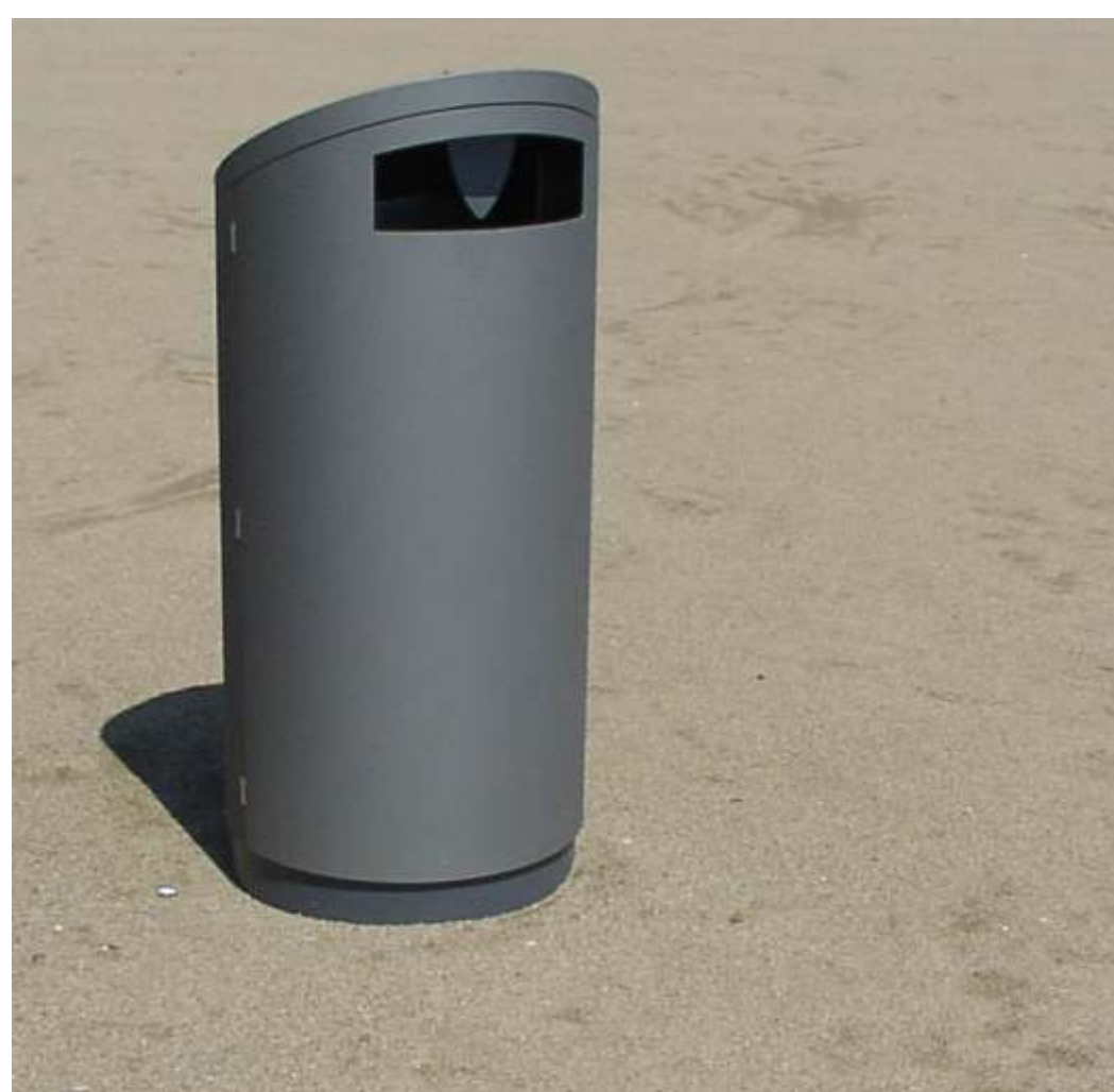
Papierkorb - Public Rubbish Bin