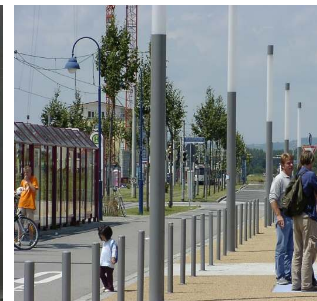
Licht und Poller - Streetscape