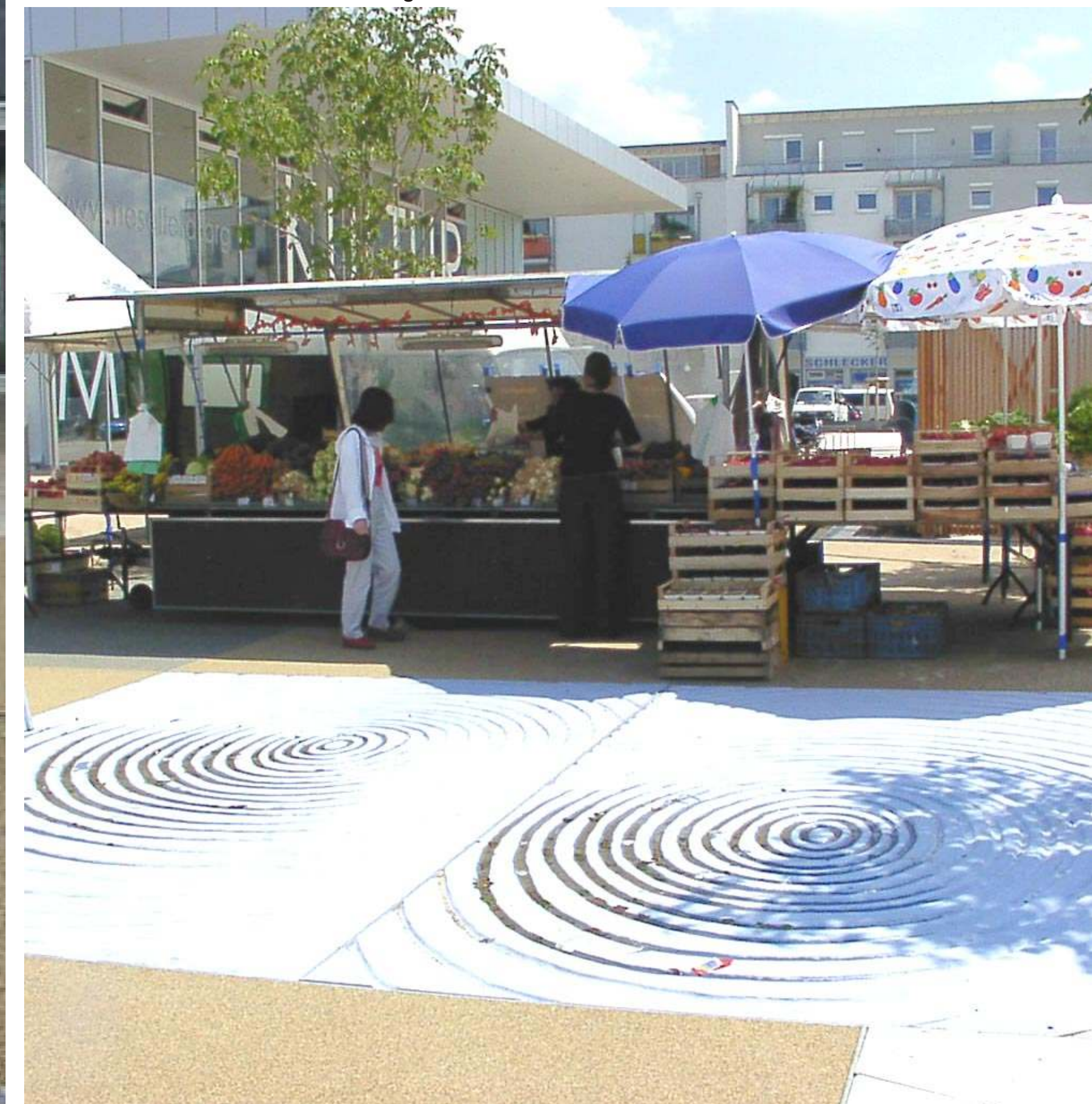
Markt - Market