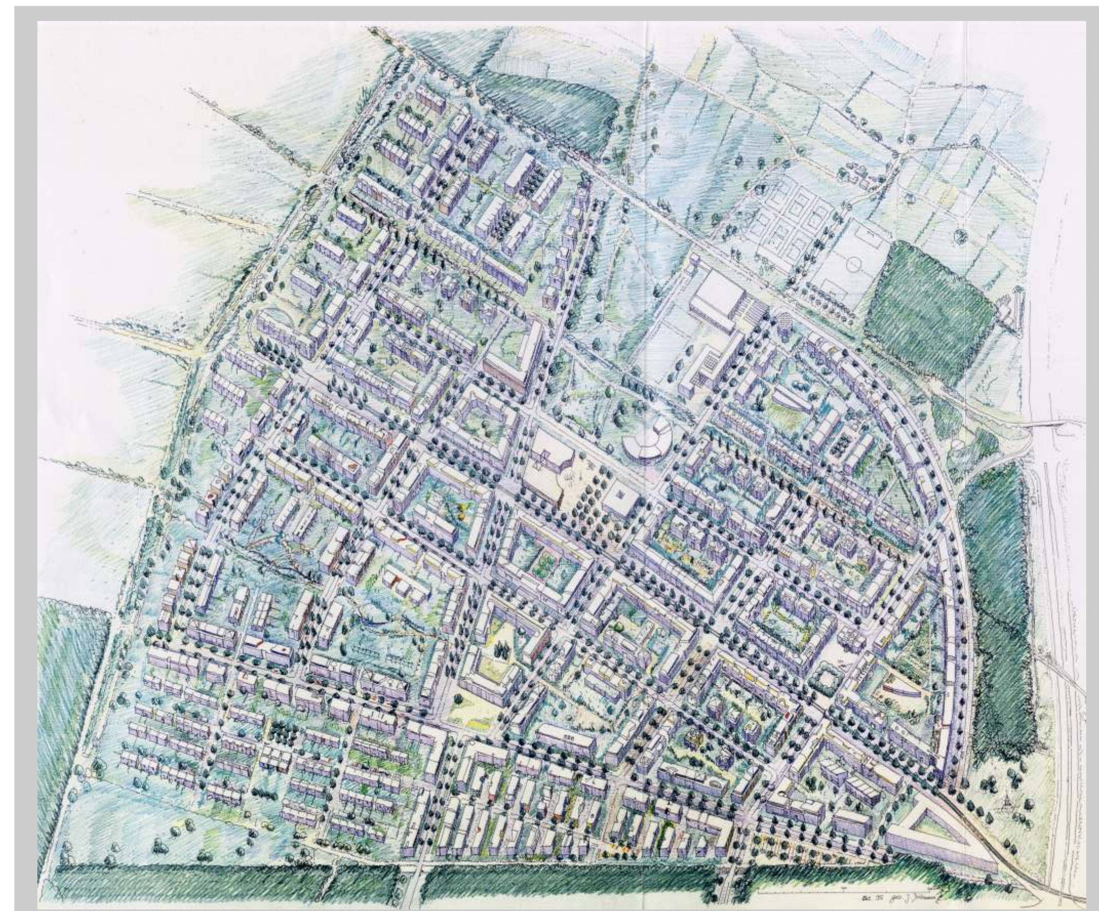
Vogelschau - Bird's Eye View

From 1991 onwards the eastern part of the Rieselfeld with 80ha was planned and built. Guided by an urban concept, densely builtup areas with compact blocks, streets, and squares in the tradition of the European town are typical. Currently there are 6,500 residents, but Rieselfeld will eventually accommodate about 10,000 inhabitants. Public open spaces will gradually be added as the development continues. Streets with no through-traffic as well as courtyards are designed above all for the residents. They also benefit from three town plazas of different sizes. The central Maria-von-Rudloff square was recently completed. It is located in the middle of the new district. On the square stand the new ecumenical church Maria Magdalena and the community center Mediathek . The yellow-colored square is flat and modern, and it serves numerous functions- local market, neighborhood festivals, Boule, and many other activities. A large ground picture created by Sandra Eades appears in part where the market is held. At present the young square is somewhat bare and overshadowed by the two buildings. In time, however, a "little forest" in the middle will mature and soften the square.