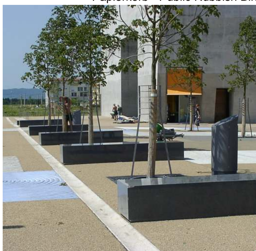
Sitzbänke - Stone Benches