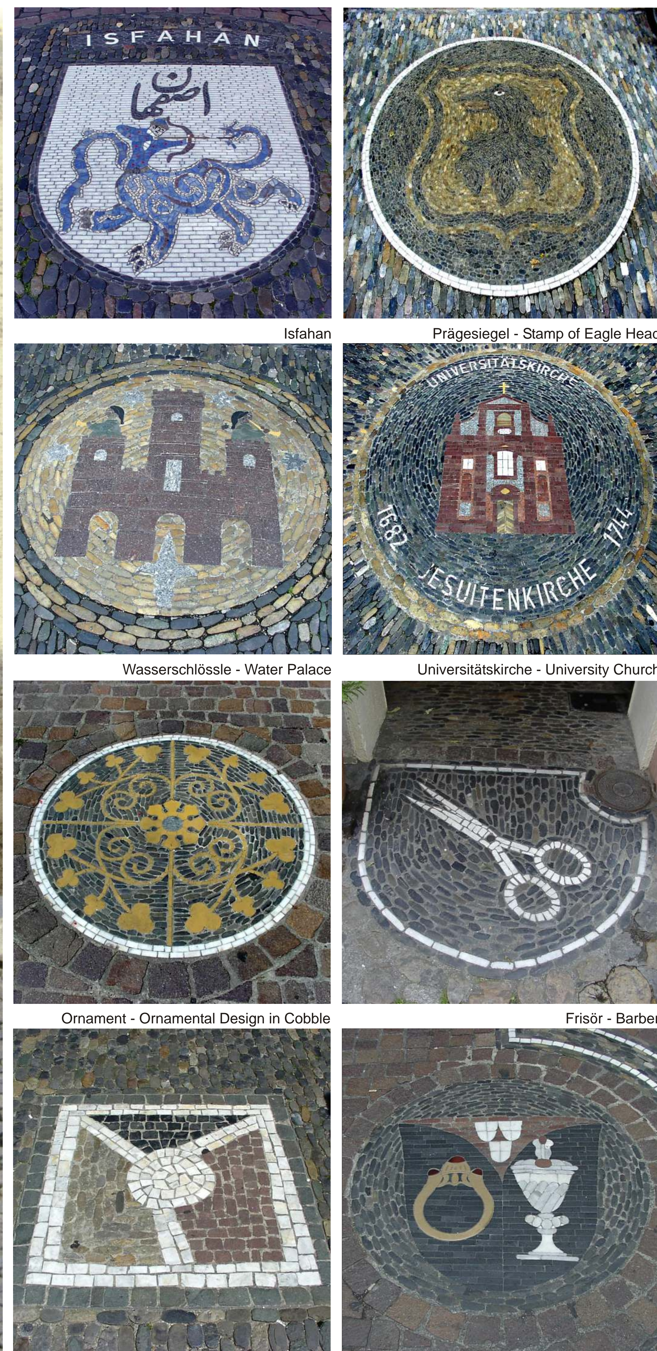
Passagensymbol - Shopping Arcade Symbol