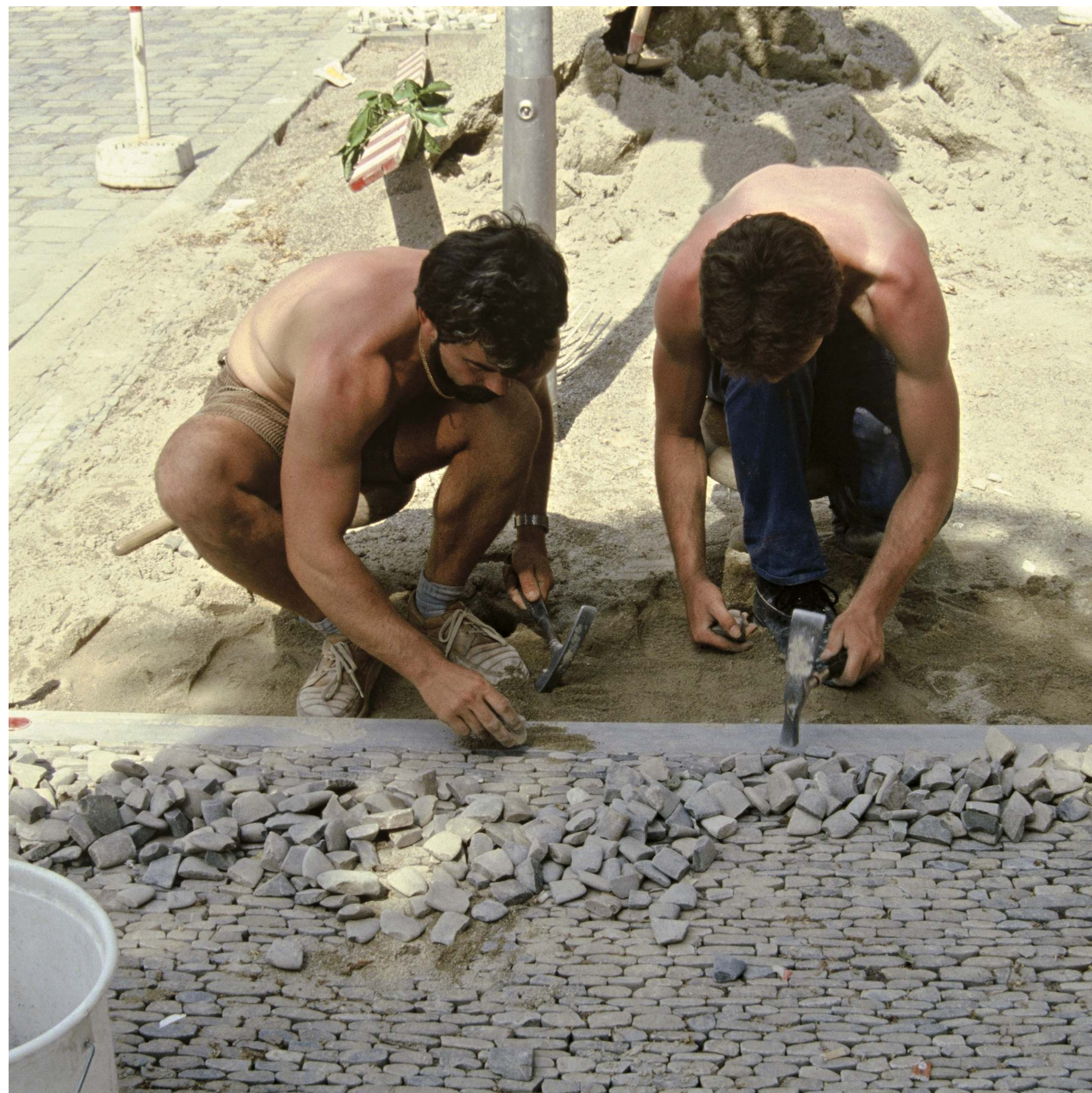
Pflasterer bei der Arbeit - Workers Laying Stones