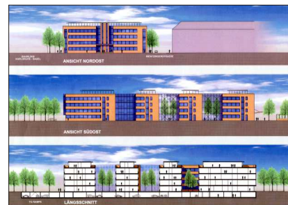
Ansichten, Schnitt, Unmüssig Projekt GmbH