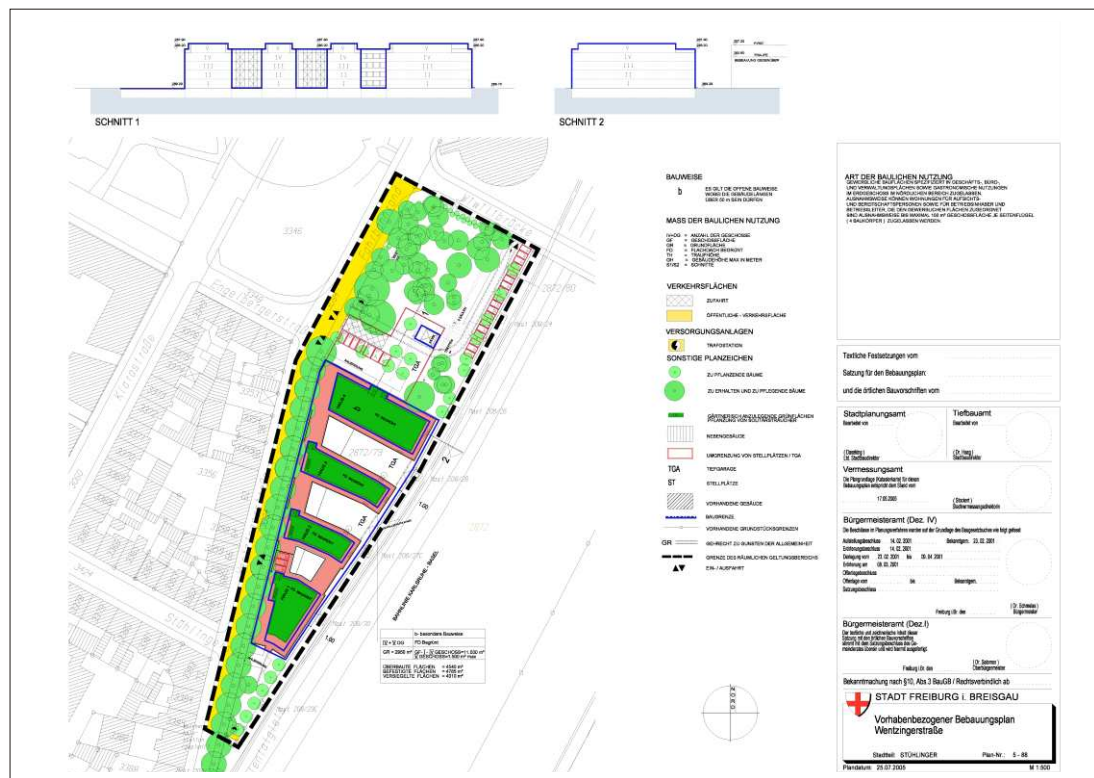
Vorbaubezogener Bebauungsplan 5-88 Wentzingerstraße, Unmüssig Projekt GmbH