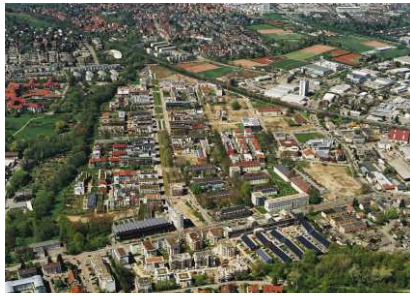
Luftbild, Elsässer Luftbild GmbH, 2005