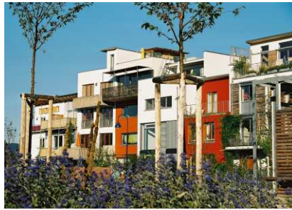
"Vauban typische" Häuserzeile an der IV. Grünsperre, 2005