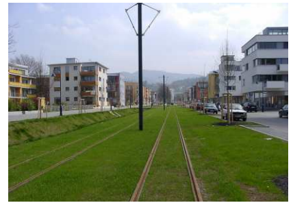
Trasse an der neuen Stadtbahnlinie Nummer 3, 2005