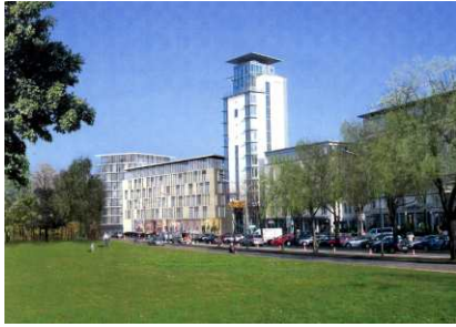
Zukünftiger Neubau am Fahnenbergplatz, wwa