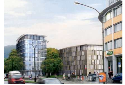
Zukünftiger Neubau am Fahnenbergplatz, wwa