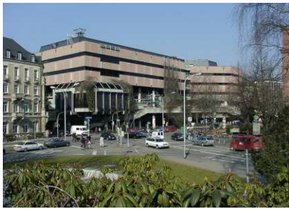
Bestandsfoto Universitätsbibliothek, 2003