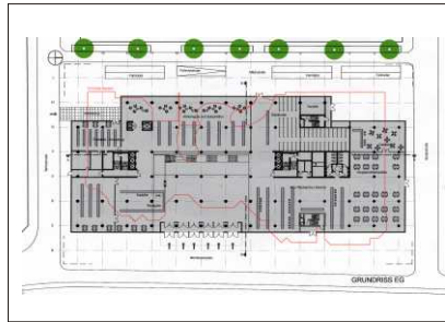
Grundriß Erdgeschoß, Entwurf Universitätsbauamt, 2005