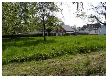
Blick auf das neue Baugebiet, 2006