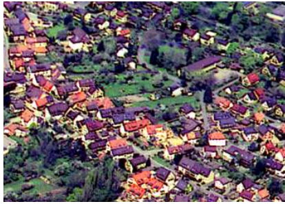
Luftbild Stuttgarter Luftbild Elsässer GmbH, 2000