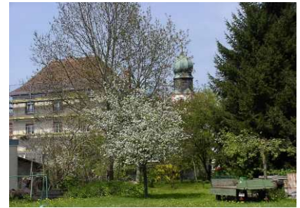
Blick auf das neue Baugebiet, 2006