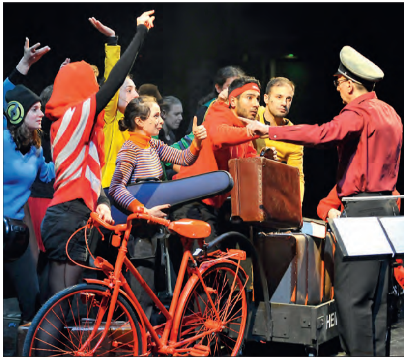
Das Heim & Flucht Orchester mischt die Orchesterlandschaft auf. Jugendliche ab 16 Jahren können mitmachen.

Wer selbst auf der Bühne stehen und mitmachen möchte, darf das auch in unserem Kinderorchester, dem Kinder- und Jugendchor oder seit dieser Spielzeit im neu gegründeten Heim & Flucht Orchester.