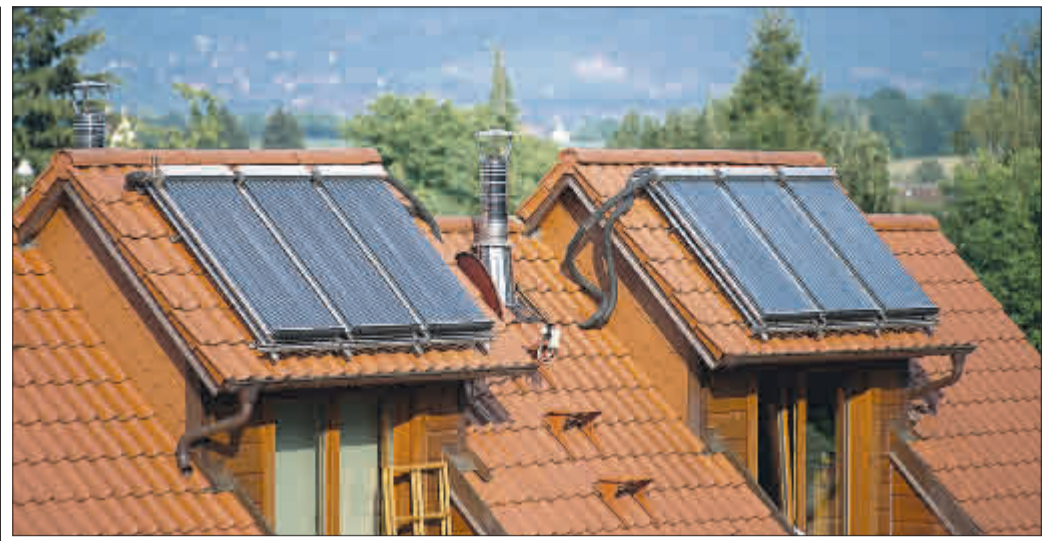
Kollektoranlage in Munzingen