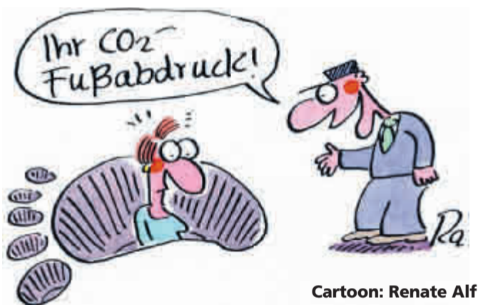
Cartoon: Renate Alf

Der gut gedämmte Warmwasserspeicher im Keller ist die Vorratskammer für die solar erzeugte Wärme, die ja nicht immer dann benötigt wird, wenn die Sonne gerade scheint. In einem hohen, schlanken Speicher kommt es durch geschickte Be- und Entladung zu Temperaturschichtungen im Wasser. Während kaltes Wasser nach unten sinkt, steigt warmes Wasser nach oben.