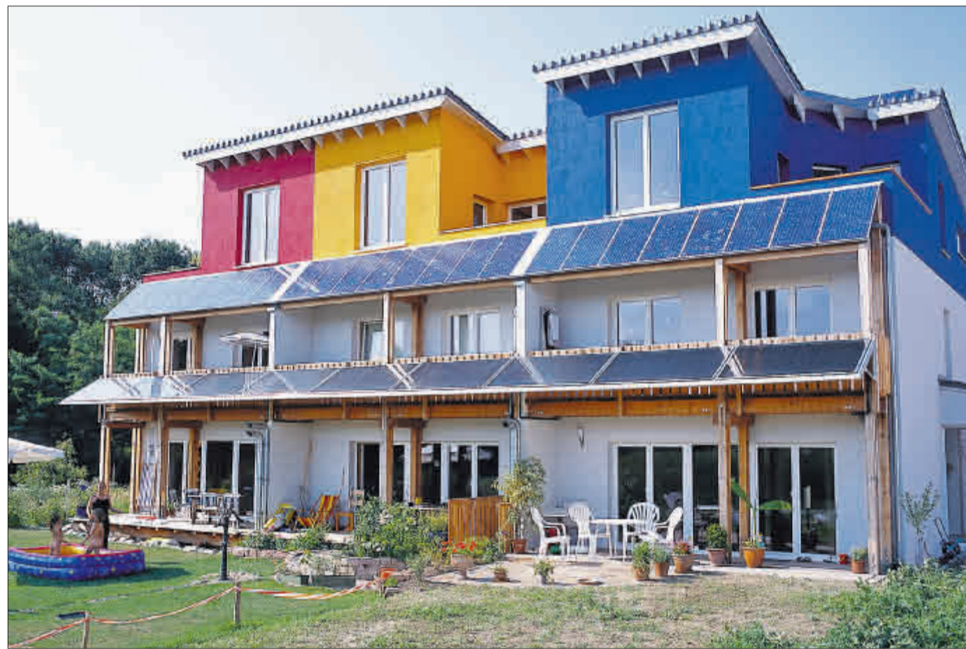
Diese Reihenhäuser im Rieselfeld sind oben mit Photovoltaikanlagen, unten mit Kollektoren ausgestattet

Entscheidet man sich für eine solarthermische Anlage, fällt die Rechnung nicht ganz so leicht. Statt eine jährliche Vergütung einzustreichen, hat man eine regelmäßige Einsparung