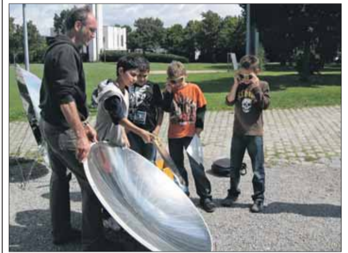
Sogar Feuer anzünden kann man mit Hilfe der Sonne. Famos zeigt, wie's geht.

Anmeldung für „Famos“ ab sofort beim Umweltschutzamt, Telefon 201-6101 oder per E-Mail unter SolarRe@stadt.freiburg.de. Anmeldungen sind auch per Fax unter 201-6199 möglich.