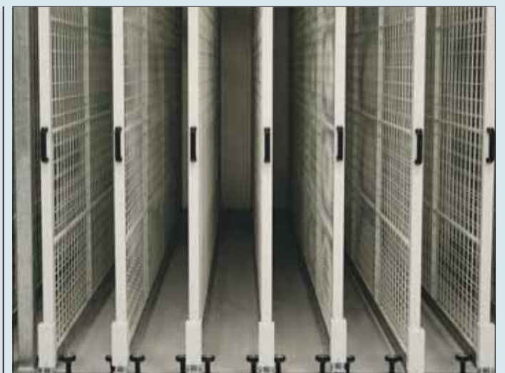
In solchen „Zuganlagen“ mit herausziehbaren Wänden werden in Zukunft Gemälde geschützt und übersichtlich aufgehängt.