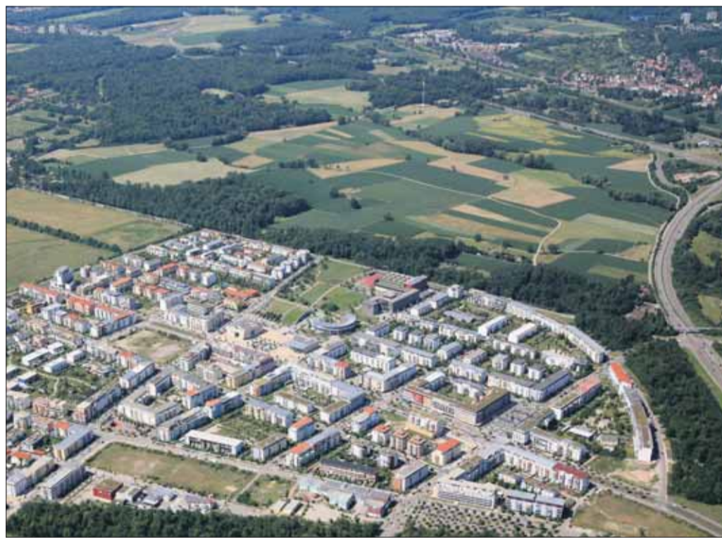
Drei Tage nach der Gemeinderatsdiskussion präsentierten vier Fraktionen einen Vorschlag für eine neue Baufläche: Nördlich des Rieselfelds sehen CDU, SPD, FDP und Freie Wähler Platz für rund 5000 neue Wohnungen.

Gemeinderat diskutiert „Kommunales Handlungsprogramm Wohnen“