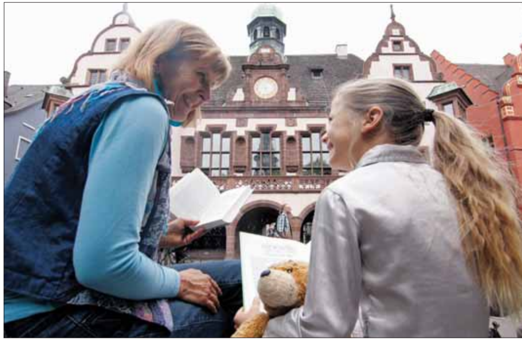
Für große und kleine Bücherwürmer hat das „Lesende Rathaus“ interessante Angebote.

Der Eintritt zu den Veranstaltungen ist frei. Weitere Informationen: Stadtbibliothek, Tel. 201-2207, E-Mail: stadtbibliothek@stadt.freiburg.de, Internet: www.freiburg.de/stadtbibliothek