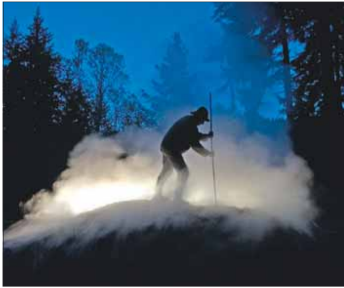
Ein rauchender Meiler erinnert an vergangene Zeiten.

Bei Günterstal brennt seit gestern wieder ein Kohlenmeiler