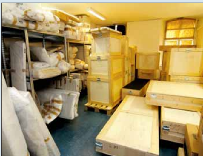
Die provisorische Lagerung der Ethnologischen Sammlung in der Kartaus ist nicht nur unpraktisch, sondern schadet auf Dauer den Gegenständen.

Standort: Weißenberglstraße im Gewerbegebiet Hochdorf Maße: Zweigeschossiger Bau, Länge 96 m, Breite 29 m Bruttogeschossfläche: 5657 qm davon Stiftungsverwaltung 625 qm Erzdiözese 300 qm Erweiterungsfläche: 1700 qm Investition FSB: 6,3 Mio. Euro Nettomietkosten: 326 000 Euro/a Sammlungsstücke: ca. 200 000