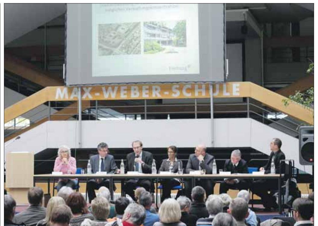
Auf großes Interesse stießen die bisherigen Informationsveranstaltungen zum Rathausneubau.

Viele dieser Befürchtungen werden vom Gutachter entkräftet. So sei die zusätzliche Verkehrsbelastung im Stühlinger nur minimal, was unter anderem an der optimalen ÖPNV-Anbindung liegt. Zusatznutzungen wie Bäcker, Kiosk, Bank, Post oder Kfz-Schildermacher sollen ins Konzept in-