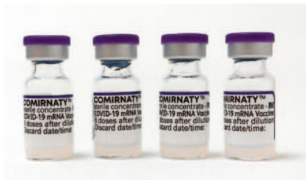
Geimpft wird mit dem BioNtech-Impfstoff