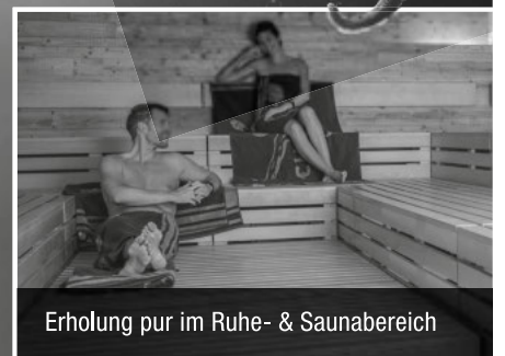
Erholung pur im Ruhe- & Saunabereich