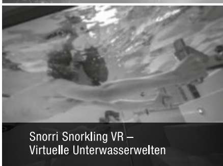
Snorri Snorkling VR – Virtuelle Unterwasserwelten