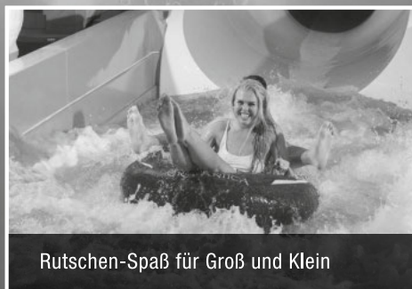
Rutschen-Spaß für Groß und Klein